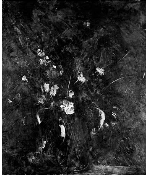
sl.2. Klonovi, 1998., Fanjeaux ulje na platnu, 100 x 80 cm