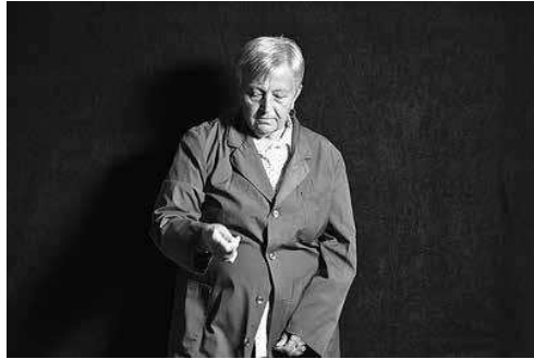
sl.4. Radionica Bojana Mucka s radnicama i radnicama Varteksa u Varaždinu, foto: Kosjenka Laszlo Klemar