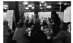
sl.5. Tin Dožić, „Kad strojevi stanu onda je kao da si gluhi“, 2019. zvuk, uzorci rada šivaćih strojeva Bagat (iz Državnog arhiva u Zadru),

print prikaza zvučnih valova izložba „Skrojene budućnosti?“ (Tehnički muzej Nikola Tesla), foto: Nina Đurđević