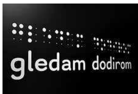
sl.1. Vizualni identitet izložbe, Studio Rašić+Vrabec