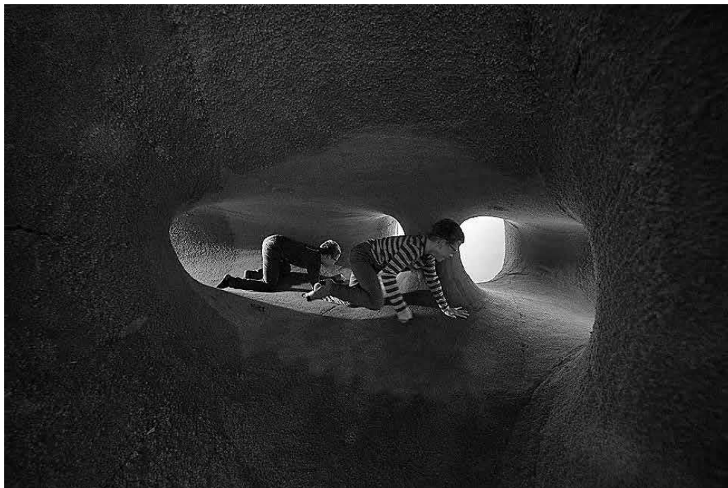
sl.8. Djeca u instalaciji TUFT kolektiva Numen For Use. Uzbudljivo, svaka sekunda savršena!! (iz Knjige dojmova)

od tradicionalnog pristupa oslonjenoga na crtež. Za prof. Parlov razvoj likovnosti počinje upoznavanjem prostora i trodimenzionalnim oblikovanjem, svladavanjem volumena, površina, tekstura i boje (ako postoji ostatak vida). Slijedi dvodimenzionalna ploha i, naposljetku, crtež, koji je za slijepo osobe apstraktan, pa je Parlov razvila tehnike izrade taktilnog crteža, što je prikazano na izložbi, a i posjetitelji su se mogli okušati u izradi taktilnih crteža uz pomoć magneta. Ono što nam se čini vrijednim naglasiti jest da način uvođenja djeteta u likovnost koji Parlov primjenjuje s djecom oštećena vida korespondira s prirodnim senzomotoričkim razvojem djeteta (Ayres), koje u najranijoj dobi ima jak poriv za upoznavanjem svijeta putem tjelesnog iskustva, kretanja i dodira te ima potencijala za širu primjenu u ranom likovnom odgoju djece i zaslužuje pozornost šire javnosti. Ono što je dobro za slijepo dobro je za sve.