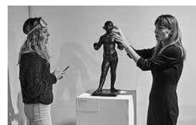
sl.4. Izložbeni postament u obliku neprekidnog meandra slijepim osobama omogućuje lakše snalaženje u prostoru i samostalno kretanje