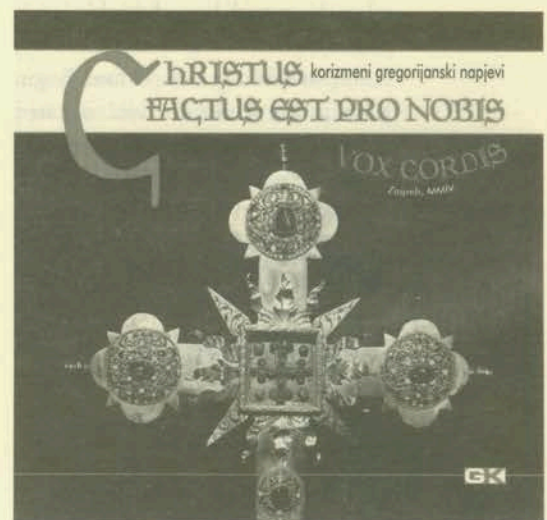
CHRISTUS FACTUS EST PRO NOBIS Nakladnik: Glas Koncila, 2004.