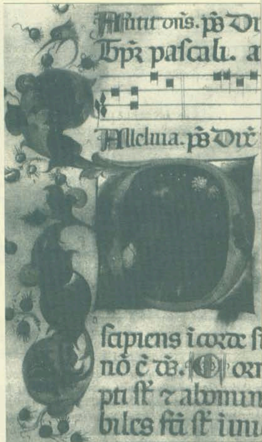
Inicijal, Psaltir, 14.–15.st., Rab