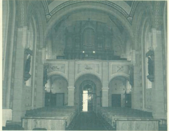
Župna crkva u Molvama – pogled na pjevalište.

nisu nastale za potrebe kršćanskih liturgijskih slavlja, no kršćanska su liturgijska slavlja poticala razvitak toga glazbala do onih zvukovnih mogućnosti radi kojih su orgulje dobile naziv KRALJICA INSTRUMENTA.