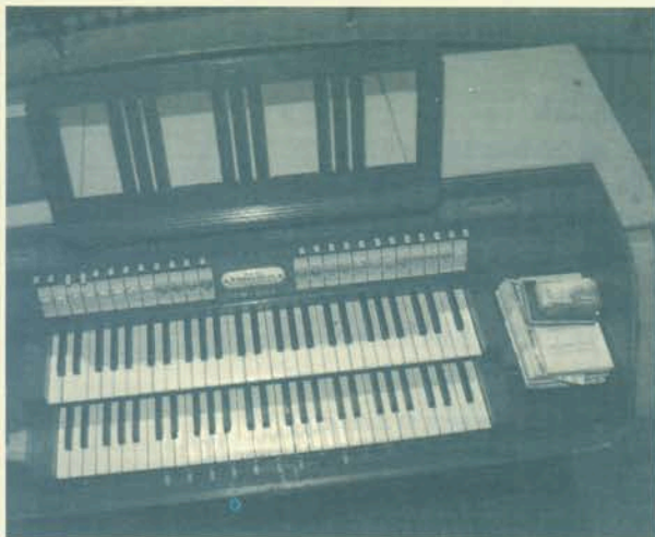
Sviraonik orgulja župne crkve u Virju.

U navedenom djelu L. Šaban navodi da u IX. i X. st. posjeduju orgulje neke samostanske i stolne crkve, a da se tijekom XII. i XIII. st. grade orgulje u (stolnim) crkvama mnogih europskih gradova. Početak gradnje orgulja u Europi se, dakle, događao u vrijeme kada i obnova liturgijskog – gregorijanskog pjevanja. Među ostalim tadašnjim obnovnim zahvatima je i tropiranje liturgijskih tekstova iz čega nastaju novi