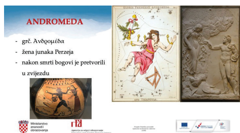
Slika 3: Primjer dijela jedne videolekcije

Uz ostale predmete, svoje su zasluženno mjesto u ovome projektu dobili i klasični jezici, pa su tako učitelji i nastavnici grčkog i latinskog jezika iz brojnih osnovnih i srednjih škola diljem Hrvatske marljivo prionuli izradi videolekcija. Voditelj predmetnog tima videolekcija klasičnih jezika je Tonći Maleš, a koordinatorica Dubravka Matković, dok na izradi videolekcija sudjeluje dvadesetčetvero kolegica i kolega. Videolekcije se izrađuju po temama, tjednima i mjesecima, dok redosljed obrađenih tema prati Okvirne godišnje izvedbene kurikule izrađene od strane Ministarstva na početku školske godine. 2 Njima se određuje skup temeljnih odgojno-obrazovnih ishoda/nastavnih sadržaja koje učenici na nacionalnoj razini trebaju ostvariti, dok ih učitelji i nastavnici imaju autonomiju prilagođavati sukladno potrebama svojih učenika. Svakako je vrijedno spomenuti kako videolekcije klasičnih jezika pokrivaju čak sedam različitih obrazovnih programa, pa su tako snimljene videolekcije za latinski jezik u osnovnim školama od 5. do 8. razreda, grčki jezik u osnovnim školama od 7. do 8. razreda, latinski jezik za 1. i 2. razred općih gimnazija, latinski i grčki jezik za početnike od 1. do 4. razreda klasičnih gimnazija te latinski i grčki jezik za nastavljače od 1. do 4. razreda klasičnih gimnazija čime su pokriveni gotovo svi programi i predmetni kurikuli klasičnih jezika.