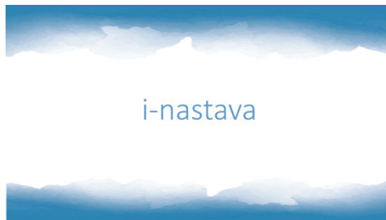
Slika 2: Naslovni slide svake videolekcije

U suradnji s Agencijom za odgoj i obrazovanje u rujnu je započelo snimanje videolekcija za sve predmete od 5. do 8. razreda osnovnih škola, te od 1. do 4. razreda gimnazija. Projekt i-nastava zamišljen je kao niz interaktivnih videolekcija koje, prateći okvirne godišnje izvedbene kurikule svih predmeta, obrađuju novo gradivo od početka do kraja školske godine i pomažu učenicima u njegovom savladavanju te nastoje osigurati dostupnost sadržaja svima.