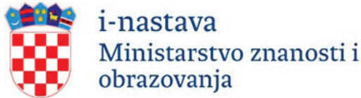
Slika 1: Službeni logo projekta

Početak školske godine 2020/21. Ministarstvo znanosti i obrazovanja pokrenulo je projekt izrade videolekcija pod nazivom i-nastava . 1 Projekt je osmišljen kao odgovor na situaciju s epidemijom COVID-19 i zbog nesigurnosti oko mogućnosti izvođenja nastave uživo tijekom aktualne školske godine, a kao pomoć i podrška učiteljima, nastavnicima i učenicima u slučaju održavanja nastave na daljinu, koristeći informacijsko-komunikacijske tehnologije.