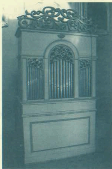
Orgulje u Kraljevoj Sutjesci

Najstarije orgulje u Hercegovini danas se nalaze u župnoj crkvi sv. Ante u Humcu. Izradila ih je tvrtka Heferer 1881. god. za franjevačku župnu crkvu sv. Petra i Pavla u Mostaru. To su bile prve orgulje u Hercegovini. Budući da je uprava samostana naručila od istog graditelja nove veće orgulje od 19 registara, koje su 1961. god. postavljene, stare su orgulje temeljito restaurirane i premještene u župnu crkvu sv. Ante u Humcu. Orgulje imaju jedan manual, pedal i 12 registara.