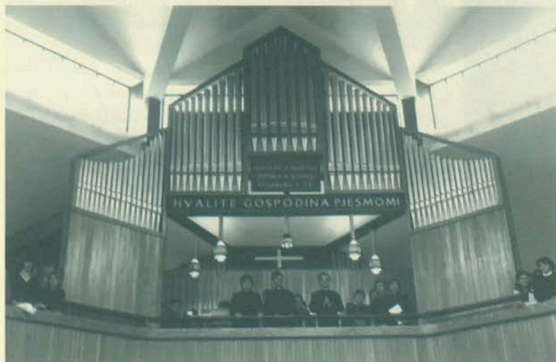
Orgulje u Skopaljskoj Gračanici