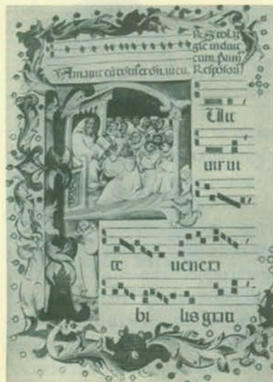
Guillaume Dufay, Antifona (oko 1400. g.)

2. Tenor (lat. tenere , držati) – nota repercussa , dominantna, recitativna nota, ton na kojem se recitiraju stihovi psalma. Naziv dominantna opravdava činjenica da je taj ton zapravo dominantna starocrkvenoga načina u kojemu se određeni psalam pjeva. Kod izvođenja vrlo je važno održati na tenoru dobru artikulaciju ritma riječi, tečnost i pravilnost izgovora, posebno ako se izvodi na govornom jeziku.