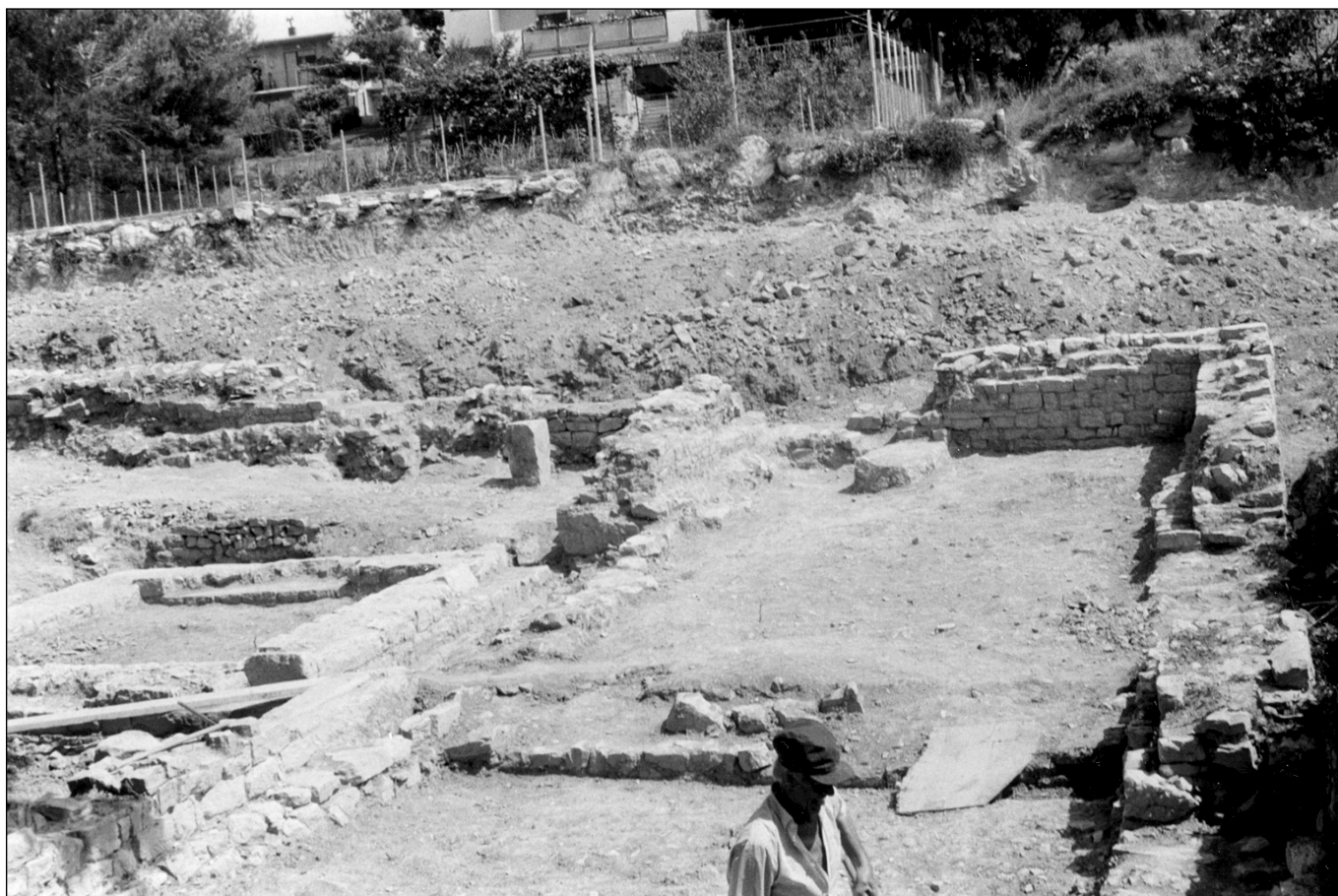
sl. 3 Detalj istočnog trakta kasnoantičke vile

Nedaleko od tog lokaliteta, prema sjeveru, nalazi se predio zvan Polača, s vidljivim ostacima sačuvanim i do 5-6 m visine, jednog kasnoantičkog rimskog zdanja, ojačanoga u vanjskom zidnom plaštu kontraforima. Nema dvojbe da je riječ o seoskoj vili ( villa rustica ) neke rimske obitelji, koja ju je izgradila na svome imanju u blizini izvora pitke vode, koja se i dan danas nalazi u njenoj blizini (sl. 1).