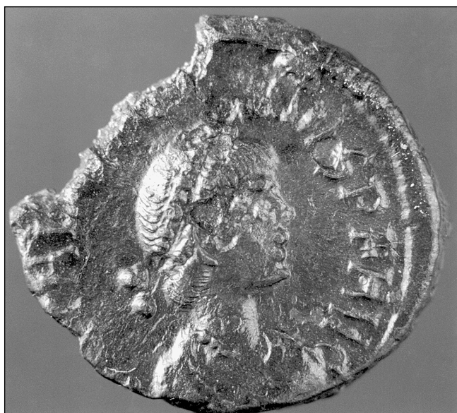
sl. 5 Rimski novac s likom cara Valentiniana - AV

sv. Marije ili Gospe od Site je u mletačko-turskim ratovima bila napuštena i u ruševnom stanju što svjedoče podaci iz vizitacije splitskog nadbiskupa Stjepana Cosmia iz XVII. stoljeća. Nakon oslobođenja Poljica od Turaka u drugoj polovici XVII. st. ovaj, nekada benediktinski posjed sa crkvom sv. Marije ulazi u sastav splitske nadbiskupije i u popisima posjeda i