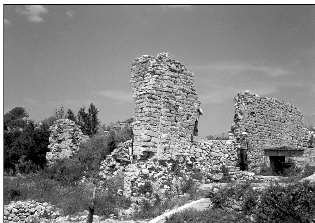
sl. 1 Pogled na kasnoantičku vilu na lokalitetu Polača u Strožancu

Naselje Strožanac smješteno je u neposrednoj blizini Splita, nedaleko od morske obale uz Jadransku cestu prema Omišu, na području koje se naziva Podstranska rivijera. U širem smislu to je dio veće cjeline Primorskih