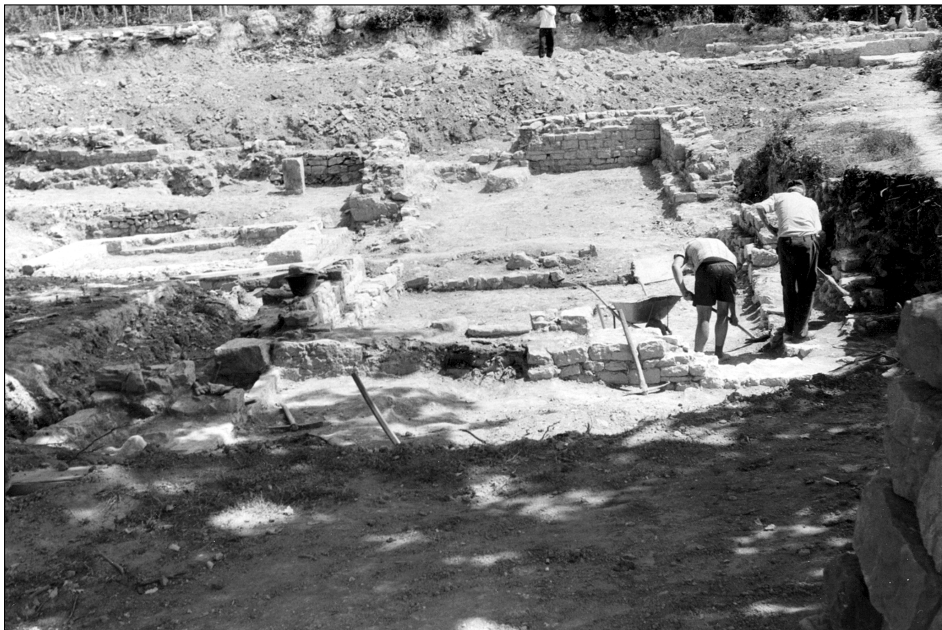
sl. 2 Pogled na ostatke istočnog dijela kasnoantičke vile

ili Donjih Poljica, koja se u dužini od nekih 15 km uz morsku obalu protežu od ušća rijeke Cetine na istoku do ušća rijeke Žrnovnice na zapadu. Primorska Poljica prema unutrašnjosti se nastavljaju na Srednja i još dalje na Gornja Poljica, tvoreći jedinstvenu i zaokruženu zemljopisno-povijesnu, jezičnu, pravnu i kulturološku cjelinu u kojoj pulsira život od davnih prapovijesnih vremena pa do naših dana (Rubić, 1968: 7-31). To je prostor kojeg nastavahu ilirska (delmatska plemena) Onastini, Nerestini i Pituntini, koje spominju još stari antički pisci Plinije i Ptolomej. Oni trguju s helenističkim svijetom, a u vrijeme rimske uprave, veći dio tog prostora postaje sastavni dio salonitanskog agera s novom izmjerom i parcelizacijom zemljišta na kojem niču brojna obiteljska gospodarska imanja s građevnim sklopovima ( villae rusticae ) rimskih robovlasničkih obitelji, oslobođenika ili isluženih vojnika (veterana), koji se doseliše s Apeninskog poluotoka i naseliše se u velikom gradu Saloni ili u njegovoj okolini. To nam potvrđuju brojni arheološki ostaci i nalazi, uzduž čitavog poljičkog primorja od Žrnovnice do Omiša (latinski natpisi, groblja, ostaci građevina itd.).