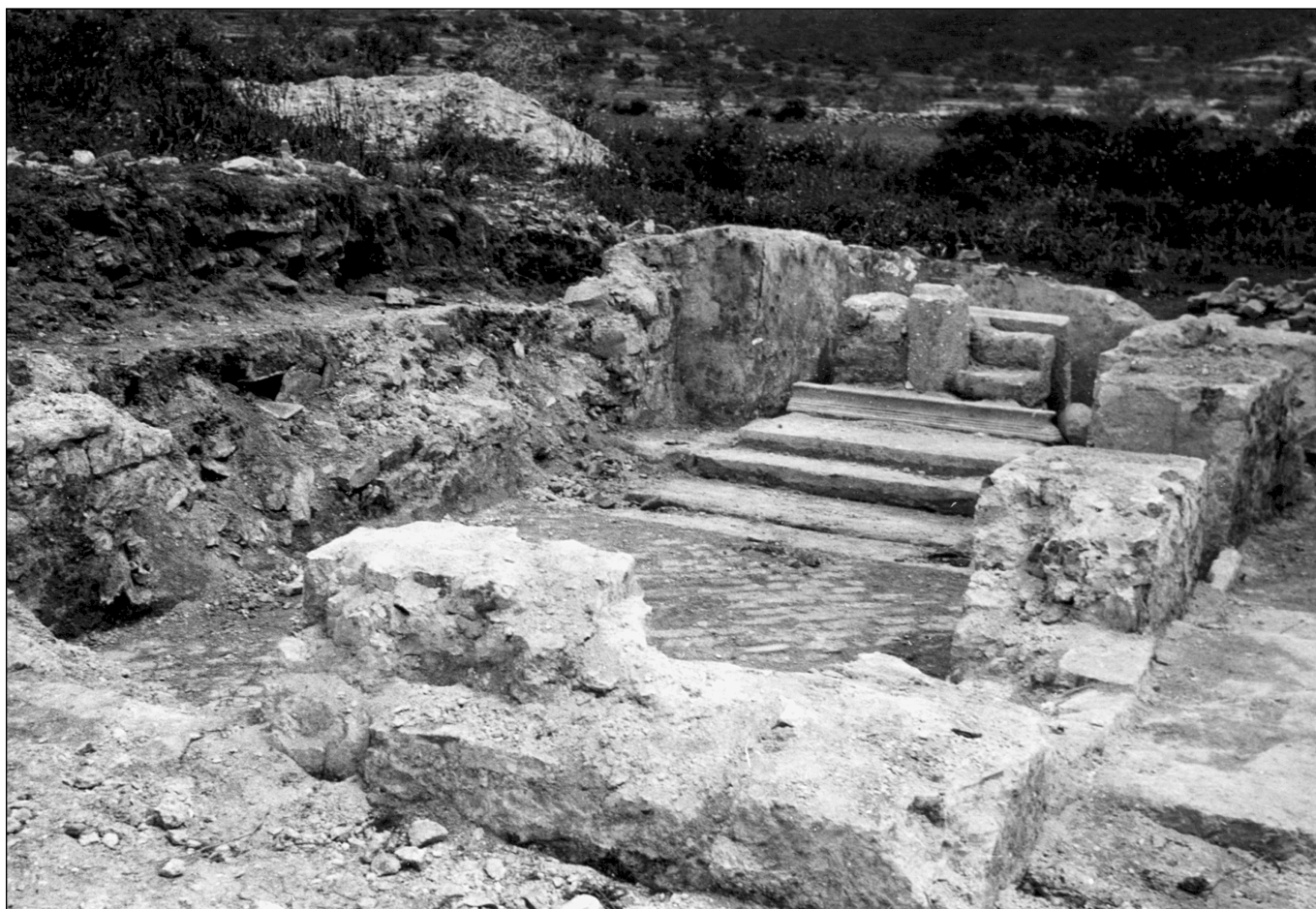
sl. 7 Ostaci porušene crkve sv. Marije (Gospa od Site)

crkava iste nadbiskupije navodi se i u vizitacijama XVIII. st. (pri vizitaciji nadbiskupa Antuna Kačića iz 1745. i onoj iz 1762. god.).