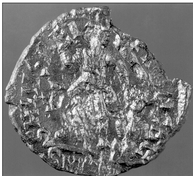
sl. 6 Viktorija s trofejem - RV.