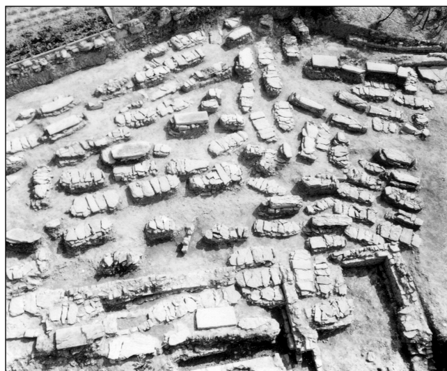
sl. 9 Strožanac gospe od Site. Zračni snimci pogled na lokalitet

daljnje praćenje slijeda pružanja toga trakta zida prema istoku nije bilo moguće zbog privatnog posjeda (vinograd), kao ni na sjeveru (vrtovi), dok je prema zapadu taj trakt uništavan višestoljetnim ukapanjem. Kao što već spomenusmo, na položaju parcele sjeverno od postojeće crkve, nalazi se glavnina srednjovjekovne nekropole. Prema izjavama mještana (starosjedilaca), sjeveroistočno i zapadno od areala crkvenog kompleksa, gdje su danas privatne kuće, vinogradi i vrtovi, mještani su prilikom izgradnje kuća ili obrade zemljišta, nailazili na ostatke zidova i mozaika.