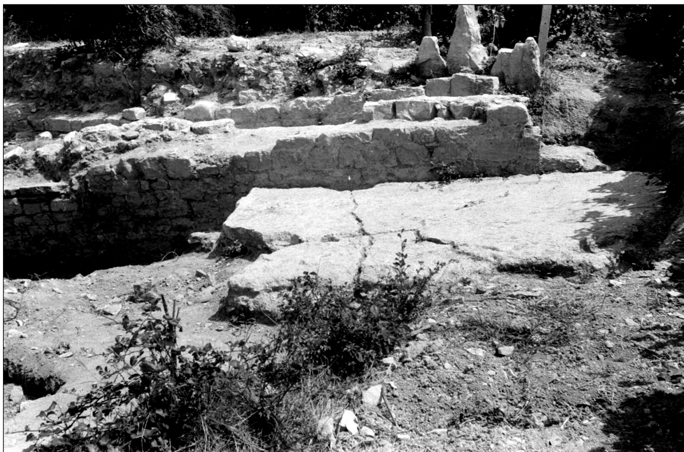
sl. 4 Pogled na termalni trakt kompleksa s očuvanim podnim malterom

obrađivali okolne zemlje, dajući dio prihoda samostanu. Selom i samostanskim posjedom u ime samostana i opata upravljao je poseban upravitelj - gaštald.