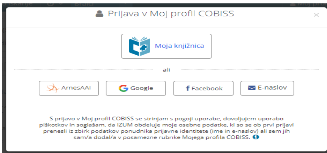
Slika 3: Ulaz u Moju knjižnicu i posudba gradiva