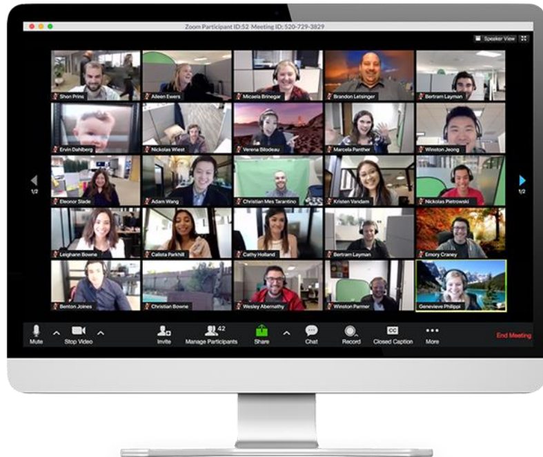
Slika 2: Poučavanje putem Zooma