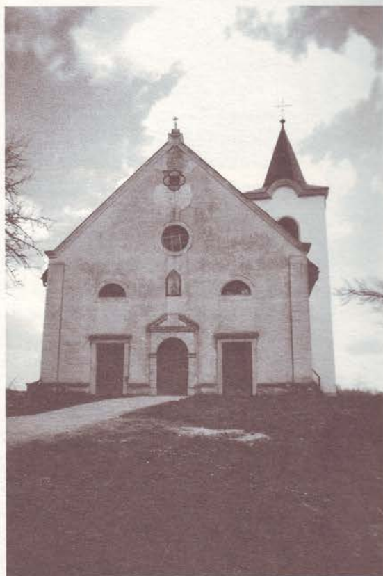
Župna crkva sv. Nikole, Brod Moravice