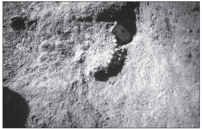
Sl. 2 Pojasna pločica ukrašena rebrastim ornamentom

Pouzdanje i sasvim izravne analogije takvom tipu pojasne garniture ne postoje. Međutim, prema načinu, modelu i tipu izrade lijevanja u kalupu četvrtastog oblika, može se povezati s kolapijanskim i japodskim prostorom latenskog ili mlađeg željeznog doba (K. 1). Stilski i sadržajno najbližnja varijanta pojasne pločice, ukrašena rebrastim ornamentom, nalazi se u grobu 79 Goleka pri Vinici (Božić 1999: 175). No, srodni primjerci poznati su iz nalazišta Vinica, Zidani gaber nad Mihovim, Vinji vrh ili Črnomelj (Križ 1993: 169; Mason 1999: Fig. 2; Božić 2001: Sl. 29), te iz više puta objavljivane Trošmarije kraj Ogulina (Drechsler-Bižić 1970: Sl. 247, T. 1. 3-4; Bakarić 1993: 113; Majnarić-Pandžić 1998: Sl. 168; Balen-Letunić 2000: 29). Primjerke iz citiranih nalazišta Dragan Božić smatra viničkom varijantom pojasnih trapezoidnih kopči koje se ističu ornamentikom najčešće s rebrima, zmijama ili izrazito stiliziranim konjskim glavama (Božić 1999: 212). No, isto tako ih smatra posljedicom utjecaja iz japodske kulture, gdje su poznati ukrasi konja, jelena ili divljih svinja (Brunšmid 1897; Marić 1968; Drechsler-Bižić 1986; 1987), a koji sjevernije od Vinice nisu nikad prodrli. Upravo taj dio nošnje, pored fibula s