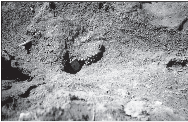
Sl. 1 Pojasna garnitura iz groba 2, sonde 3, nekropole Grobišće na Grobniku dokumentirana prilikom istraživanja 1987. godine

trake (Sl. 1). Prilikom istraživanja zabilježeni su i tragovi podloge od kože, na kojoj je dugmad bila pričvršćena, u intaktnoj širini od 4 cm (Cetinić 1996: 195-196). Pločica je pravokutnog nepravilnog oblika, s unutarnjih strana glatka, a s vanjskih strana ukrašena jednim rubnim i s dva unutrašnja rebra koja prate osnovnu liniju pločice, izrađena tehnikom lijevanja. Na vanjskoj pločici nalazi se rupica za zakovicu u središnjem dijelu, a na rubovima su po dvije rupice i dvije zakovice za spajanje s pločicom u podlozi. Dužina pločice iznosi 6,48 cm, širina 4,17 cm, debljina 0,41 cm, a težina 40,23 g. (Sl. 2). Pojasna traka sastojala se od tri reda spojenih kalotastih i polukalotastih dugmadi i to: većih na rubnim redovima i manjih u središnjem redu gdje su bili postavljeni, tj. prišiveni u obliku cvjetića (Sl. 1) (Blečić 2003: 165, 229-230, 276).