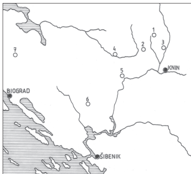
sl. 1 1-Plavno, 2-Oton, 3-Golubić, 4-Ervenik, 5-Ivoševci, 6-Bribir, 7-Nadin