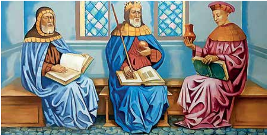
Slika 1. Avicena između Hipokrata i Galena

Ibn Sina (oko 980. – 1037.), odnosno punim imenom Abu Ali al-Husayn Bin Abd-Allah Bin al-Hasan Bin Ali Bin Sina , a poznatiji pod svojim latinskim nadimkom Avicena , smatra se jednim od najvećih liječnika u povijesti (slika 1.) 1 . Uz medicinu, bavio se i proučavanjem filozofije, teologije, geologije, fizike, kemije, astronomije, astrologije i psihologije, a pisao je čak i pjesme 2 . Svi ti njegovi brojni interesi zorno su prikazani u muzeju otvorenom 1980. godine u njegovoj rodnoj Afshoni (slika 2.) 3 . Muzej je dio reprezentativnog kompleksa koji još tvore Medicinski fakultet, Studentski dom, Poliklinika, Knjižnica i park u središtu kojega je postavljen liječnikov spomenik. Cijeli kompleks pažljivo je obnovljen 2006. godine u sklopu nastojanja tadašnjega uzbekistanskoga predsjednika Islama Karimova (1938. – 2016.) da se obilježe mjesta i datumi vezani za značajne osobe iz povijesti Središnje Azije, a s ciljem njihove inkulturacije u uzbekistansku naciju (slika 3.).