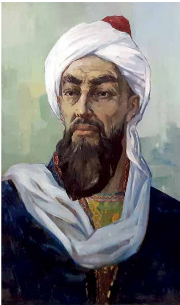
Slika 3. Avicenin imaginarni portret