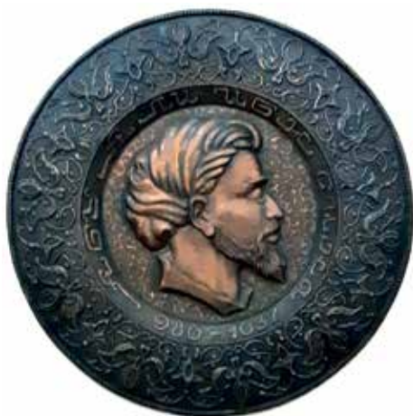
Slika 5. Avicenin lik u medaljonu