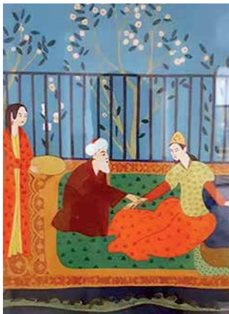
Slika 6. Avicena provjerava puls