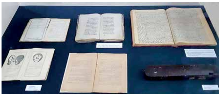
Slika 4. Razna Avicenina djela

knjižnicu, što mu omogućuje proširenje vidika 5 . U dvadeset i prvoj godini objavljuje svoju prvu knjigu, ukupno ih je do kraja života napisao više od 240, a najpoznatije su filozofsko-teološka Danish nama-i alai (Knjiga znanja) i Kitab al-najat (Knjiga spasenja) te znanstveno-medicinska djela Kitab al-shifa (Knjiga liječenja) i Al-Qanun fi al-ṭibb (Kanon medicine), pri čemu posljednje od navedenih djela kanadski internist i povjesničar medicine Sir William Osler (1849. – 1919.), inače jedan od osnivača John Hopkins Hospitala u Baltimoreu, naziva najznačajnijim medicinskim djelom u povijesti (slika 4.) 6 .