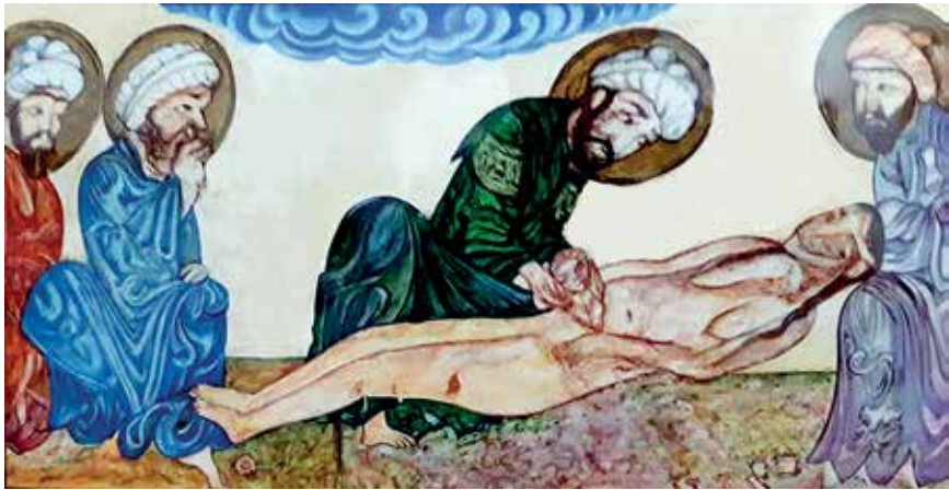
Slika 7. Avicena izvodi porođaj carskim rezom