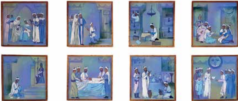
Slika 8. Ilustracije Avicenina života