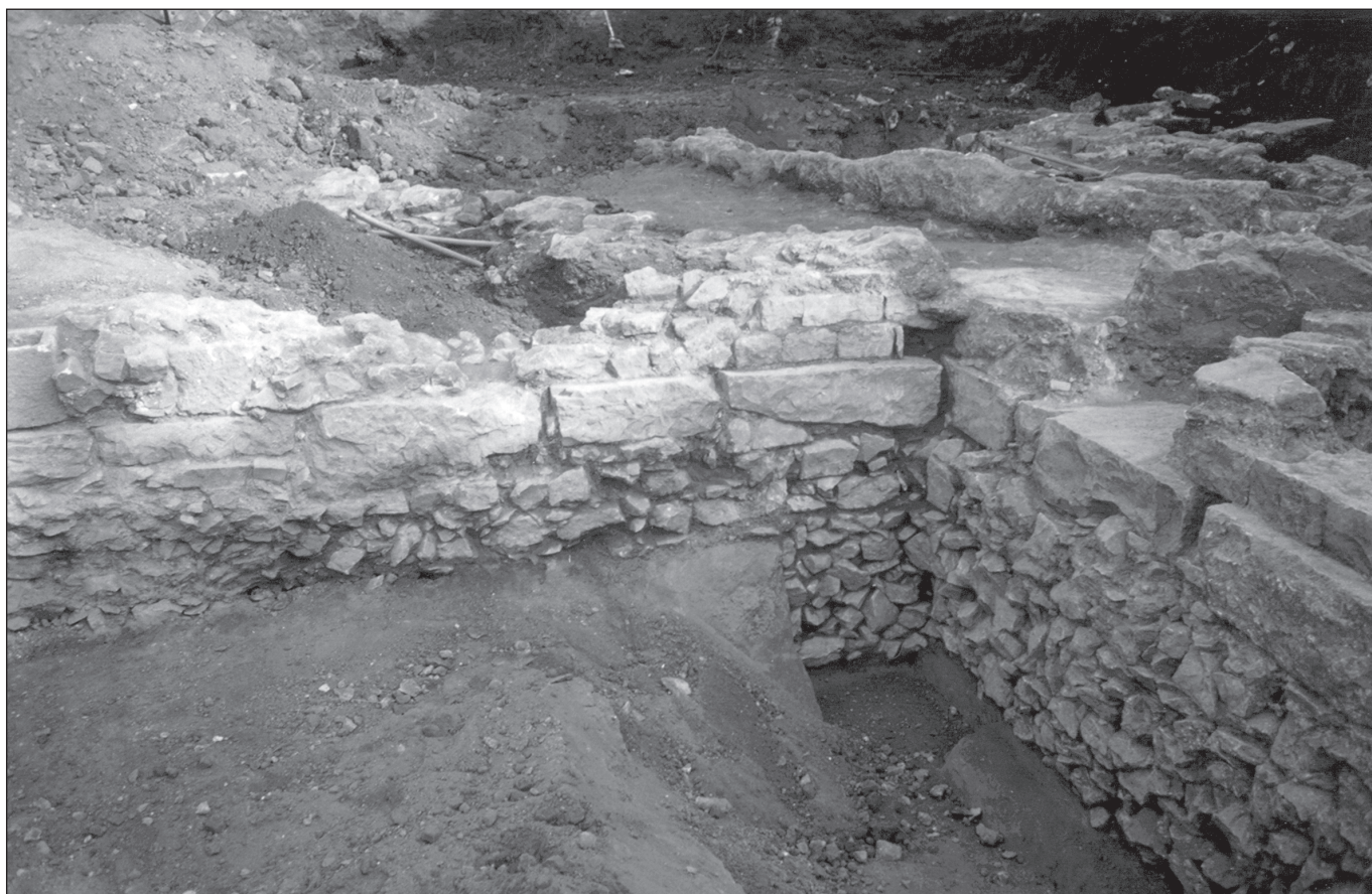
Sl. 3 Ugao južne grobne parcele u vrtu Doma časnih sestara

Sjevernu nekropolu naprotiv, karakterizira koncentracija starokršćanskih cemeterijalnih bazilika i ukopa. Ž. Miletić se bavio pitanjem prostiranja ove nekropole te je na temelju analize položaja nadgrobnih natpisa utvrdio izrazitu koncentraciju ukopa od 1. do 3. st. (kao i na ostalim nekropolama) uz cestu koja je išla uz sjeverne zidine (Miletić 1990: 163-194). Ovoj nekropoli možda pripadaju i gladijatorski ukopi pronađeni u blizini amfiteatra, premda je nemoguće razlučiti ove dvije nekropole (zapadnu i sjevernu) na području zapadno od amfiteatra jer se cesta koja je zaobilazila Salonu sa sjevera, spajala sa cestom za Trogir. Sam izgled i organizacija ranijeg sloja ove nekropole poznati su nam samo preko natpisa jer je na ovom području istraživan samo starokršćanski sloj, a nalazi iz ranijih perioda pripadaju uglavnom slučajnim nalazima ili manjim zaštitnim radovima. Premda su na Manastirinama identificirani ostaci jednog hortusa ipak nije sigurno jesu li na ovoj nekropoli izgled i organizacija grobnih parcela slični situaciji na zapadnoj nekropoli.