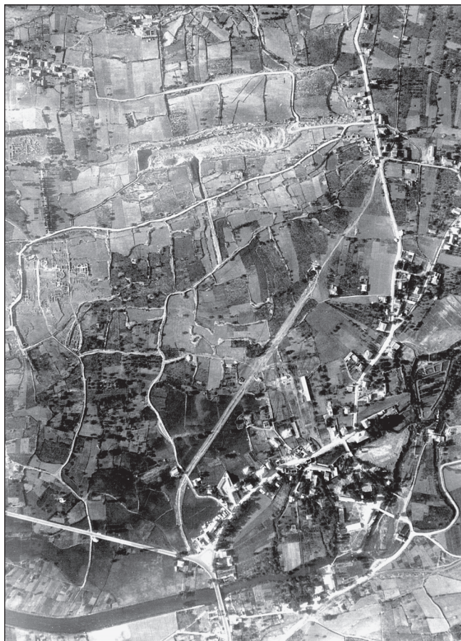
Sl. 2 Zračni snimak istočnog dijela Salone

starokršćanska bazilika. E. Marin smatra da na ovoj nekropoli nije bilo kulta martira pa tako ni razloga za podizanje cemeterijalne bazilike (Marin 1988: 7, 41). Posljednja istraživanja su pokazala da je kršćanskih ukopa ovdje bilo iako je bilo moguće sa sigurnošću identificirati mali broj starokršćanskih grobova, a na istraženom području nije pronađena bazilika (Kirigin et alii 1987: 51).