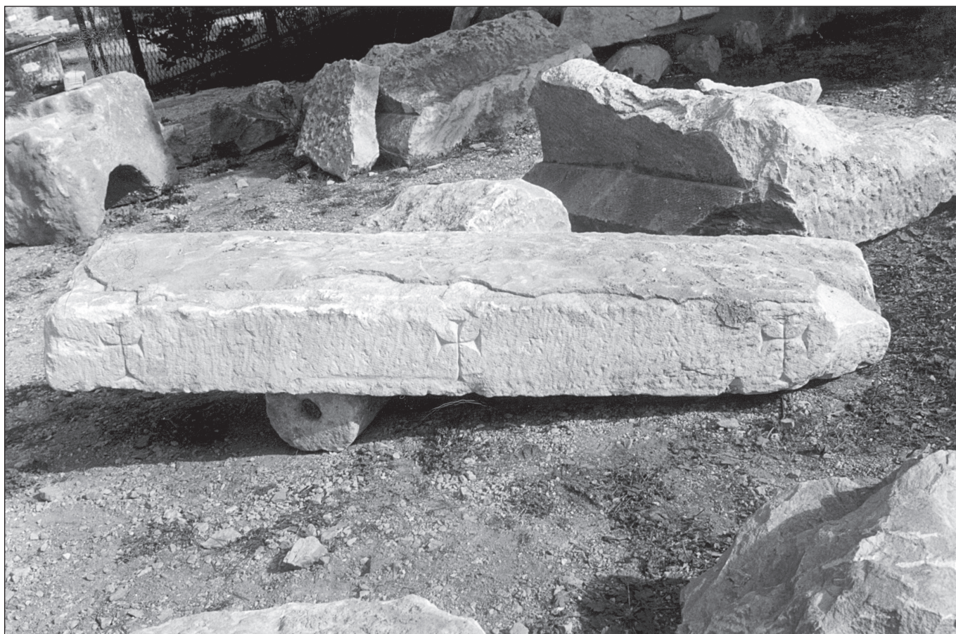
Sl. 7 Nadvratnik s križevima

Na istočnoj i sjevernoj nekropoli bile su podignute cemeterijalne bazilike (starokršćanska bazilika ispod Zvonimirove krunidbene bazilike, bazilike na Kapljuču i Manastirinama), na zapadnoj nekropoli nije pronađena bazilika, dok se na jugoistočnoj, odnosno u blizini antičke ceste nalazi starohrvatska bazilika u kojoj je bila pokopana kraljica Jelena. Prilikom objave revizijskih istraživanja crkve na Otoku 1972. godine, voditelji radova nisu isključili mogućnost postojanja starokršćanske crkve na Gospinu otoku (Rapanić&Jelovina 1977: 130).