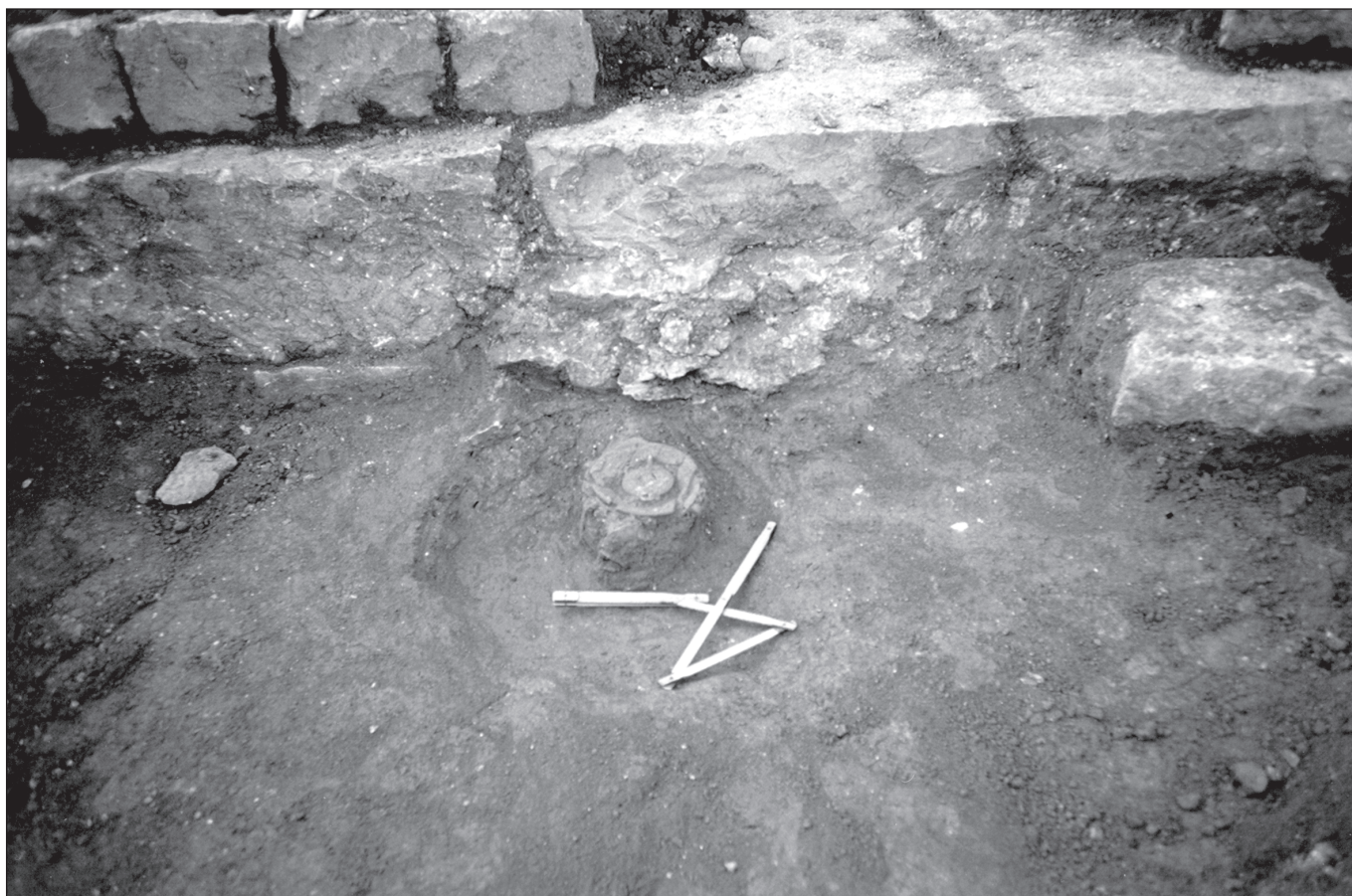
Sl. 6 Keramička uma

analize nalaza čini mi se da su ove dvije parcele nastale oko sredine 1. st. Nad dijelom hortusa je u kasnoj antici bila podignuta, najvjerojatnije stambena zgrada. Periodu kasne antike pripada i ulica koja je preslojila ugao južne parcele. Velika zaštitna istraživanja koja su 1979. godine bila provedena u istočnom dijelu Salone pokazala su da su na prostoru sjeverno od vrta samostana bila podignuta dva kompleksa. Prema mišljenju istraživača južni je termalni sklop, a sjeverni privatni kompleks. Istraživanja su bila sondažna, a u zapadnom profilu južnog kompleksa bila su vidljiva dva groba pod tegulama (Oreb 1984: 28-29). Ovdje je u jednom kanalu bila pronađena ostava bizantskog novca (Marović 1984: 293). Iz izvještaja je jasno da osim dva spomenuta groba pod tegulama nisu otkriveni ostaci nekropole ili ogradnih zidova, ali na mjestima gdje je otkrivena arhitektura, istraživanja nisu zahvatila dublje slojeve. Stoga i dalje ostaje nejasno jesu li ostaci nekropole na ovom mjestu potpuno uništeni ili su kao što je to slučaj u vrtu samostana, preslojeni kasnijom arhitekturom na način da su samo nadgrobni spomenici uklonjeni dok su grobovi ostali u zemlji.