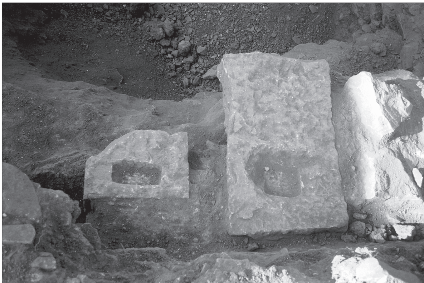
Sl. 4 Baze za stele

Od starokršćanskih nalaza tu su gledano od zapada, bazilika na Kapljuču, nekropola 16 sarkofaga i naravno veliki cemeterijalni sklop na Manastirinama nešto dalje od grada, koji nastaje uz cestu što od Salone vodi ka Klisu - točnije od Porta Suburbia III vodi ravno prema sjeveru da bi nešto sjevernije od Manastirina skrenula ka sjeveroistoku (Miletić 1990: 182-185; Mardešić 2000: 205-206). Takozvana nekropola 16 sarkofaga je mali dio sjeverne nekropole u kojemu su pronađeni sarkofazi od kojih su neki u starokršćansko vrijeme ponovno upotrebljeni za ukop (Marin 1994: 48). Na Manastirinama su završena revizijska istraživanja i rezultati su publicirani. Ukratko, cemeterijalni sklop je nastao na sjevernoj nekropoli, dakle na mjestu gdje je bilo uobičajeno ukapanje i u ranijim vremenima i to izgleda u blizini mjesta gdje se spomenuta cesta u pravcu Klisa križala s još jednom cestom u pravcu zapada (Miletić 1990: 185, sl. 5; Mardešić 2000: 206, sl. 87). Ostaci zidova ranijih od kapela i bazilike u tolikoj su mjeri skromni, a teren je oko njih uglavnom bio istraživan i razina zemlje spuštena, da ih nije bilo moguće sa sigurnošću pripisati nekropoli osim u slučaju ranije spomenutog hortusa iza apside bazilike (Marin 1989: 143).