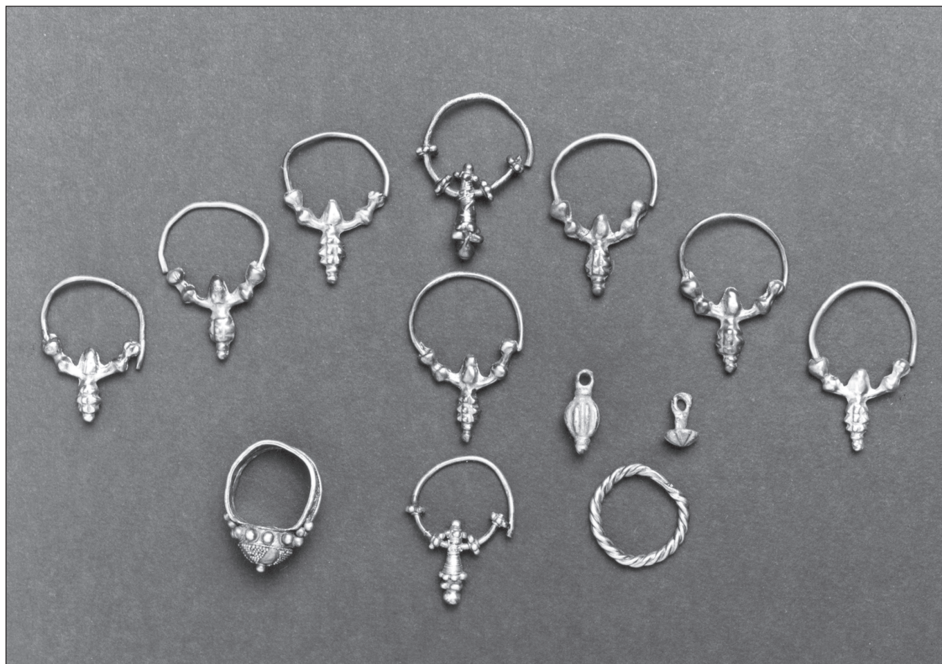
Sl. 2 Zvonimirovo-Veliko polje. Inventar grobne cjeline 17. Fig. 2 Zvonimirovo-Veliko Polje. Inventory of the grave 17.

tehničii pseudogranulacije i pseudofiligrana (tip 17a), (Sl. 2, 4). Pored lijevog obraza pokojnice nalazile su se četiri srebrne rustikalne lijevane volinjske naušnice (tip 17b), (Sl. 2, 5-8), odnosno jedna luksuzna srebrna volinjska naušnica rađena u tehničii pseudogranulacije i pseudofiligrana (tip 17a), (Sl. 2, 9).