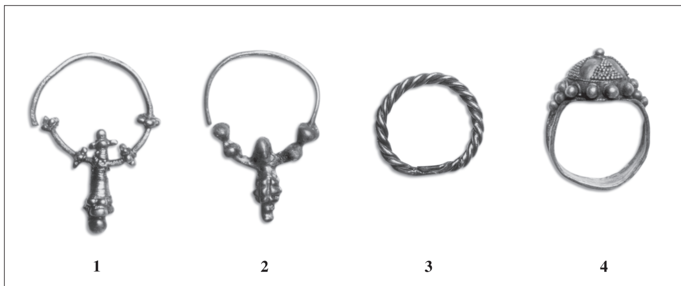
Sl. 4, 1 Zvonimirovo-Veliko polje. Grobna cjelina 17. Luksuzna grozdolika naušnica (tip 17a). Fig. 4, 1 Zvonimirovo-Veliko Polje. The luxurious raceme earring from the grave 17 (type 17a).