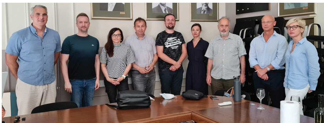
Dio Uredničkog odbora i urednika rubrika časopisa "Kemija u industriji" u razdoblju 2014. – 2021. na sastanku održanom 2. srpnja 2021.