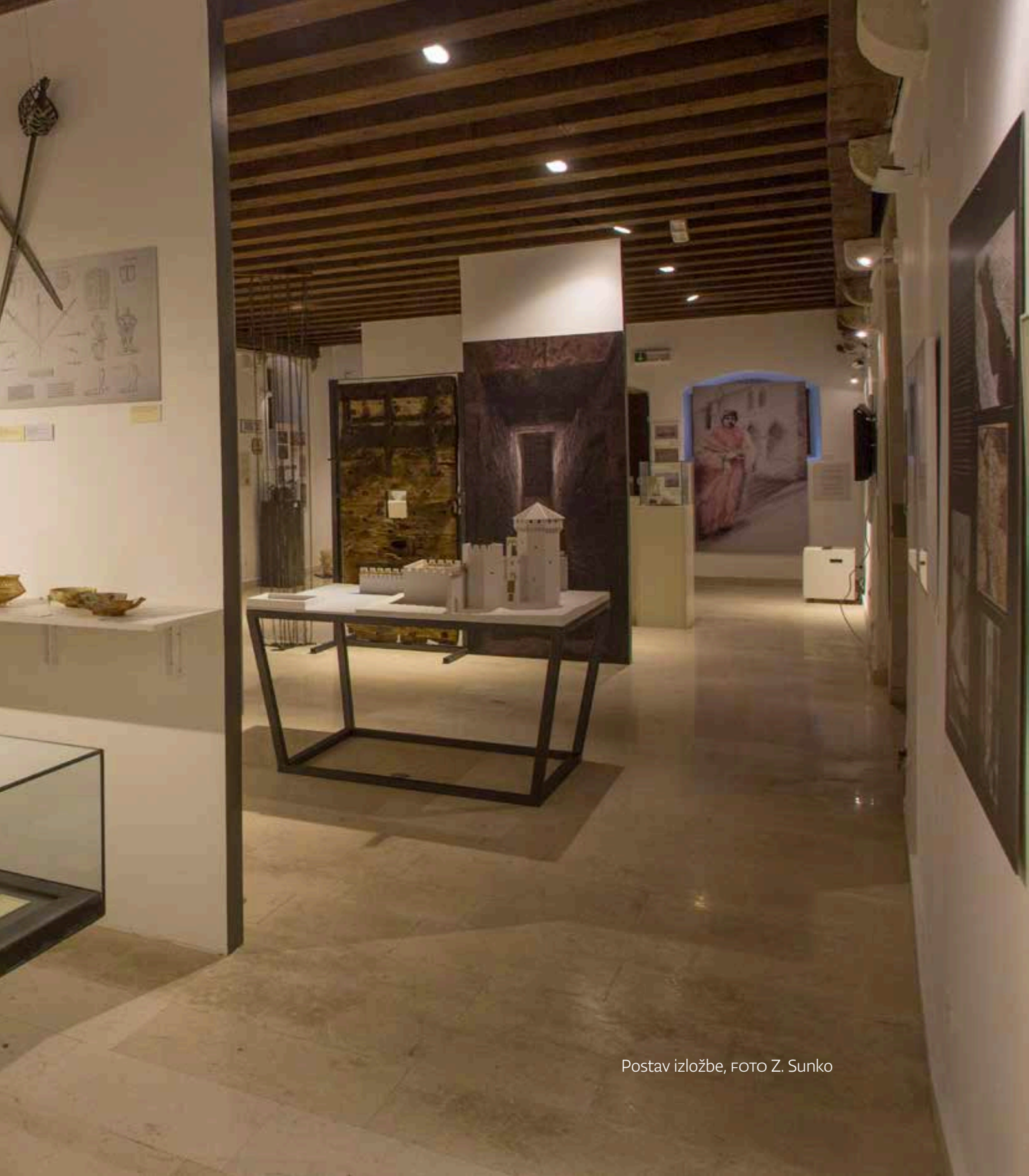
Postav izložbe