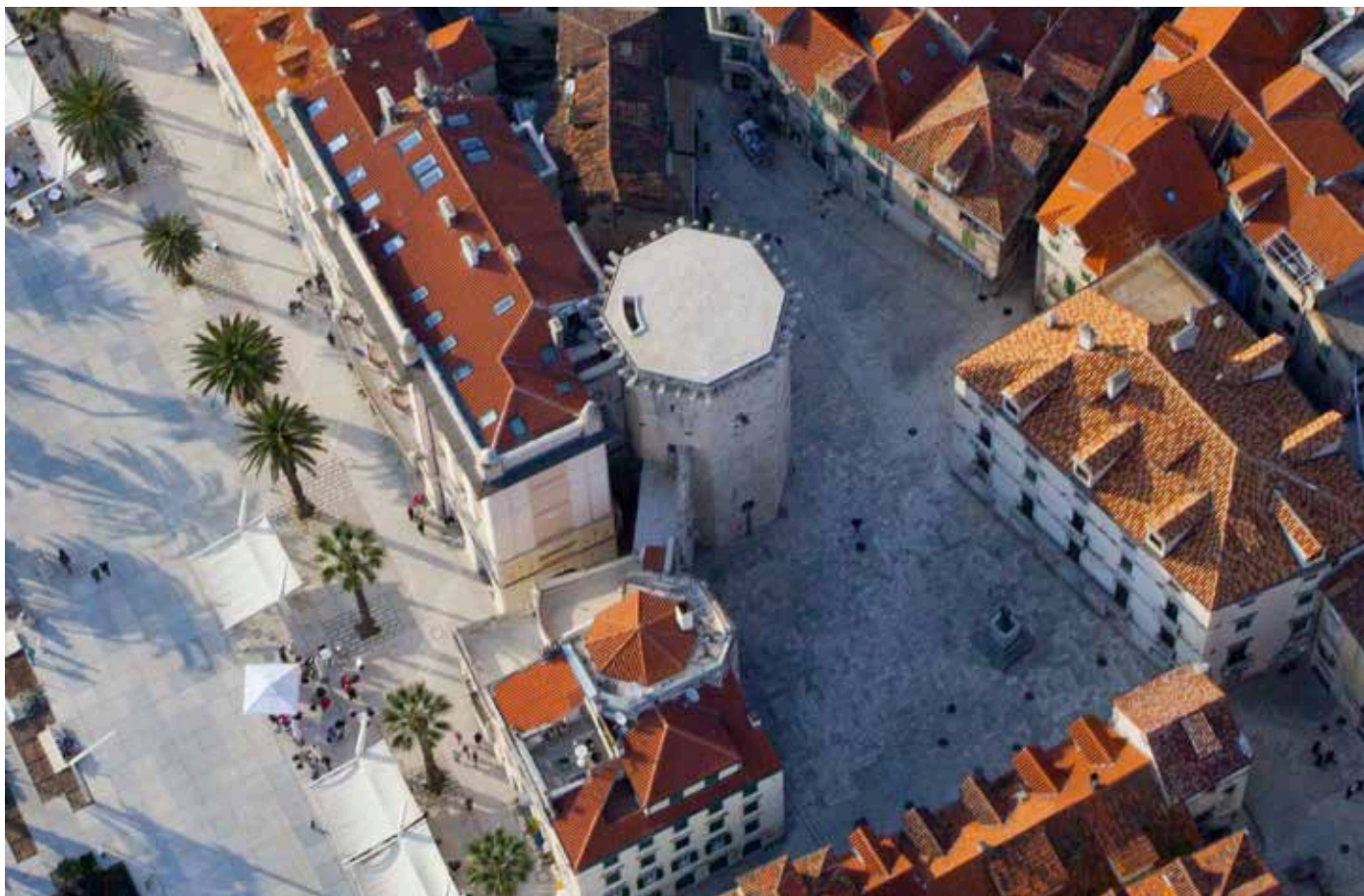
Ostatak mletačkoga kaštela u Splitu