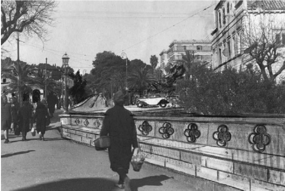
MOST NA PILAMA, 1949.