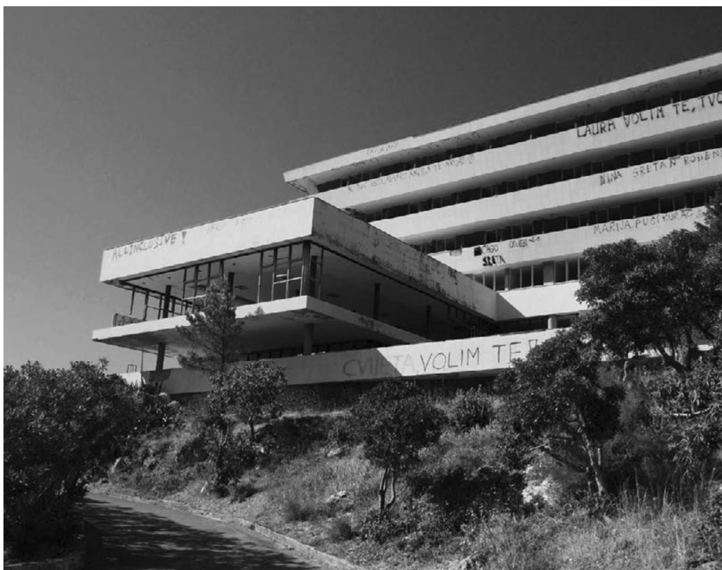
DAVID FINCI: HOTEL PELEGRIN, KUPARI; FOTO: AUTOR TEKSTA, 2017.

hitektonske scene. Osim toga, s ciljem njihova očuvanja proveden je i arhitektonski natječaj na temu rekonstrukcije čiji su rezultati potvrdili mogućnost postizanja tražene gustoće i kvalitete stanovanja bez da se zgrade sruše. Drugi pak vrijedan doprinos natječajnog postupka bio je dokaz bitno veće podložnosti modernističkih građevina radikalnijim zahvatima pri rekonstrukciji, nego što je to slučaj s građevinama s kraja 19. i početka 20. stoljeća, a posebice onim starijim. Adaptabilnost i fleksibilnost tako su iznova potvrđene kao neke od najvećih kvaliteta i vrijednosti modernističke arhitekture. No unatoč svim tim naporima i struke i javnosti, prijedlozi za zaštitu, očuvanje i rekon-