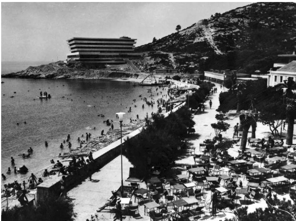
DAVID FINZI: HOTEL PELEGRIN, KUPARI 1964.; IZVOR: MUZEJ CRVENE POVIJESTI, DUBROVNIK

national asocijacije. 5 Tek je krajem 20. stoljeća moderna arhitektura kao kulturna baština postala bitna tema u konzervatorskim krugovima, pa je i na UNESCO-vu listu tada uvršten veći broj modernističkih građevina. No stvari sporo napreduju. Društveno neodgovorno upravljanje ili, preciznije, neznanje i nerazumijevanje spregnuti s političkim i privatnim interesima i potpomognuti nebrigom i snažnim pritiskom kapitala, modernističku arhitekturu redovito izlažu nesavjesnim i grubim postupanjima, neprikladnim zahvatima i rušenjima, kao i neprimjerenim intervencijama u njen sadržaj, što joj u većoj