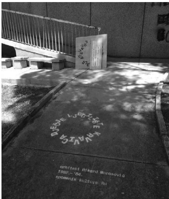
MOTEL TROGIR: PRIVREMENA SIGNALIZACIJA SPOMENIKA KULTURE, 2018.

pokretne baštine, u današnje je vrijeme prijeko potrebno, rekla bih da se radi o građanskoj dužnosti. Konzervatorskim