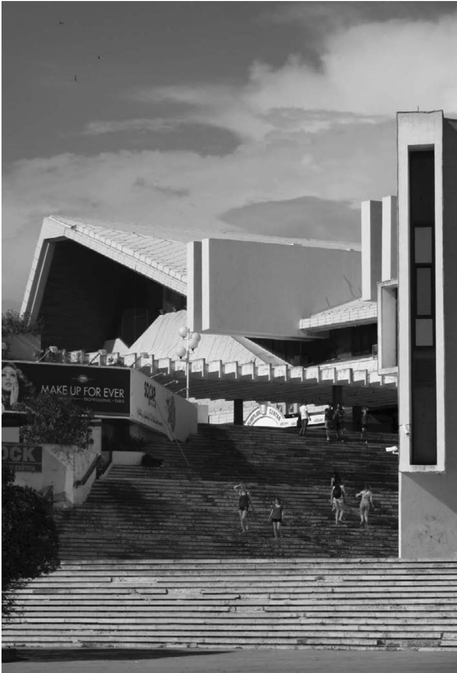
KOMPLEKS KOTEKS GRIPE, 1979. – 1981., SPLIT; FOTO: SAŠA ŠIMPRAGA