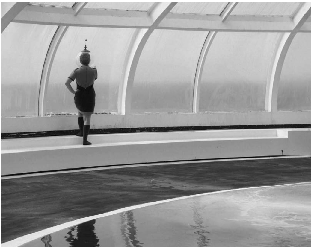
SUNNY SIDE, 2018.

LS Tema arhitektonskog nasljeđa u mom radu odnosi se na modernističku arhitekturu koja nije baš neuobičajena tema suvremene umjetnosti. Moram priznati da mi bavljenje tom temom nije bilo u planu; željela sam izbjeći nekritički ruin porn i slične pristupe, a ni dokumentarizam me u tom smislu ne privlači. Kako se ponekad radi o zaista svjetski relevantnim primjercima arhitekture, interes mlađih generacija je razumljiv. Iako joj je vrijednost na neki način već dokazana, još se nije izborila za mjesto i zaštitu koju zaslužuje. Arhitekturom modernizma počela sam se baviti preko spomenutog Vitićeva Motela Sljeme . Taj rad pobudio je moj interes za često problematično priva-