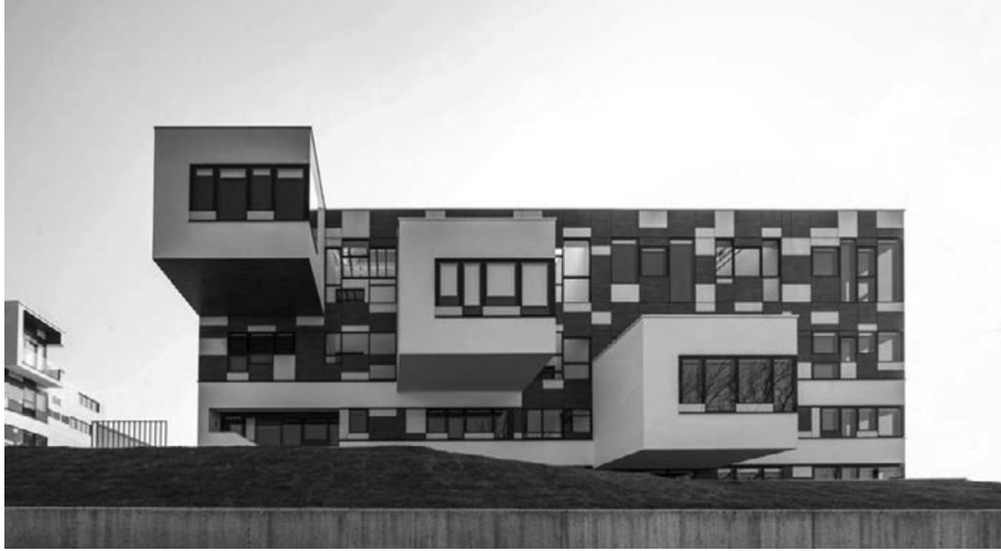
PROJEKT TRSAT, RIJEKA, MR 2, WWW.MR2.HR