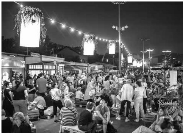
PLAC MLJAC, ZAGREB

je shvaćanje privremenih sadržaja kao metode istraživanja javnih prostora primjenjivo u svim fazama, od detektiranja postojećih problema i potreba lokalnog stanovništva, ispitivanja mogućih načina korištenja prostora do zaštite postojećih i stvaranja novih javnih prostora. Stoga je korisno i inspirativno, osim njihove osnovne uloge društvenog događaja, intenzivnije koristiti i drugu ulogu privremenih sadržaja, a to je uloga istraživača javnih prostora. ■