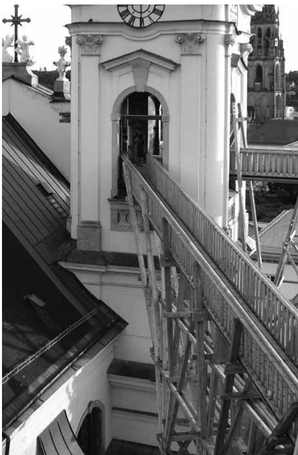
ATELIER BOW-WOW: PROJEKT HÖHENRAUSCH, LINZ, 2011.

Danas svjedočimo pojavi sve većeg broja privremenih sadržaja koji se natječu u privlačenju naše pažnje: adventi, festivali hrane i pića, glazbeni koncerti, festivali ulične umjetnosti, smotre folklor, svetkovine, sportske manifestacije. Upravo u toj hipertrofiji privremenih sadržaja više nego inače dolaze do izražaja problemi današnjih javnih prostora: prevelika gužva tijekom privremenih događaja ili tijekom turističke sezone i pustoš tijekom svakodnevnog korištenja ili izvan sezone; prezasićenost sadržajima privremenih događaja i nepostojanje sadržaja