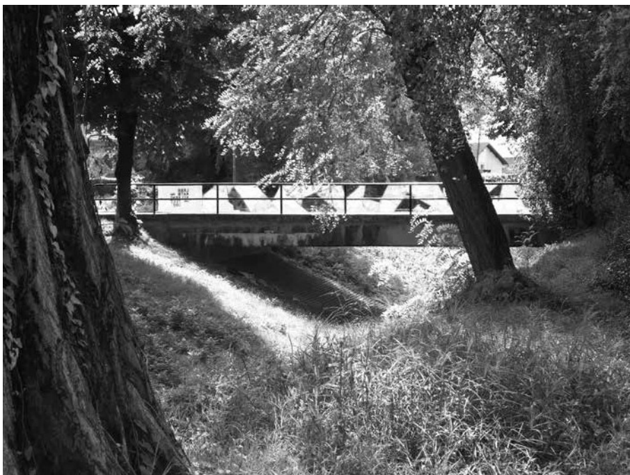
LABORATORIJ ARHITEKTURE: MOSTOVI NA TRNAVI, ČAKOVEC

ja kakav je primjerice festival Zlatne žice Slavonije : parkiralište se transformira u trg na kojem se odvija festival, a zatvaranjem prometa trg se povezuje s pješničkom zonom. Dok Trg Svetog Trojstva čeka svoje prometno i arhitektonsko-urbanističko rješenje, koje bi navedene a svima vidljive probleme uspjelo savladati i pomiriti, upravo bi se privremenim sadržajima moglo intenzivnije istražiti prostor.