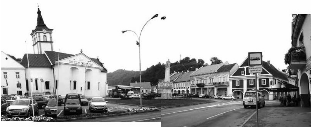
TRG SVETOG TROJSTVA, POŽEGA; FOTO: SILVIJA PRANJIĆ; PROBLEMATIKA PARKIRALIŠTA NA GLAVNOM POŽEŠKOM TRGU NAKRATKO NESTAJE PRILIKOM PRIVREMENIH MANIFESTACIJA

korištenjem mogu biti itekako koristan alat u prostornom planiranju, formiranju javnog mišljenja te stvaranju i očuvanju javnog prostora.