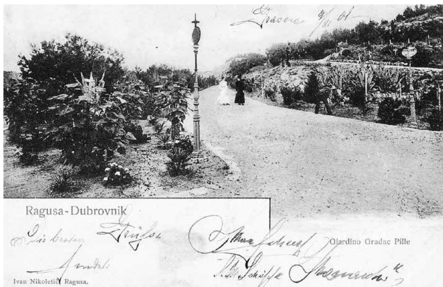
PRVA FAZA UREĐENJA PARKA – GLAVNA PRILAZNA ALEJA PARKA, KRAJ 19. ST