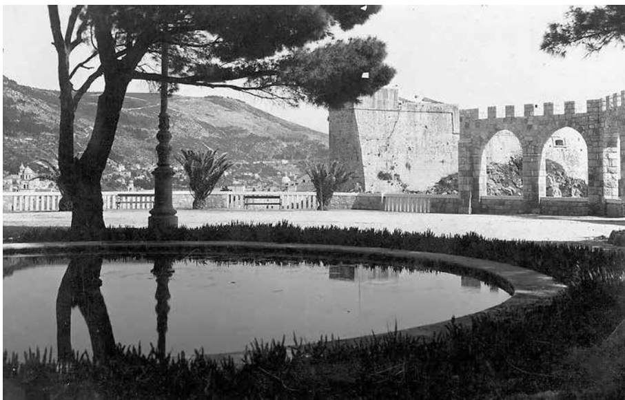
DRUGA FAZA UREĐENJA PARKA – NADOGRAĐNJA NEOGOTIČKOG ZIDA, NAKON 1929.