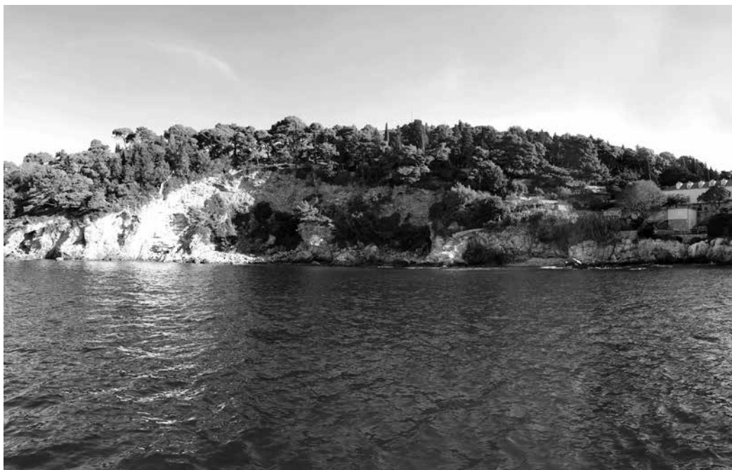
POGLED S MORA NA A ZONU NATJEČAJA, 2018.

Jedno od najosveštenijih društava po pitanju tradicije oblikovanja i održavanja visoke razine javnih parkova je Velika Britanija. Impresivnih 27.000 javnih parkova u Britaniji i 2,6 milijardi posjeta tim parkovima svake godine 15 predstavljaju veliki izazov za upravljanje, odnosno održavanje prilično visokoga standarda uređenja. Mnogi od tih parkova imaju povijesni i kulturni značaj, a oko 300 njih registrirano je nacionalno važnima. Već više od jednog stoljeća velika većina javnih parkova pod ingerencijom je lokalnih vlasti, ali istovremeno te vlasti nemaju zakonsku obvezu financiranja ili održavanja javnih parkova. U Velikoj Britaniji je u odnosu na Hrvatsku vrlo čest model upravljanja javnim parkom preko neprofitnih organizacija, ra-