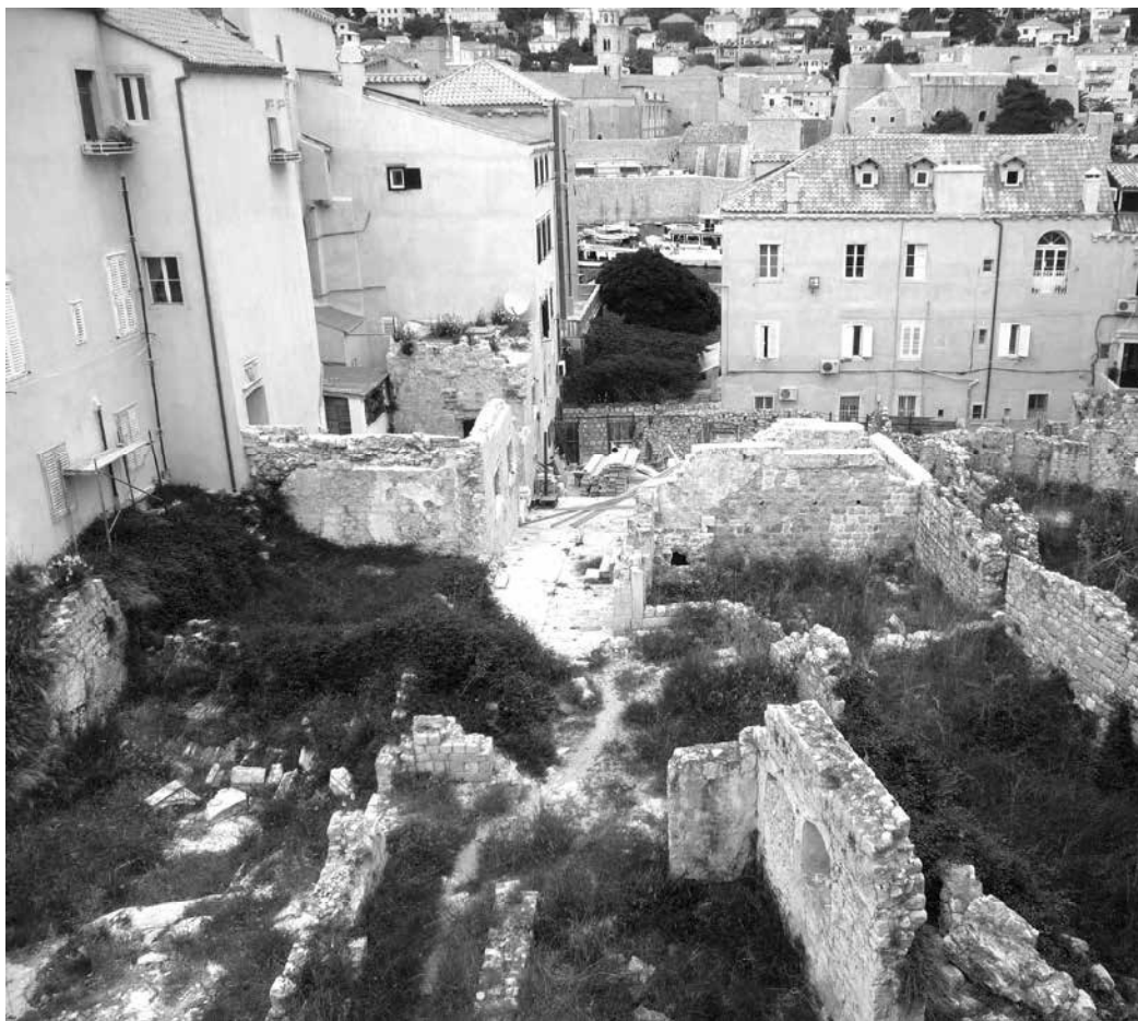
ARHEOLOŠKO NALAZIŠTE NA PUSTIJERNI

vala obnova i dogradnja školske zgrade, a u drugoj fazi obnoviteljski je zahvat proširen na prostor nekadašnjeg baroknog vrta s provedbom arheološkog istraživanja na površini od 950 m 2 . Rezultati istraživanja pokazali su ostatke stambene četvrti srednjovjekovnog Dubrovnika. 10 Za razliku od nalazišta na Pustijerni u arheološki istraženom vrtu podignuta je školska dvorana na prepoznatljivoj matrici izgradnje grada, pronađenoj u temeljima arheoloških nalaza , 11 dok se u njegovu južnom kraju plani-