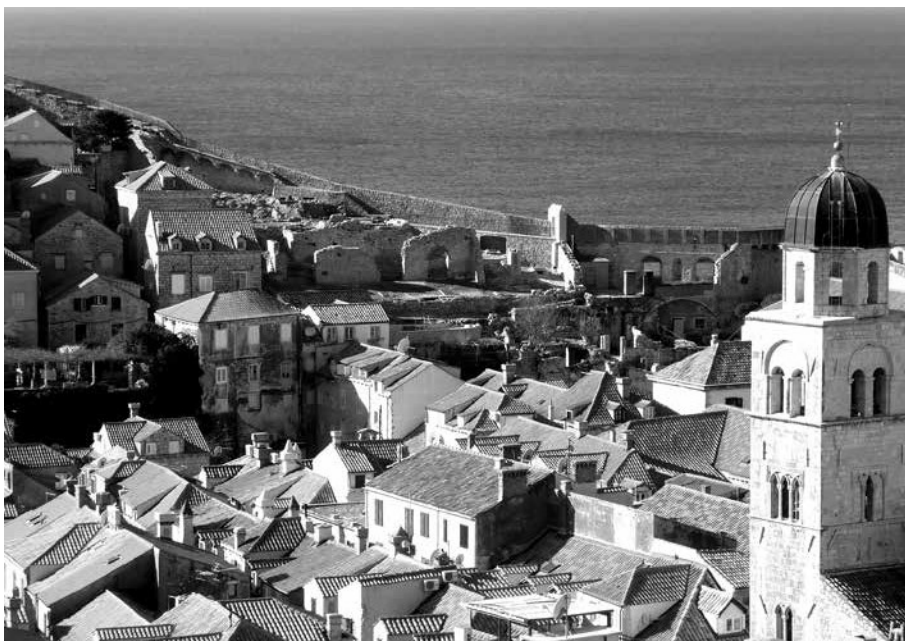
GRADSKI PREDIO NA ANDRIJI

strukture te razumijevanju njezina povijesnog i prostornog konteksta. Težište je da se urbanističkom planiranju i projektiranju pridruže različite istraživačke metode morfološke analize kako bi se spoznajem karaktera šireg gradskog područja te urbane uloge samog arheološkog predjela sagledali prostorni, društveni, ekonomski i svi drugi mogući aspekti za integraciju nepokretnog arheološkog nasljeđa. ■