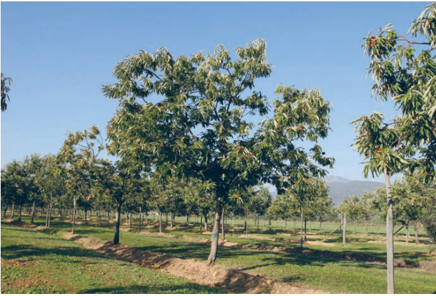
Slika 1. Plantaža euro-japanskih hibrida pitomog kestena. Figure 1 Chestnut plantation with Euro-Japanese hybrids.

cijepljenja su prema Keysu (1978), Pereira-Lorenzo i Fernandez-Lopez (1997), Serdar i Soyly (2005) i Mayfieldu (2009):