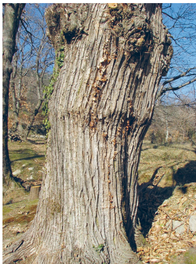
Slika 3. Lovranski marun: (A) plodovi; (B) spoj između podloge i plemke. Figure 3 Lovran marron: (A) fruits; (B) graft union between rootstock and scion.

stavlja komplementaran kvadrat kore s kambijem plemke, koji na sebi ima pup. Ova je metoda primjerena u slučaju već odebljale kore starijih izbojaka, kada su pločasto okuliranje i T-okuliranje neizvedivi (Carroll 2017).