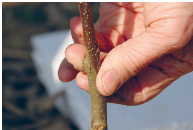
Slika 5. Cijepljenje na engleski spoj. Figure 5 Whip graft.

Polijeganje kao metodu razmnožavanja pitomog kestena često primjenjuju francuski uzgajivači. Međutim, rezultati istraživanja na povaljenicama značajno se razlikuju. U istraživanju Landaluca (1952) nije postignut dobar uspjeh u zakorjenjivanju povaljenica na mladim biljkama, dok su izbojci starijih panjeva imali uspješnost zakorjenjivanja od samo 20 %. Pri tomu se primjena auksina nije pokazala uspješnom, dok je prstenovanje kore vremenski i tehnički vrlo zahtjevno. U kasnijem istraživanju iz 1953. godine (Vietetz 1953), zabilježen je uspjeh u razmnožavanju povaljenicama. U 15 različitih tretiranja, uspješnost zakorjenjivanja bila je različita, a najuspješnijim su se pokazala tri tretmana: 5 mg/g indol-3-maslačne kiseline (IBA od eng. indole-3-butyric acid ) i 5 mg/g IAA; 10 mg/g IBA; 4 mg/g IAA i 4 mg/g 2,4-diklorofenoksioktene kiseline (2,4-D od eng. 2,4-dichlorophenoxyacetic acid ). Postupak je proveden u proljeće, uz primjenu auksina u lanolinskoj pasti te uz prekrivanje grana vlažnim mahom tresetarom. Korijen koji se razvio bio je najčešće debeo i bez korjenovih dlačica i time