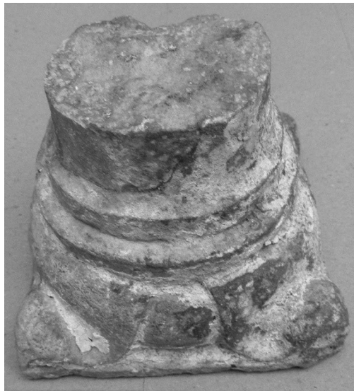
Sl. 8. a)