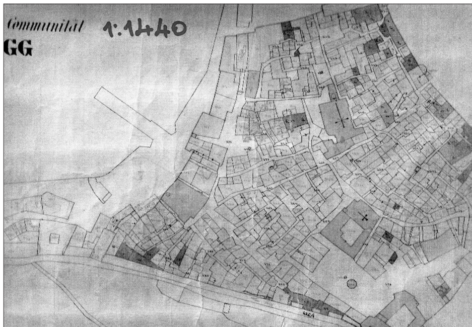
Sl. 2. Katastarski plan Senja iz 1870-ih godina s pozicijom Pavlinskog trga

crkve i samostana tlocrtno na mjestu gdje se bujica-potok slijevala u more. Pavlinskom crkvom i samostanom (smještajem, izgledom i preuređenjem) bavio se i Zorislav Horvat 6 . Također podatke o izgledu crkve i samostana, namjeni i važnosti tijekom povijesti donose i pojašnjavaju u svojem radu Vedrana Glavaš i Miroslav Glavičić 7 .