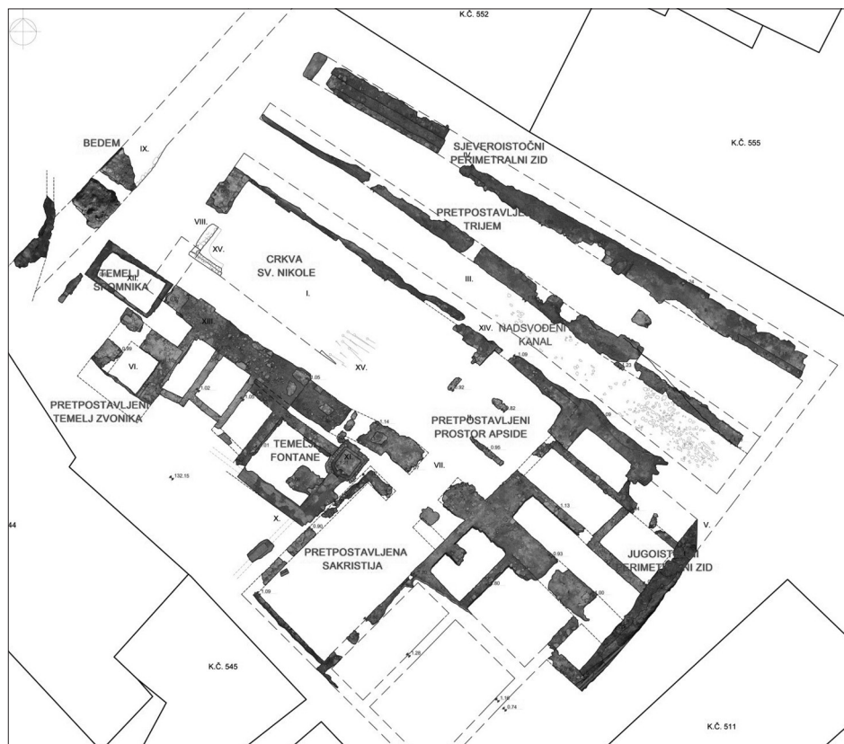
Sl. 4. Snimka Pavlinskog trga s ucrtanim otkopanim zidovima – gabaritima crkve sv. Nikole sa samostanom i dijelom bedema (izradio: V. Madiraca)

lice južnih gradskih zidina. Do ove faze potok je tekao kroz areal grada unutar zidina, tj. južni dio grada te kroz sjeveroistočni dio pavlinskog samostana. Potok je jasno vidljiv na već spomenutom planu iz 1763. godine na kojem se vidi blaži otklon korita potoka u smjeru zapada. Navedeni otklon vidljiv je i u pružanju ostataka kanala na današnjem Pavlinskom trgu.