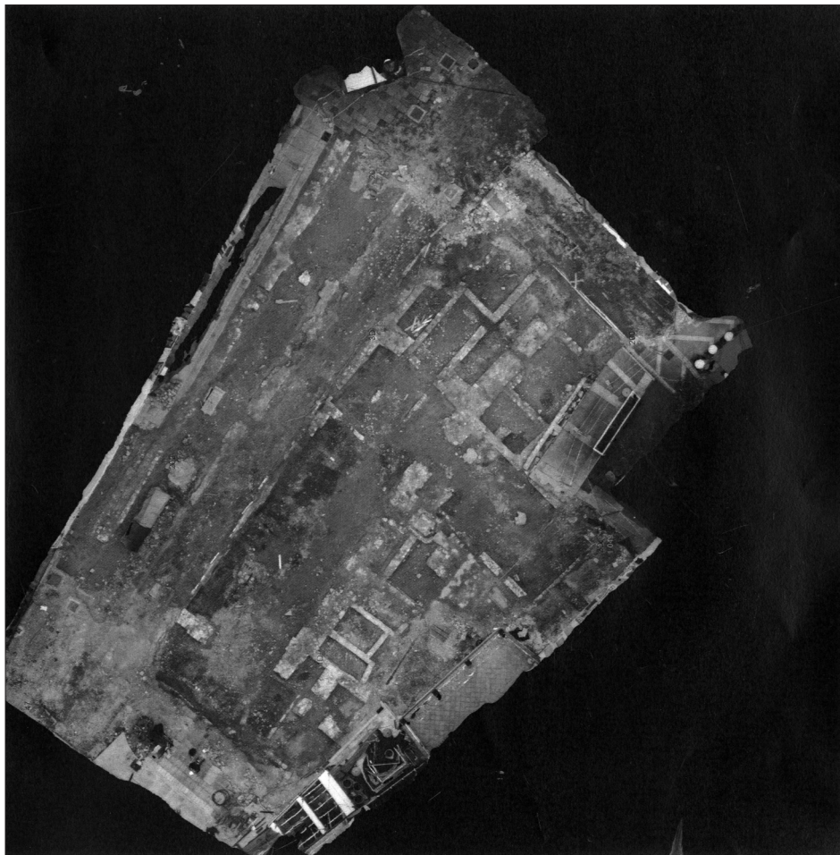
Sl. 3. Fotogrametrijski prikaz Pavlinskog trga (izradio: V. Madiraca) 10

Ovakvu je situaciju moguće naslutiti na temelju Valvasorove vedute iz 1689. i plana Senja iz 1763. godine.