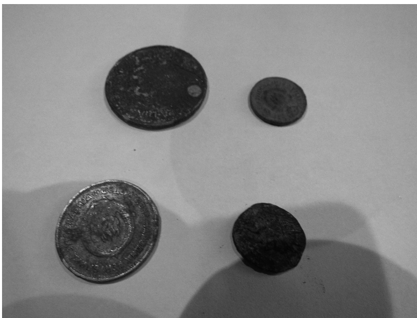
Sl. 7. Kovanice jugoslavenskih dinara