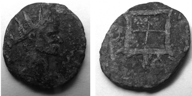
Sl. 6. a) i 6. b) - Antički novac po tipu Antoninijan iz vremena Klaudija II. Gotskog (268. – 270.); avers: glava s radijalnom krunom, desno; revers: CONSECRATIO, pravokutni monolitni žrtvenik