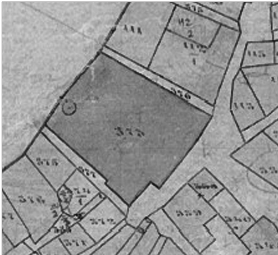
Sl. 6. Isječak katastarskog plana s vidljivim konturama samostana

je prema sjeverozapadu vezan uz pretpostavljenu sakristiju te je s istom formirao južno izbočeno krilo samostana (vidljivo na katastarskom planu iz 19. st.).