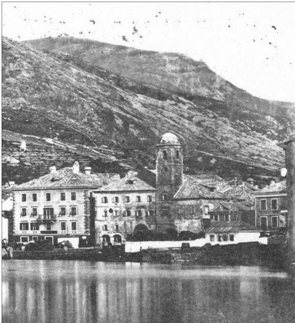
Sl. 7. Fotografija samostanskog sklopa iz 1869. godine

Na samom sjeverozapadnom završetku sklopa u liniji sa zapadnim pročeljem crkve utvrđeni su djelomično očuvani temeljni zidovi debljine do 1,20 m prostorije pretpostavljenog kvadratnog tlocrta. Pozicijom, tlocrtom i orijentacijom konstrukcija sugerira se da je riječ o temelju zvonika crkve vidljivog na Standlovoj fotografiji iz 1869. i prikazu Senja iz 1814. godine.