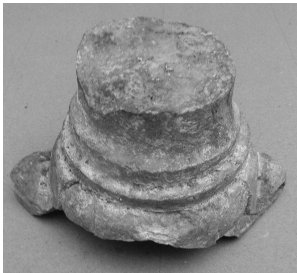
Sl. 8. b)