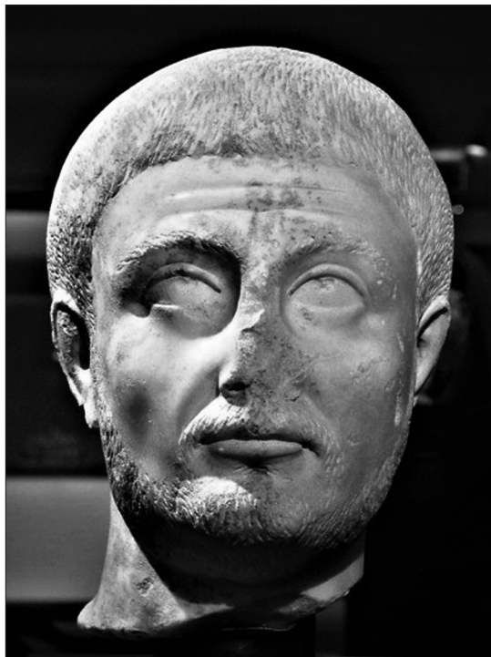
Sl. 3. Salona (Solin), portret muškarca, vjerojatno Dioklecijan (izvor: Universalmuseum Joanneum, Graz)

početku sinovljeve vlasti otkriva ostatke križa na Golgoti. 19 Međutim, to se dogodilo tek znatno kasnije, godine 326. kad ona boravi na Istoku. "Otkrivene" relikvije Helena je pohranila u Rimu u crkvi Santa Croce in Gerusalemme. 20 Čudno je što autor takvu kronološku nepodudarnost koristi kad mu je za radnju posve nepotrebno. Istina je, doduše, da je kršćanstvo bilo prisutno u obitelji Konstancija I., jer mu se jedna kći (Konstantinova polusestra) zvala Anastazija (od anastasis - uskrsnuće). Majka joj je Theodora, a ne Helena.