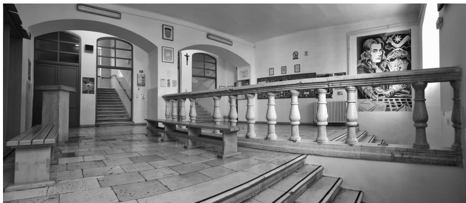
Sl. 5. Aula Srednje škole u Senju - 27. rujna 2021.