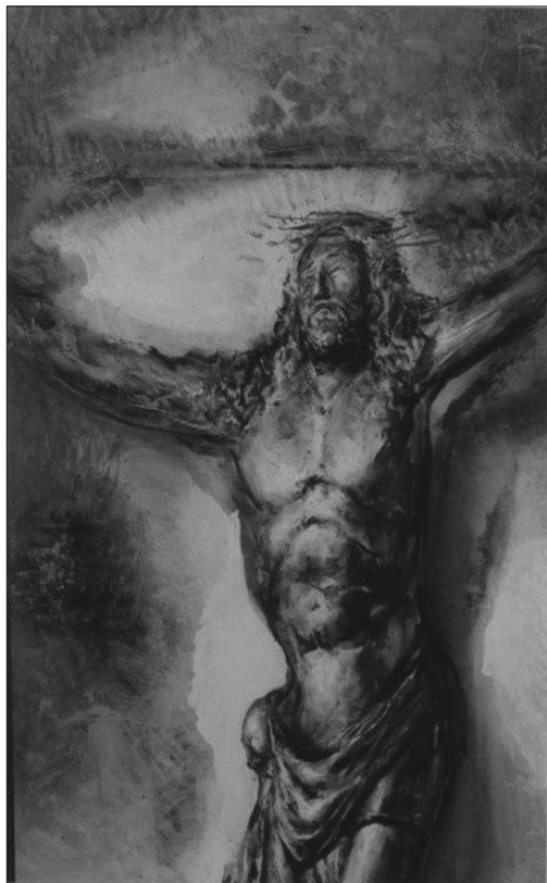
Sl. 3. Sakralni motiv, ulje na platnu

Veliki interes za različite oblike likovnog stvaralaštva Drago Lopac pokazivao je već u osnovnoj školi. Tu umjetničku nadarenost uočio je prof. Petar Kos, akademski kipar, koji mu je u svojem atelijeru omogućio bavljenje slikarstvom, kiparstvom i modeliranjem. Njihova suradnja i prijateljstvo potrajalo je sve do kraja života.