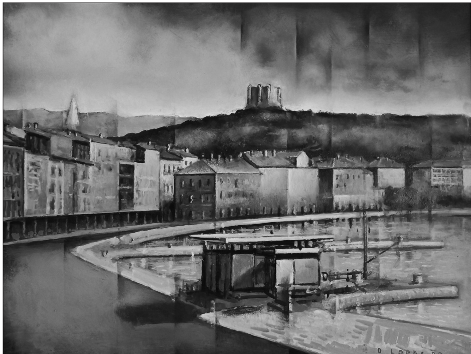
Sl. 2. Senj – vizura grada

roka zapošljava se u Osnovnoj školi Skrad (od 1966. do 1973.), a potom u Osnovnoj školi Ivana Mažuranića u Novom Vinodolskom (od 1973. do 1992.) kao profesor likovnoga odgoja. Znanje i talent za umjetnost s puno žara prenosi na mnoge generacije učenika koje okuplja u likovnoj sekciji, među kojima neki još i danas predaju likovnu kulturu školarcima ili rade kao slobodni umjetnici. Njegovi talentirani učenici osvajaju važne nagrade likovne kulture - od lokalne do državne razine, objavljuju radove u dječjim časopisima ( Modra lasta i Galeb ) i uređuju školske novine u Novom Vinodolskom ( Mažurana ).