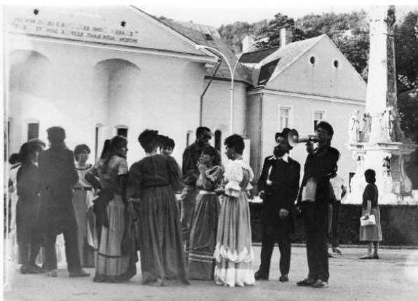
Snimanje dokumentarca o požeškoj grupi Dodir, 1984.