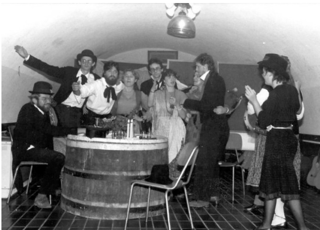
Grupa Dodir, Auvergnanski senatori, Gradski vinogradarski podrum, 1984.