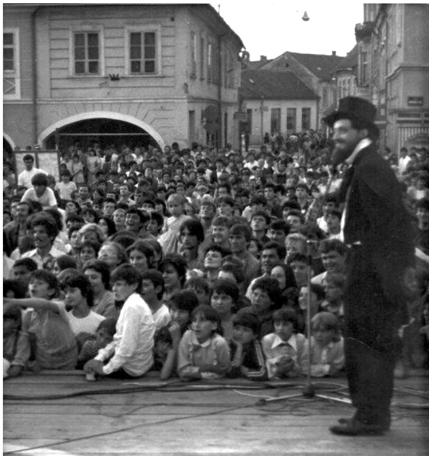
Okupljena publika na požeškom Trgu za vrijeme programa koji je pripremila grupa Dodir u okviru LIDAS-a, 1984.