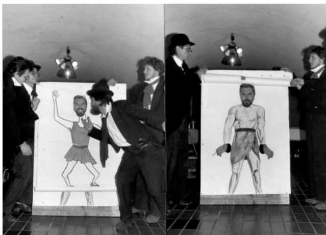
Grupa Dodir, Auvergnanski senatori, Gradski vinogradarski podrum, 1984.