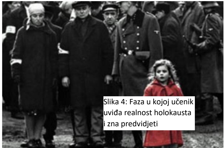
Slika 4: Faza u kojoj učenik uviđa realnost holokausta i zna predvidjeti

prilično potresni, ali u isto vrijeme kao učiteljica osjećam zadovoljstvo pri spoznaji da su shvatili dimenziju i da je znaju vrednovati.