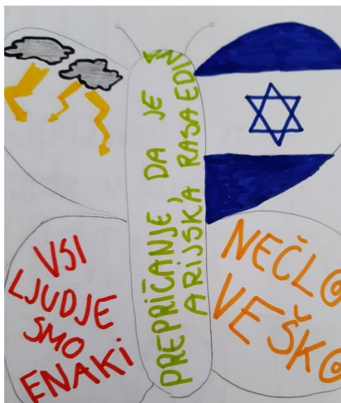
Slika 2: Percepcija učenika.