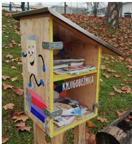
Slika 2: Knjigotrčnica pored školskog igrališta

Ako je lijepo vrijeme, čitamo u učionici na otvorenom ispred škole. U našoj učionici imamo kutak za čitanje, u koji svaki mjesec dodajemo knjige, časopise, zagonetke... Učenici ju uglavnom posjećuju tijekom odmora, jutarnjega čuvanja, produženog boravka, a učenici koji su brži u rješavanju školskih zadataka i tijekom nastave.