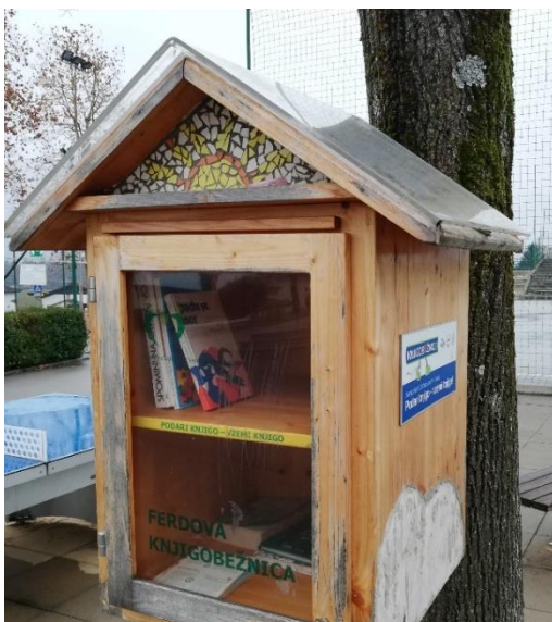
Slika 1: Knjigotrčnica ispred škole