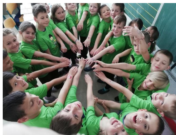
Slika 8: Radosni zaključak