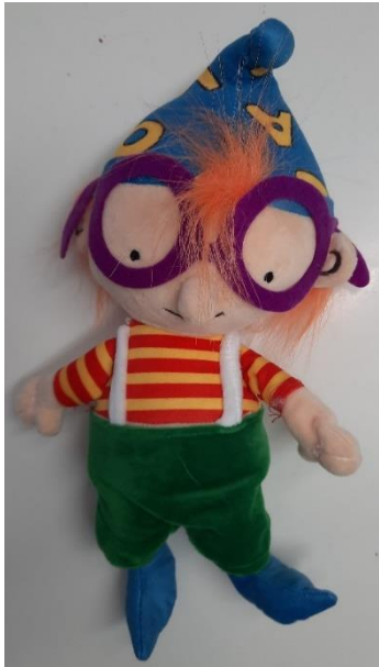
Slika 5: Patuljak Čitateljko

Prošle školske godine susreti su se uglavnom održavali na daljinu. Nažalost, tako će vjerojatno biti i ove godine.