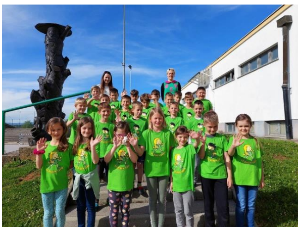
Slika 7: Dodjela zelenih majica

Prošla godina je bila malo drugačija. Dodjelu priznanja održali smo na školskom igralištu.