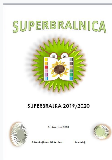
Slika 5: Priznanje za sudjelovanje u Superčitaonici

Na sudjelovanje smo pozvali i stručne radnike škole, što je učenicima bila dodatna motivacija. Tako su se učenici natjecali sami sa sobom, s kolegama i učiteljima. Na kraju godine svi učenici koji su predali 5 ispunjenih čitalačkih iskaznica na kraju godine dobili su nagrade.