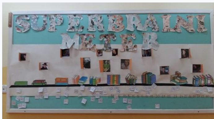
Slika 1: Mjerač super očitavanja

Ideja se rodila iz riječi super-čitač i tako smo došli na ideju Superčitaonica. Sustavno smo se pozabavili ovim pitanjem. Odredili smo kriterije za stjecanje titule superčitača. Odlučili smo da svatko tko pročita 5 knjiga dobije priznanje, knjige se mogu birati prema dobi uzrasta. Željeli smo da Superčitaonica bude natjecateljskog karaktera, pa je svaki učenik dobio startni broj, a napredak mjeren je na „supermetru“, koji smo uz pomoć učenika napravili i objesili na oglasnu ploču ispred knjižnice. U tu svrhu izrađen je logo koji je prepoznatljiv znak Superčitaonice.