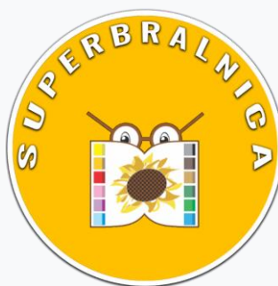
Slika 3: Logo