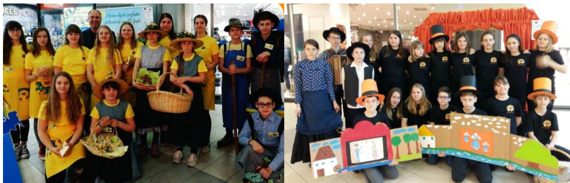
Slika 1: Učenici na natjecanju

Motivacija za sudjelovanje je velika jer učenici unaprijed znaju da će svoje zadatke uspješno obaviti. Projekt izražava unutarnju i vanjsku motivaciju. Kako smo svih ovih godina bili nagrađivani zlatnim priznanjima i nagradnim putovanjima, vanjska motivacija je od velike važnosti, a ujedno je poseban doživljaj predstavljanje u jednom od najvećih trgovačkih centara u Sloveniji, a samo natjecanje se održava u poslijepodnevnim satima.