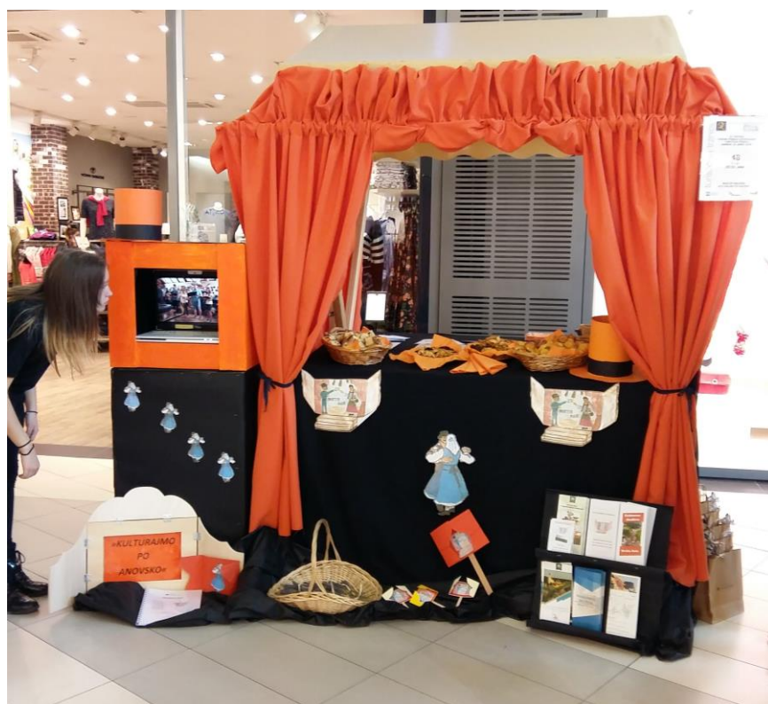
Slika 3: Turistički štand