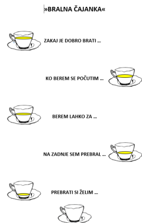
Slika 1: Koraci „Čajanke čitanja“ na plakatu