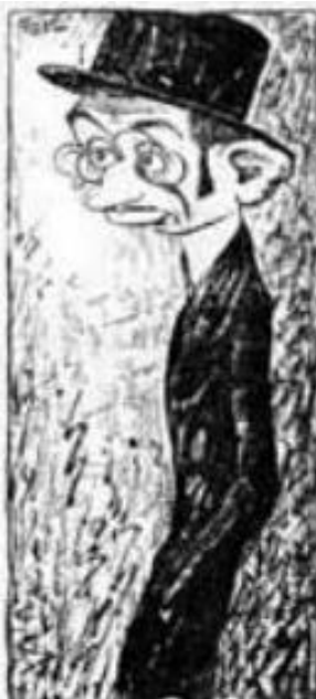
Slika 1: Karikatura Emanuela Vidovića, Advokat, Duje Balavac, 1911.

Prije predstavljanja rezultata, potrebno je objasniti vrste karikatura koje postoje. Prvotno definiranje karikature određuje se u užem i širem smislu (Dulibić, 2005: 1). Uži smisao obuhvaća samo portrete ljudi i takva karikatura se bavi isključivo pojedincem (Slika 1). S druge strane, karikatura u širem smislu donosi pozadinu događaja, bazira se na nekoj situaciji, zbog čega se često naziva i situacijskom karikaturom te je „zaokupljena zajedničkim karakteristikama grupe, odnosno uže ili šire skupine ljudi“ (Dulibić, 2005: 5) (Slika 2). Naše istraživanje temelji se na proučavanju karikatura u širem smislu, s time da nismo isključili mogućnost pojave karikature u užem smislu.