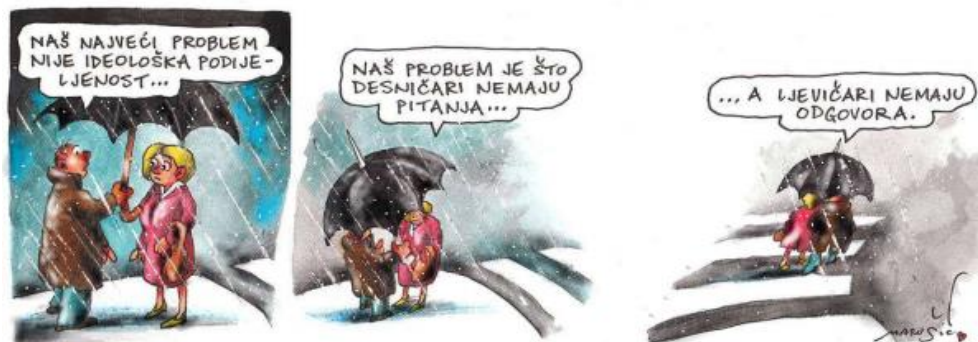
Slika 2: Karikatura Joška Marušića, Vijenac, 2013.