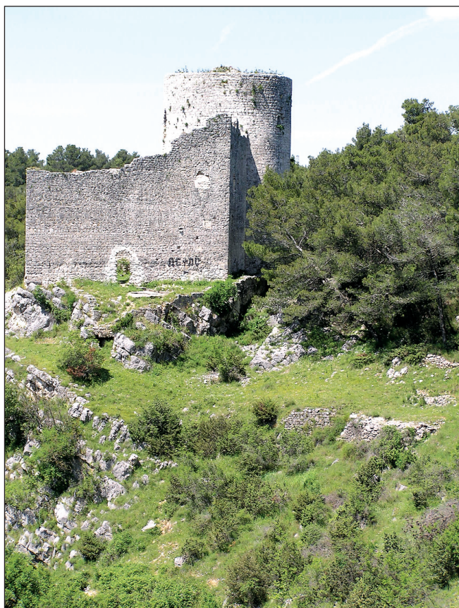
Sl. 3. Srednjovjekovna utvrda Kličevica, zapadno od koje prolazi rimski put.

Fig. 3. Medieval fortress Kličevica, west to which is a Roman way.