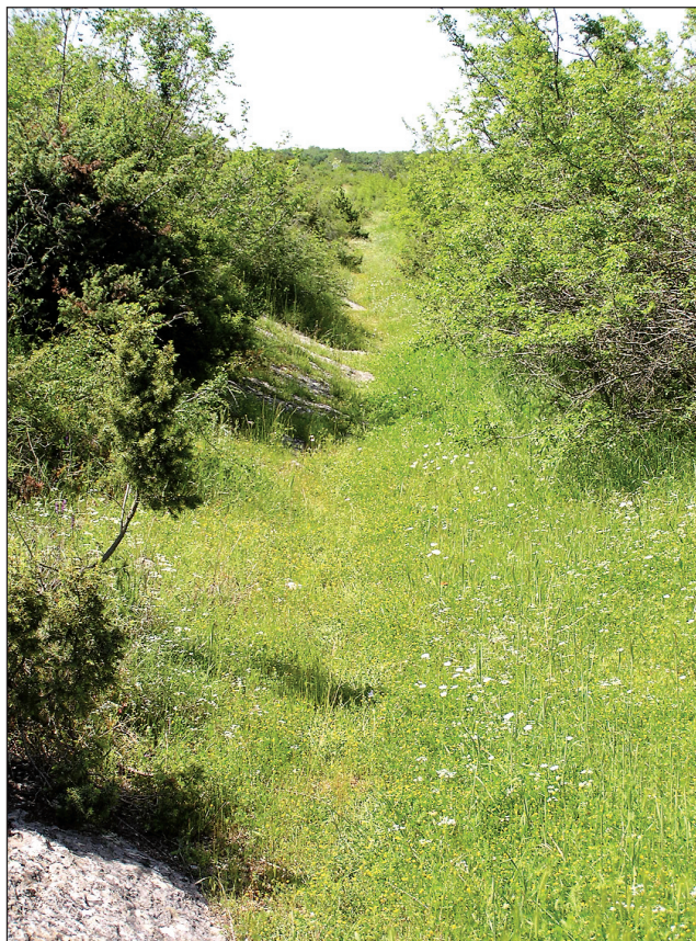
Sl. 4. Rimska cesta zapadno od mosta preko potoka Kličevica

Trasu ove ceste ranije sam detaljnije opisao, a na ovom bih mjestu ispravio i dopunio navode o njezinu pružanju istočno od Nedina, prema Aseriji. Naime, pretpostavio sam da rimska komunikacija nakon Gradine prelazi potok Kličevicu zapadno od istoimene utvrde /Sl. 3/ i preko doline u smjeru sjeveroistoka dolazi do sela Korlata. Tu se spaja s glavnom srednjovjekovnom komunikacijom Hrvatsko-ugarskog kraljevstva, u izvorima zvanom Via magna . To je u stvari rimska cesta, još u uporabi, koja prema Aseriji vodi iz Enone. 18 Zaista, preko polja u smjeru Korlata ide stari put koji bi mogao biti fosilizirani ostatak rimske ceste. Međutim, nedavno sam ponovnim