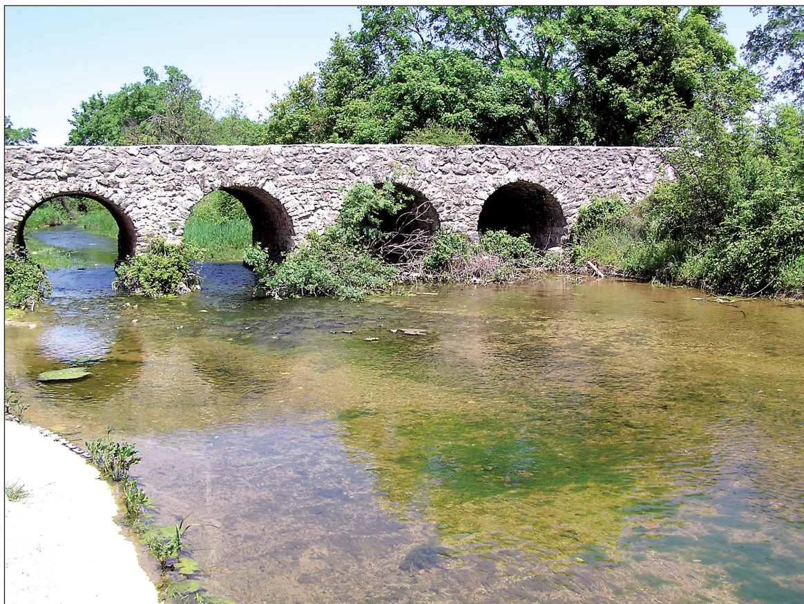
Sl. 5. Stari most preko potoka Kličevica Fig. 5. Old bridge over the stream called Kličevica

pregledom tog kraja otkrio ostatke rimskog puta koji čine još jedan krak, vjerojatno i važniji, trase ceste prema Aseriji. On je položen u prostoru između željezničke pruge i ceste koje iz smjera Zadra vode prema Benkovcu. Osobito je karakteristična dionica dužine gotovo pola rimske milje prije prelaska potoka Kličevice kod željezničkog mosta na tri kilometra udaljenosti od Benkovca /Sl. 4/. Izgrađena je na granici između obrađenih polja u dolini i povišene grede s jugozapadne strane. U ravnoj liniji spušta se prema potoku blagim ravnomjernim padom. Ta dionica sada nije u gotovo nikakvoj upotrebi i prilično je zarasla u vegetaciju. Svakako bi bilo potrebno napraviti nekoliko iskopa, za koje vjerujem da će potvrditi pretpostavku o karakteru tog puta. Kao dio poljske komunikacije stoji stari rustični most preko potoka Kličevice /Sl. 5/, odmah do suvremenoga željezničkog mosta. Moguće je i rimski prijelaz bio na tom mjestu, a nastavak ceste za Aseriju možda odgovara trasi korištenoga poljskog puta koji neposredno uz prugu vodi prema Šopotu i Benkovcu. Na žalost,