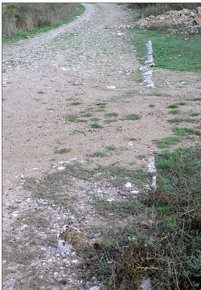
Sl. 9. Rubno kamenje ceste Asseria - Scardona ispred crkve Sv. Martina u Lepurima.

Fig. 9. Kerbstones of the road Asseria - Scardona in front of St Martin's in Lepuri.