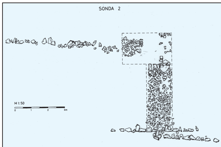
Sl. 6. Sonda 2 na cesti Iader - Asseria kod sela Bukovića. Vidljiva je širina ceste s ivičnjacima i loše sačuvanom ogradom ceste koja je dijeli od posjeda u Ravnim kotarima.

Pri kraju ravnog poteza, na udaljenosti od preko pola milje prije bedema odlično se uočava bivium . Nadesno se odvaja krak ceste što vodi prema zapadnim vratima Aserije. Taj ulaz riješen je kao propugnakul. Istraživanja su uputila na dugotrajnost korištenja porte i višestruku promjenu visine pragova i hodne površine ceste. Idući prema Burnumu lijevim, glavnim krakom ceste oko 400 metara naprijed od spomenutog bivija nailazimo na položaj gdje je nekad bilo drugo raskrižje (danas devastirano krčenjem zemlje), od kojeg se nadesno odvajala ulica kojom se u grad ulazilo kroz Trajanova, sjeverozapadna, vrata.