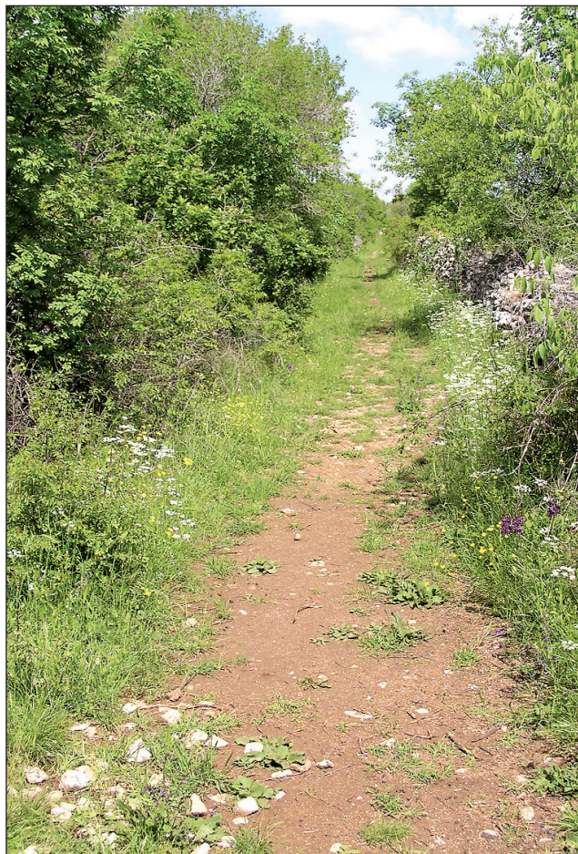
Sl. 8. Fosilizirani ostaci ceste Asseria – Alveria / odnosno Sidrona - Burnum oko pola milje zapadno od legijskog kampa.

ću raniju rekonstrukciju prema kojoj je od Aserije do putne postaje kod Alverije 12 milja, a odatle još 12 milja do Burnuma. 23 Na potezu prema Burnumu, neposredno nakon Bjeline rimsku cestu još nismo uočili na terenu. Unatoč tome čini se sigurnim da je tu negdje bio spoj s drugom cestom za Burnum, onom iz Sidrone, a koju su Abramić i Kolnago pratili u dužini od oko 3 milje od Medvide u smjeru Bjeline, te je ucrkali na karti rimskih cesta u sjevernoj Dalmaciji. 24 Pred kastrumom Burnum na terenu se odlično uočava završetak zajedničke komunikacije /Sl. 8/. Moguće ju je naslutiti već nekoliko stotina metara s istočne strane željezničke pruge Kistanje – Knin. Fosilizirana pod konjskim putem izvrsno je sačuvana sa suprotne strane, vodeći u ravnoj liniji na zapadna vrata kastruma ( porta principalis dextra ).