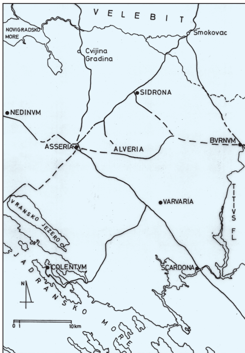
Sl. 2. Karta rimskih cesta oko Aserije

Utvrđeno je da temeljni prostorno-organizacijski oblik u ageru čine pagi , kakvi su pretpostavljeni na prostoru sela Lepuri i Perušić. 8 Sudeći prema natpisu nastalom neposredno nakon smrti cara Klaudija, čiji je flamen bio duovir i kvinkvenalni duovir Lucije Kaninije Fronto, Aserija je municipalitet stekla najkasnije sredinom 1. st. 9 Postizanju tog statusa vjerojatno je prethodila preraspodjela i premjera zemljišta za potrebe izrade katastarske mape ( formae ). Taj proces u provinciji Dalmaciji započeo je namjesnik Publije Kornelije Dolabela, što upućuje da je aserijatski teritorij tada premjeren i iznutra podijeljen. Zemljišta unutar teritorija svakako su stalno podložna razgraničenjima. Limites posjeda u vidu kamenih ograda otkriveni su u sondama postavljenim 2002. g. na segmentu ceste Jader - Aserija, na zaravni kod sela Bukovića. 10 Terminacijski zidići u pravilnom rasporedu pružaju se od te ceste na rubu zaravni Bukovice okomito u plodnu dolinu Ravnih kotara, što upućuje na gromatičku aktivnost na municipalnom teritoriju /Sl. 1/.