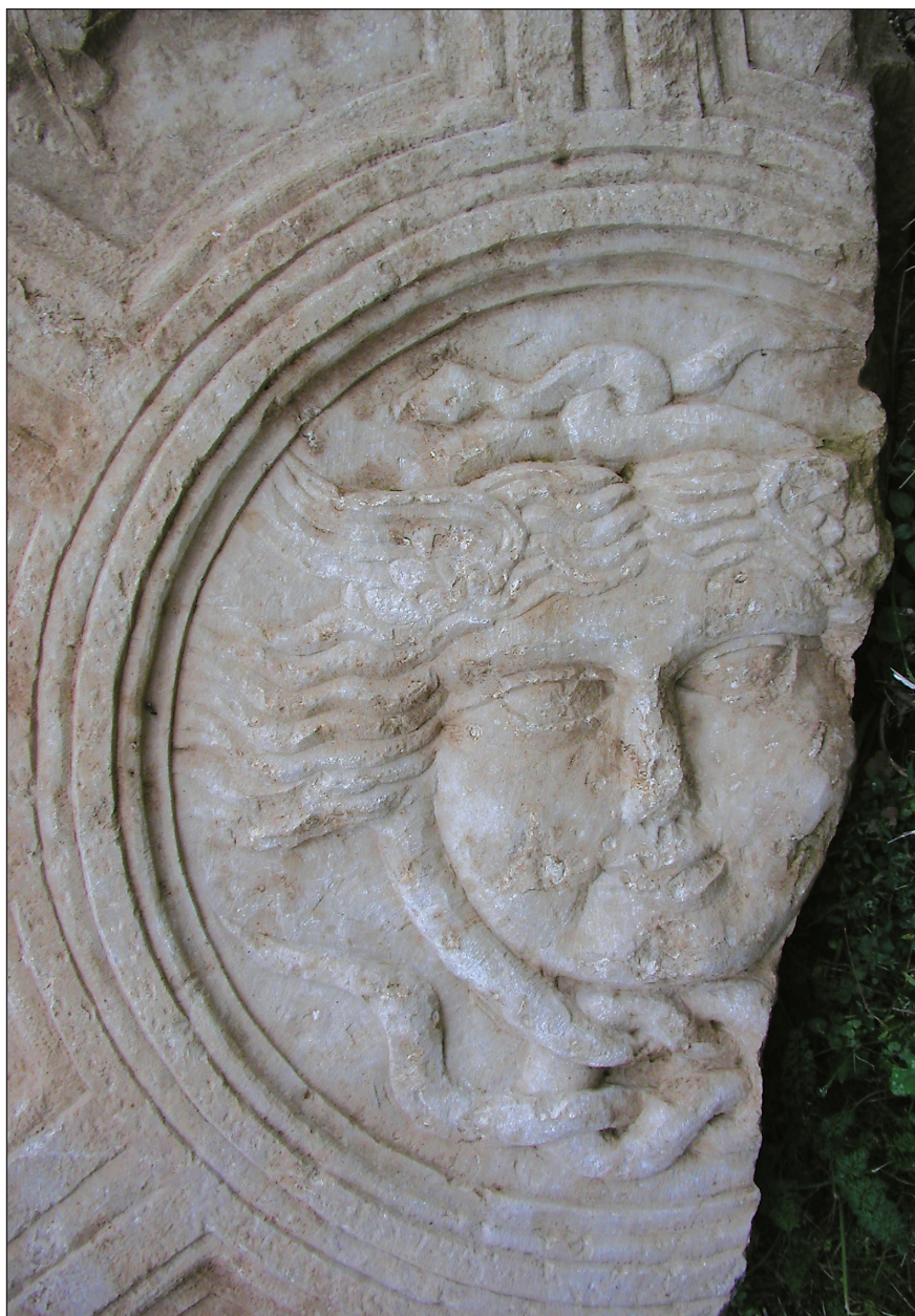
Sl. 3. Motiv Gorgone na stropnom reljefu Fig. 3. Gorgon as a motif on the ceiling relief

Ploča se po svojoj prilici sastojala od tri ploče koje su se međusobno spajale, na što bi upućivao ravni lom na gornjoj strani (u odnosu na glavu Gorgone). Vjerojatno je i ispod bila još jedna ploča koja se povezivala na približno istoj udaljenosti od donjeg dijela kruga kao i od gornjeg. Izgled cjeline aserijske ploče može se pouzdano rekonstruirati, barem kad je riječ