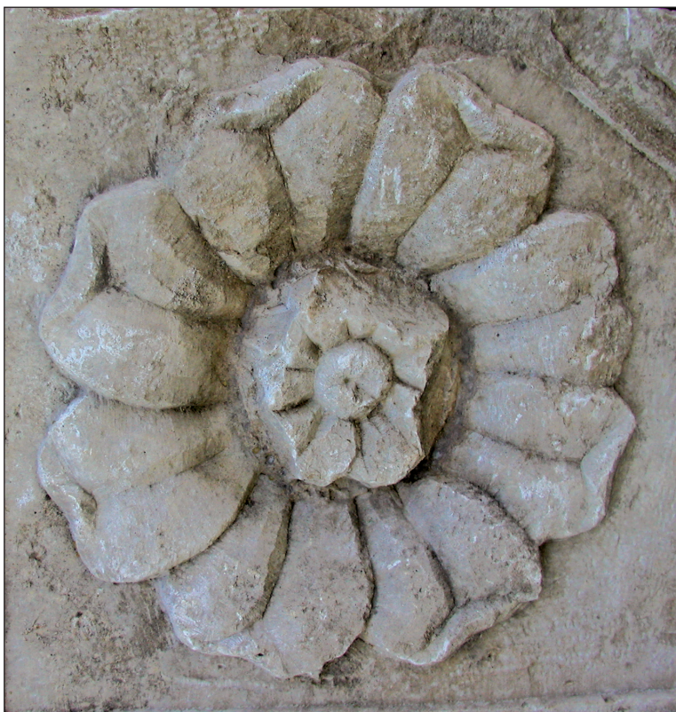
Sl. 4. Rozeta sa stropne ploče Fig. 4. Rosette on a ceiling tablet

o dekoraciji. Ono što se nalazi na očuvanoj četvrtini spomenika, nedvojbeno se ponavljalo i na ostalim segmentima. Međutim, ploča sazdana od tri dijela mogla je biti i kvadratnog i pravokutnog oblika. Na temelju očuvanog dijela fragmenta i motiva moglo bi se zaključiti da je cjelina bila sljedećih dimenzija: 2,70 X 2,70 m, ako je bila kvadratna /Sl. 5/, a u slučaju da je bila pravokutna, tada su njezine dimenzije bile 2,70 X 2,15 m /Sl. 6/. Profil na debljini upozorava da je ploča morala biti podignuta i oslonjena na neki zid ili monolitne upore. Ona, naime nije mogla stajati okomito kao nekakav reljef, plutej ili ograda. Tome