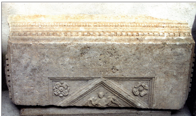
Sl. 7. Fragment stropne ploče iz Zadra Fig. 7. Fragment of a ceiling tablet from Zadar

oblika i koncepcije (geometrijski segmenti koji se radijalno protežu od središnjeg medaljona). Šteta je što nije poznata arhitektura grobnice, jer bi tek u tom slučaju rekonstrukcija stropnice bila mnogo pouzdanija. Takvu podjelu s centralnim okruglim motivom imaju često različita ukrasna polja. 9