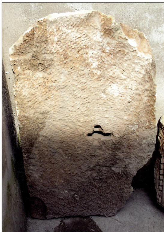
Sl. 9. Drugi ulomak stropne ploče iz Zadra

Fig. 9. Another fragment of a stone tablet from Zadar