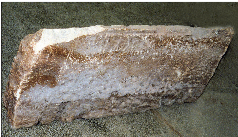
Sl. 8. Poledina stropne ploče iz Zadra

u središtu, kao i u Aseriji, bio izrađen kvadrat ili romb s Gorgoninim licem, dugom kosom i zmijama. U prvom slučaju ispod glave je također preplet zmijskih uhvaćenih Heraklovim čvorom te dugom kosom. U drugom je slučaju glava još fragmentiranija, tako da zmijske nisu očuvane. U prostorima sa strana su dupini, a kod druge dupin