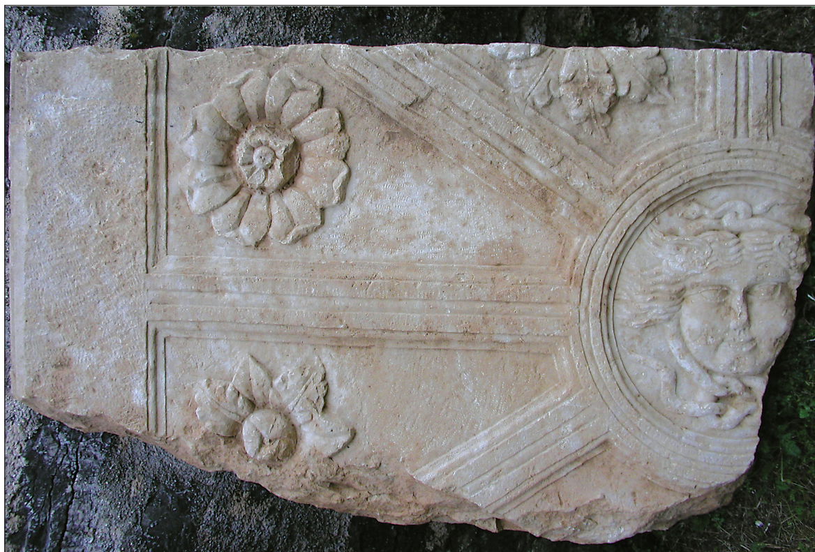
Sl. 2. Fragment stropne ploče s reljefom Gorgone Fig. 2. Fragment of a ceiling tablet with a relief of Gorgon

Očuvani fragment približno je tek jedna četvrtina čitavog spomenika. U središtu je bio okrugli profilirani medaljon s reljefom Gorgone obla lica i standardna ukočena i beživotna izraza oko čije se glave ovijaju dvije zmijske glave /Sl. 3/. Jednoj je glava gore i jednostavno se zavija oko repa druge, kojoj je glava dolje, gdje se omata oko repa prve. Donji vez zmijske glave (ispod Gorgonine brade) načinjen je poput vrlo fino izrađenog Heraklova čvora (mornarski pašnjak). Iz Heraklova čvora izdvaja se lijevo zmijski rep, a desno je po svojoj prilici bila glava. Način povezivanja zmijske glave jedino je tako moguć, jer su oko glave Gorgone upletene samo dvije zmijske glave. Gorgonina kosa podijeljena je središnjim razdjeljkom. Na krajevima čela zapažaju se dva krilca koja dolaze do ruba ivičnog kruga. Sa strana pak ide kosa, koja se širi postrano, također do samog ruba. Iz središnjeg medaljona zrakasto izlaze plastična rebra koja dijele preostali prostor na osam polja. Rebra su raščlanjena jednom središnjom trakom, a prema poljima je izrađena normalna stepenasta, ali i obla profilacija. U tim poljima isklesani su cvjetovi. Jedan je cvijet očuvan u cijelosti /Sl. 4/, a drugi je malo oštećen. Cvjetovi nisu istog oblika. Gornji ima osam latica koje su na krajevima zaobljene i mesnate. U središtu cvijeta je pupoljak sa središnjim krugom. U donjem je polju također cvijet s osam latica, ali su one zašiljene, a rubovi