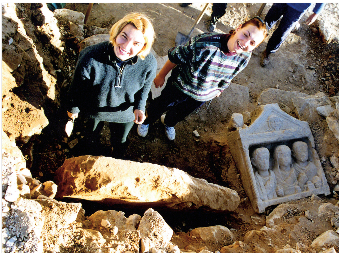
Sl. 1. Položaj nalaza stropnog reljefa

U predbedemu antičke Aserije, koji je služio kao dodatno ojačanje inače vrlo snažnom i čvrsto zidanom prstenu gradskih fortifikacija od megalitskog kamena, pronađen je fragment ploče s reljefom od vapnenca sljedećih dimenzija: duž. 154, šir. 89,5 i deblj. 23,8 cm /Sl. 1,2/. 1 Predbedem je izrađen uglavnom od spolija podrijetlom s obližnjih nekropola i njihova je količina uistinu impresivna, što za kasnoantičko doba nije nimalo neobično. Dovoljno je prisjetiti se salonitanskih zidina i bezbrojnih spolija koje su služile kao običan graditeljski materijal. Nekropole su poslužile kao bogati kamenolom koji je pri ruci nudio obilje kvalitetnog materijala. Bez obzira na pijetet prema grobištima u trenutcima opasnosti, o tome se, naravno, nije vodilo računa. Vrijednost mnogih otkrivenih komada je velika i zato je potrebno svaki i najmanji fragment izvaditi i ispitati.