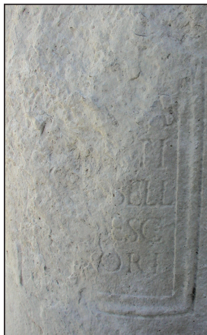
Sl. 15. Detalj s natpisom - cipus br. 3. Fig. 15. Detail with an inscription - cippus No. 3.