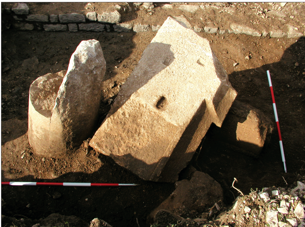
Sl. 3. Liburnski cipusi s kamenom gredom nad njima