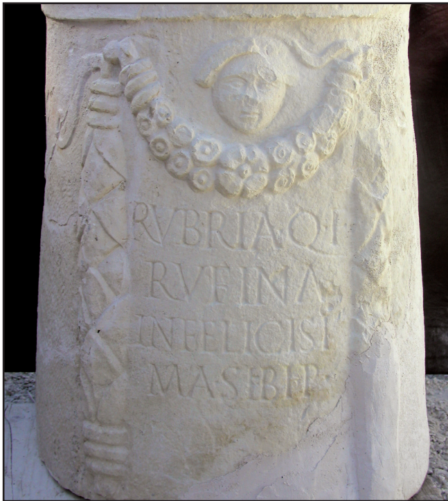
Sl. 12. Natpis na liburnskom cipusu br. 2. Fig. 12. Inscription on the cippus No. 2.

skupine komemorirani i komemoratori češće javljaju s dvočlanom imenskom formulom bez filijacije ili patronimika. 24 Cipus Rufine iz Aserije spada u onu grupu nadgrobnih spomenika koje osoba za života podiže sebi ( viva fecit ). Naime, liburnski nadgrobnni spomenici aserijatske skupine posve su specifični i po ovom epigrafskom detalju. Mada je uobičajeno i logično da se nadgrobnni spomenici podižu « post mortem », priličan broj aserijatskih cipusa podignut je « ante mortem », bilo da ga budući pokojnik podiže sebi - se viva (vivus) , se viva (vivus) fecit , ili sebi i bližnjima – sibi et . Na zapadu Rimskoga Carstva takva je pojava na nadgrobnim natpisima od 1. do kraja 3. stoljeća po Kristu veoma rijetka. Spomenici koje osoba daje izraditi « ante mortem » zastupljeni su u svega 1% slučajeva. 25 Iznimku čini Norik, gdje su « ante mortem » nadgrobnni natpisi izraženiji. 26 Na liburnskim cipusima aserijatske skupine « ante mortem » natpisi su do sada registrirani u sedam slučajeva, 27 odnosno s ovim novim spomenikom Rubrije Rufine čak s osam primjeraka, što čini 5.2%. Takvu pojavu moguće je objasniti željom osobe da za života osigura sebi, odnosno sebi i nekom svome, upravo takav spomenik.