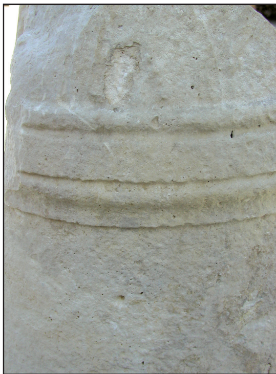
Sl. 16. Detalj s gornjom profilacijom - cippus br. 3. Fig. 16. Detail showing the upper profile border - cippus No. 3.

odlike za raniju dataciju. Oba natpisa pisana su u pravilnoj kapitali trokutastog dukusa. Tekstovi su pravilno raspoređeni na poljima koja su za njih predviđena, oni su bez ligatura i nepotrebnog prelamanja riječi u sljedeći red. Na spomeniku s erotima imenska formula je dvočlana, što se kod aserijatske skupine uočava na ranijim natpisima. I sam gentilicij Iulius potkrjepljuje tvrdnju da je spomenik nastao u ranom principatu. Gentilicij Rubrius do sada je poznat samo na još jednom cipusu iz Aserije koji podiže Titus Rubrius , a pokojnica je njegova kćerka Rubria Maximilla . 40 I taj cippus pripada ranom principatu i spada u "klasične" primjerke aserijatskih cipusa. Uz sve spomenuto, ni jedan od navedenih spomenika (br. 1, 2, 3) nema početnu posvetnu formulu D(is) M(anibus) , pa je i to jedan od elemenata za njihovu okvirnu dataciju u 1. odnosno u prvu polovinu 2. stoljeća po Kristu.