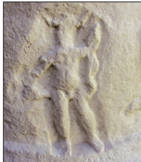
Sl. 7. Prikaz boga Merkura na cippusu br. 1. Fig. 7. Representation of a deity Mercury on the cippus No. 1.

na ovoj spomeničkoj kategoriji. Oba su cipusa pronađena na Aseriji u novim istraživačkim kampanjama. 14 S primjercima koje ovdje obrađujem /br. 1, 2/, na kojima u jednom slučaju horizontalnu cvjetnu girlandu drže eroti, a u drugom ona visi na stupovima od prepletenog lišća – okomitim girlandama, Aserija je ukupno dala pet potvrda uporabe ovoga dekorativnog elementa na sepulkralnim spomenicima – liburnskim cippusima.