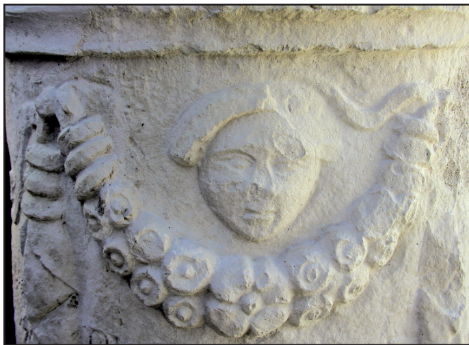
Sl. 13. Horizontalna girlanda i lice pokojnice (?) - cippus br. 2. Fig. 13. Horizontal garland and a face of a deceased woman (?) - cippus No. 2.

Maksimili, kćerci Tita Rubrija. 30 Dakle, s dva cipusa, bez nadgrobne are o kojoj će naknadno biti govora, do sada su poznate četiri osobe s ovim gentilnim imenom: Rubria T. filia Maximilla , Titus Rubrius , Rubria Q. filia Rufina , i Quintus Rubrius . Ako se ovom popisu doda i Rubria Restuta , koja je za života sebi podigla nadgrobnu aru u Lepurima, s područja Aserije poznato je pet osoba s nomenom Rubrius .