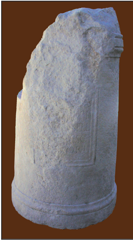
Sl. 14. Liburnski nadgrobni spomenik br. 3.

Fig. 14. Liburnian tombstone monument No. 3.