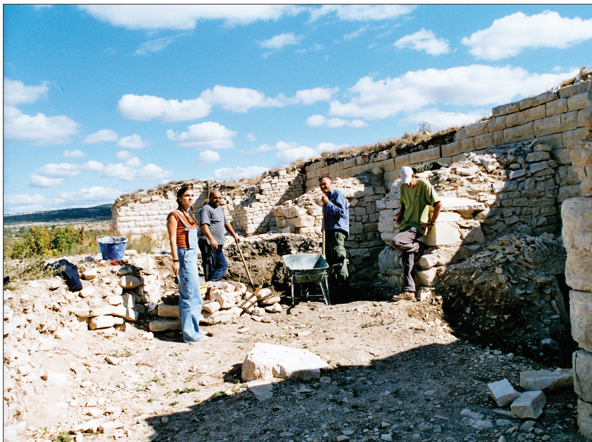
Sl. 2. Približan položaj nalaza tri nova liburnska nadgrobna spomenika

Fig. 2. Approximate place of find of the three recently found Liburnian tombstone monuments.