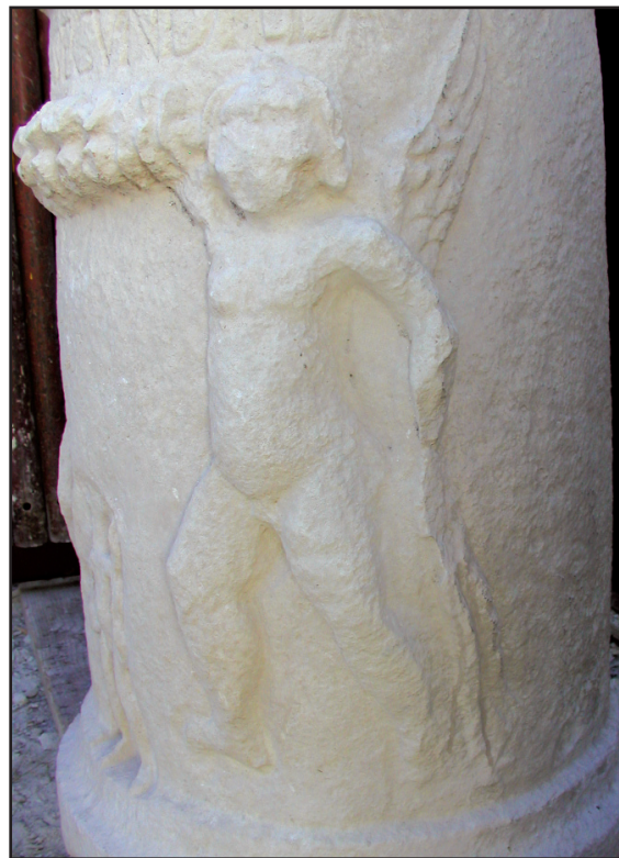
Sl. 9. Desni erot na cipusu br. 1. Fig. 9. Right Erote on the cippus No. 1.

skupine, nije prikazano božanstvo iz repertoara rimskog panteona - ovom likovnom prikazu daju posebno značenje. Druga iznimna pojava na ovoj kategoriji spomenika sepulkralne namjene je reljefni portret žene pod gornjom profilacijom cilindričnog tijela cipusa, odnosno nad izrazito lučno savijenom horizontalnom girlandom. Najvjerojatnije je ovdje prikazana pokojnica koja sama sebi podiže spomenik, ili oporučno ili, što u natpisu nije posebno istaknuto, za života. Teško bi bilo i pomisliti da reljefni portret predstavlja neko lokalno žensko božanstvo, jer je lik prikazan prilično shematizirano i bez ikakvih ikonografskih odlika. Ako je to tako, onda bismo ovaj primjerak liburnskoga nadgrobnog spomenika mogli nazvati i «portretni liburnski cippus».