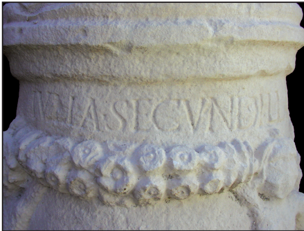
Sl. 6. Natpis na liburnskom cippusu br. 1. Fig. 6. Inscription on the Liburnian cippus No. 1.

Dakle, eroti, eroti s girlandama ili same girlande koje vise na okomitim stupovima od prepletenog lišća (okomitim girlandama), nisu izolirana pojava na liburnskim nadgrobnim spomenicima. No, nešto je ipak neuobičajeno i iznimno na spomenuta dva veoma bogato dekorirana cipusa /br. 1, 2; Sl. 5-13/. Na spomeniku s erotima koji nose horizontalnu girlandu, pojavljuje se niša s reljefnim prikazom Merkura Psychopomposa /br. 1; Sl. 5 i 7/. To se božanstvo na funeralnoj plastici Liburnije veoma rijetko susreće, bilo da je riječ o spomenicima s likovnim prikazima Merkurova lika ili o spomenicima epigrafske naravi. 14 Na području Aserije likovni prikaz Merkurova lika ustanovljen je samo s jednim primjerkom, i to upravo u Lepurima, u neposrednoj blizini ovoga značajnog antičkog središta. 15 Stoga iznesene činjenice - uz saznanje da do sada ni na jednom liburnskom nadgrobnom spomeniku, pa tako ni na primjercima iz najbrojnije aserijatske