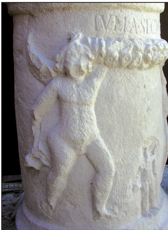
Sl. 8. Lijevi erot na cipusu br. 1. Fig. 8. Left Erote on the cippus No. 1.