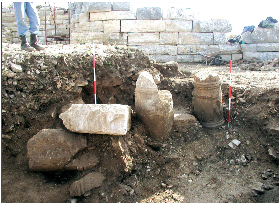
Sl. 4. Nalaz novih liburnskih nadgrobnih spomenika

Predstavlja li pojava likovnih prikaza na spomenutim aserijatskim cipusima neku posebitost u odnosu na ostale liburnske nadgrobne spomenike aserijatske skupine? Na to pi-