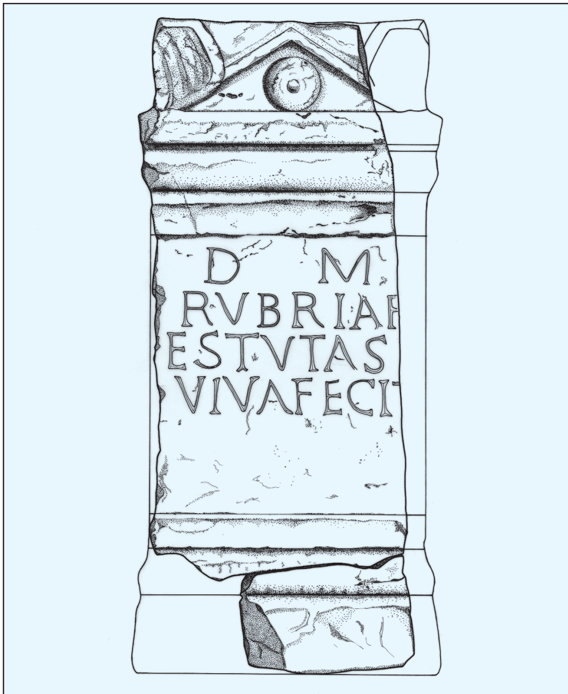
Sl. 18. Nadgrobna ara iz Lepura (br. 4)