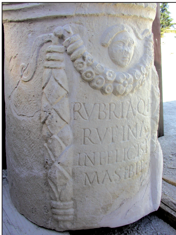
Sl. 11. Detalj s girlandama - cipus br. 2.

Dakle, ovdje imamo uobičajeniju nomenklaturu ženske osobe čije je ime izraženo na rimski način - dvočlana imenska formula s filijacijom (kćerka Kvinta). Takva imenska formula na ovoj spomeničkoj kategoriji dvostruko je zastupljenija od one bez filijacije, barem kad su u pitanju žene (20 osoba: 11 osoba). 23 Međutim, cjelokupno gledajući, kod onomastičke analize oba spola uočeno je da se na liburnskim nadgrobnim cipusima aserijatske