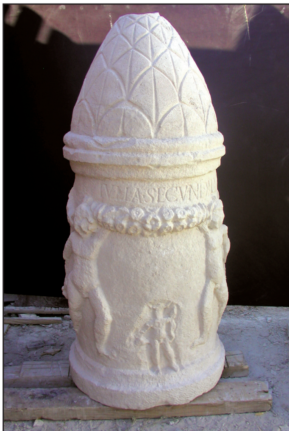
Sl. 5. Liburnski nadgrobni spomenik br. 1.

Girlande su, kako je već poznato, uobičajeni dekor na liburnskim nadgrobni spomenicima zadarske skupine, 12 ali oni nisu nepoznat ikonografski element ni na cipusima iz Aserije. Štoviše, na aserijatskim primjercima girlande su izrazito kvalitetno i realistično izrađene. Osim jednog fragmentarno sačuvanog cipusa, gdje je vidljiva samo horizontalno opuštena girlanda za koju nije moguće ustvrditi jesu li je držali eroti ili je ona ovješena, 13 još dva spomenika evidentno potvrđuju učestalost uporabe girlandi pri omeđivanju natpisa