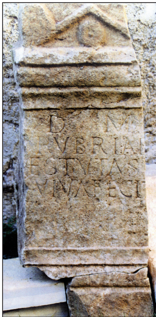
Sl. 17. Nadgrobnna ara iz Lepura (br. 4)

Eroti - nosioci girlandi - kao i same girlande poznati su dekor na javnim i sepulkralnim spomenicima antike. Nalazimo ih pred hramovima na plutejima foruma, na nadgrobnim arama i sarkofazima. Girlande su ukrašavale žrtvenike, hramove, tropea, razne mauzoleje i druge spomenike sepulkralne namjene. 41 One su zapravo “komemoracija u kamenu onoga što se u realnosti zbivalo na spomeniku i oko njega”. 42 A eroti koji ne pripadaju realnom svijetu već nadnaravnoj sferi, su “nadopunjavali nedostatak života u ikonografiji obješenih girlandi”. 43 Na novopronađenim cipusima u Aseriji nalazimo ikonografiju samih girlandi (br. 2) - komemoraciju stvarnosti u kamenu, koja je na drugom spomeniku (br. 1) obogaćena erotima u koračajućem stavu. No, kako je već rečeno, takvi ikonografski prikazi nisu usamljena ali ni učestala pojava na liburnskim nadgrobnim spomenicima - liburnskim cipusima. Eroti su u