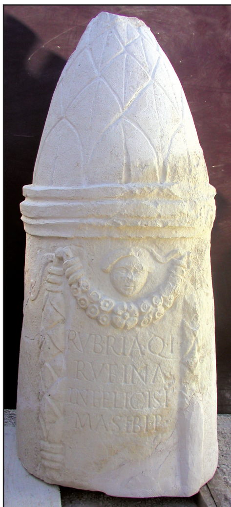
Sl. 10. Liburnski nadgrobni spomenik br. 2. Fig. 10. Liburnian tombstone monument No. 2.

Cipus s reljefima erota i Merkura /br. 1; Sl. 5, 6, 8, 9/ ima natpis pod gornjom profilacijom cilindričnog trupa, odnosno iznad bogate girlande od cvijeća. On je ispisan u jednom redu i donosi samo ime pokojnice u dvočlanoj imenskoj formuli bez filijacije. Kako se iz natpisa doznaje, pod spomenikom je pokopana Iulia Secundilla . Dvočlana nomenklatura kod muških osoba (bez patronimika ili filijacije) na liburnskim nadgrobnim spomenicima aserijatske skupine javlja se na šest natpisa. 17 Dvočlana imenska formula žena bez filijacije do sada je ustanovljena na devet spomenika, odnosno kod jedanaest ženskih osoba. 18 To su: Trosia Severa , Vesia Moderata , Cladia Secunda , Claudia Gratilla , Claudia Eutyca , Iulia Valentila , Iulia Virnoni--- , Veronia Prochne , Iulia Maximilla , Caelia Facunda i Caesia Tertulla . Novi nalaz liburnskog cipusa aserijatske skupine daje nam još jednu (dvanaestu) onomastičku potvrdu s dvočlanom nomenklaturom žene - Juliju Sekundilu: