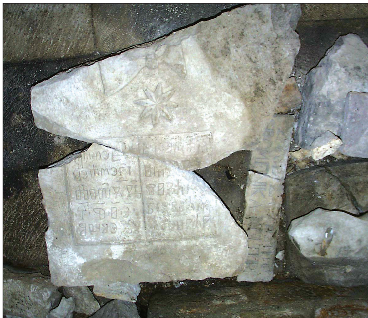
Sl. 1. Fragmenti I. i II. Fig. 1. Fragments I. and II.

U blizini Benkovca, u Podgrađu/Aseriji, na mjestu i u području u kojem dosad nije bilo znanosti poznatih srednjovjekovnih glagoljskih natpisa, otkriveno je posljednjih godina pet fragmenata kamenih ploča s glagoljskim natpisima. 1 Arheološki je to nalaz od iznimne važnosti. Fragmenti kamenih ploča nađeni su u ruševinama crkve sv. Marka/Sv. Duha, 2 gdje su služili kao građevni materijal pri jednoj od obnova crkve, vjerojatno onoj baroknoj. 3 Dva fragmenta sačinjavaju jedan natpis na jednoj ploči, fragmenti I. i II. /Sl. 1/. Širine su 70 cm, a oba, kad se sjedine, imaju duljinu od 60-ak cm. Debljina ploče iznosi 14 cm. Dimenzije natpisnoga polja u obliku otvorene knjige sljedeće su: širina 38 cm, visina 28 cm /Sl. 2/. Na fragmentu I. sačuvan je i dio ukrasa izvan natpisa: zvijezda dijametra 11 cm te vodoravno postavljen kalež visine 20 a širine 12 cm, na najširem dijelu. Fragmenti III. /Sl. 3/ te IV. i V. /Sl. 4/ možda jesu dio istoga natpisa, a možda i nisu, što