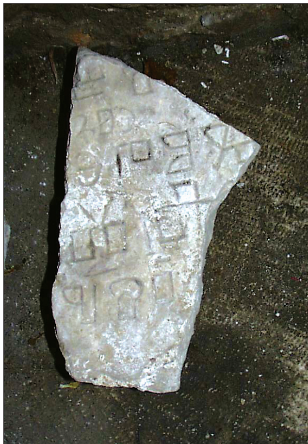
Sl. 4. Fragmenti IV. i V. Fig. 4. Fragments IV. and V.

Na putu iz Benkovca 1694. biskup je posjetio crkvu Sv. Marka u Podgrađu, nekoć slavnom gradu, gdje se nalaze prekrasni tragovi, gdje ima lijepih grobova i ostalih stvari vrijednih spomena.