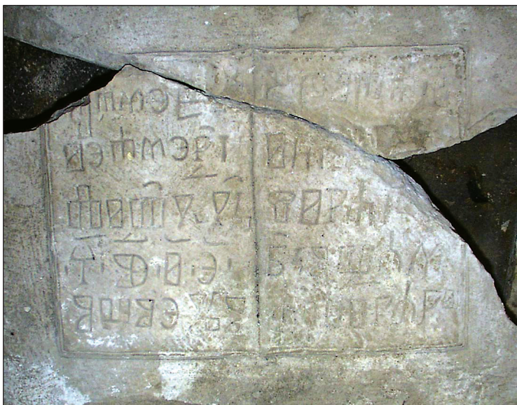
Sl. 2. Fragmenti I. i II., detalj.

je većina natpisnoga polja a na I. manji dio, ali je pukotina protegnuta kroz gotovo čitavu širinu natpisnoga polja, sijekuci i glagoljska slova, no tako da je moguće vidjeti da ona čine jednu cjelinu, kao i natpis uostalom, premda je na dvama mjestima ipak teže oštećen: gornji lijevi kut natpisnoga polja nedostaje s dijelom inicijala, a sredina desnoga dijela natpisnoga polja nedostaje u tolikoj mjeri da čini znatnu poteškoću u nastojanju da se rekonstruiraju oštećene riječi,