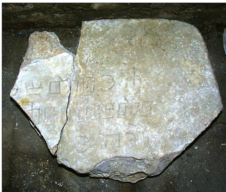
Sl. 3. Fragment III.