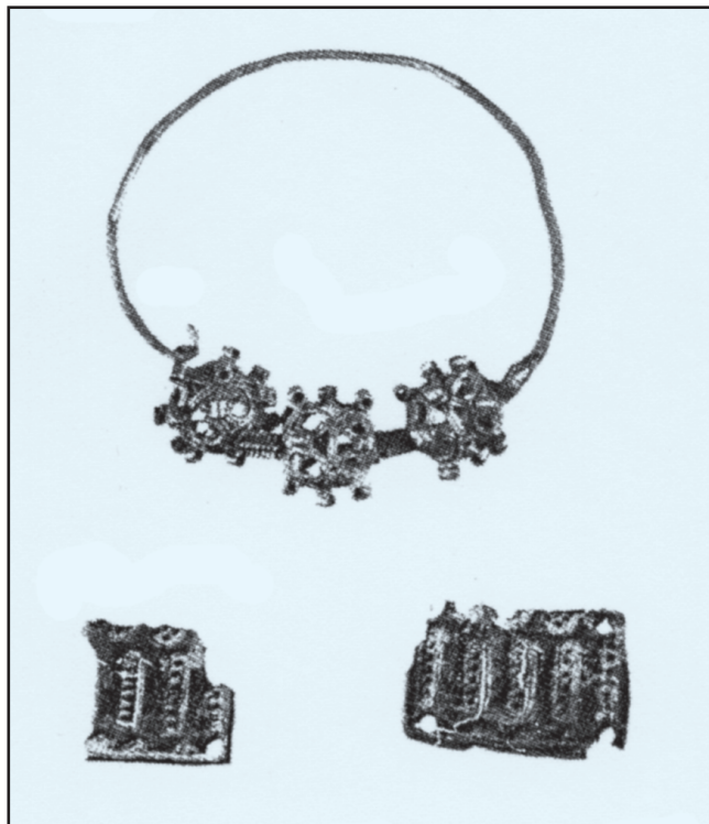
Sl. 3. Srednjovjekovni nakit - Aserija (Podgrađe kod Benkovca)

zastupatelj našeg kninskog hrvatskog starinarskoga društva. Po viestima što smo ih primili od pošt. g. predsjednika našega društva, ni obzirom na rimske ni na hrvatske starine nije veliki uspjeh ovogodišnjeg izkopavanja, koje u ostalom nije dugo ni trajalo, nego je prekinuto nakon malo dana namjerom, da će se prihvatiti iduće jeseni. Kopalo se je s istočne strane foruma, iza sadašnje crkve Sv. Duha, dosegnuvši do prema sredini sadašnjeg groblja. Na izričitu želju našeg gosp. predsjednika kopalo se i uz istočnu stranu grada, i otkrilo se je na tom mjestu desetak grobova. U svakomu se je našlo po nekoliko mrtvačkih priloga. Nadjena su dva liepa para velikog sliepočnog prstenja u inačicama kakvih do sada nije bilo u bogatoj sbirci našeg "Prvog muzeja hrvatskih spomenika". Našlo se je nekoliko predmeta i u starijim grobovima sadašnjeg groblja, ali ne u onoj količkoći, kako se je bilo inače nadati. Izašao je na svjetlost i jedan češalj, te jedna ostruga iz X. ili XI. veka". 13