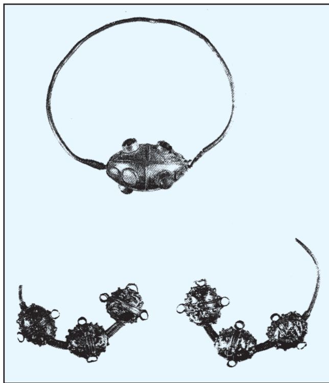
Sl. 2. Srednjovjekovni nakit - Aserija (Podgrađe kod Benkovca)

ostanke rano sredovječnih dakle hrvatskih zidova pred Trajanskim gradskim vratima izvan gradskih bedema, a, medju ruševinama za crkvicom S. Duha, nadjene su takodjer dvie staro-hrvatske nadstupinice i ulomci prizmatičnih debla stupčića, po kojima se je moglo nagađjati, da će se naići i na dalje ostatke staro - hrvatske crkve. Gornji tanki zidići malenih zgradja, koji se križaju sa temeljima prostorija rimskog kupališta na zapad staro - hrvatskog groblja, ne mogu takodjer da budu nego staro-hrvatski. Može se dakle slobodno kazati, da su na celom obsegu aserijatske glavice Podgradja, rimske starine pokrivenne hrvatskima, te da se, u čisto zanastvenom, sustavnom protraživanju, rimske starine ne smiju nipošto izkopavati bez obzira na hrvatske. I tako se je lani radilo, pa je naše društvo sabralo skromnu i malašnu, ali ipak znamenitu sbirku staro-hrvatskih predmeta, sa Podgradja. Ove godine, - dužnost nam je na žalost zabilježiti, - kad su se u Podgradju (Aseriji) nastavila izkopavanja, po nalogu istog bečkog c. k. ark. zavoda, pod upravom istog gosp. gradjevnog savjetnika Ivekovića, naše društvo nije bilo na vrijeme obaviešteno, niti se je iko drugi pobrinuo, da pri izkopavanju budu sabirane i sačuvane hrvatske starine. Za taj nastavak je upraviteljstvo