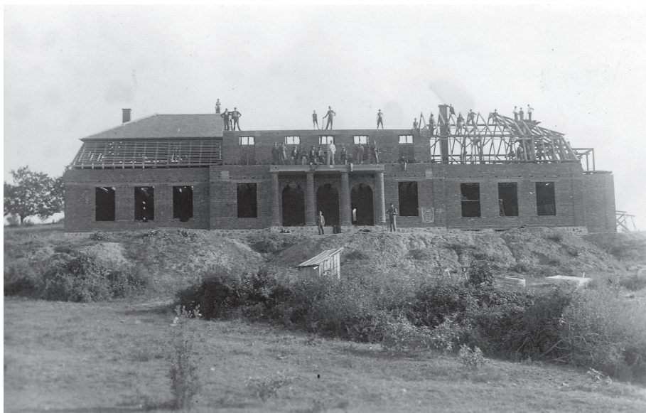
Sl. 11. Dvorac obitelji Adamović u Našicama u izgradnji, fotografija