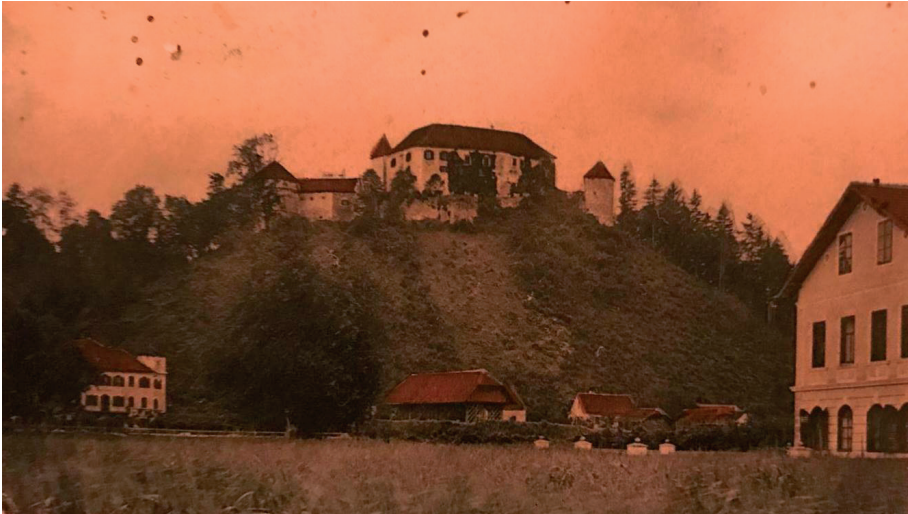
Sl. 3. Burg Velenje u foto-albumu obitelji Adamović