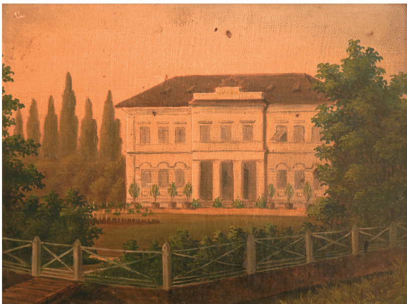
Sl. 1. Kurija obitelji Adamović u Čepinu