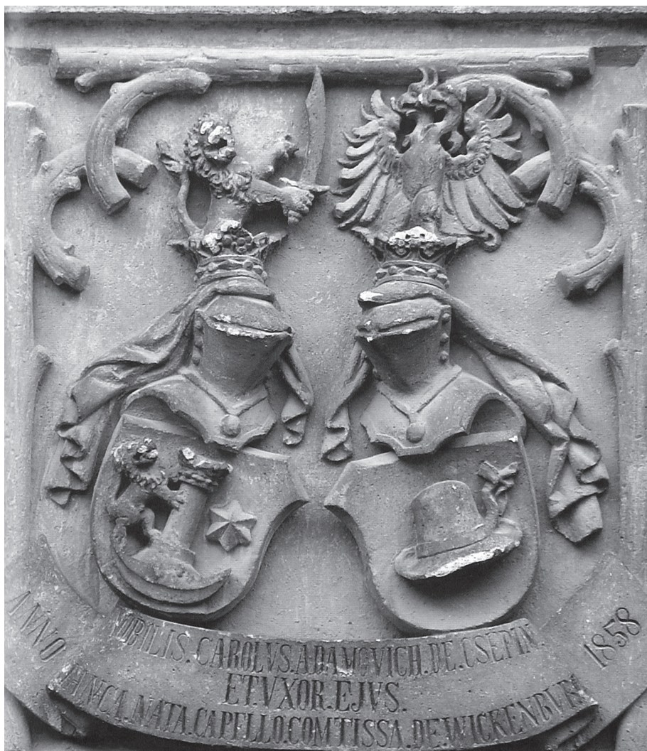
Sl. 5. Združeni grb obitelji Adamović Čepinski i Wickenburg u burgu Velenje