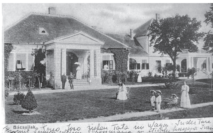
Sl. 8. Bačko Novo Selo u foto-albumu obitelji Adamović (zbirka Nikole baruna Adamovicha)