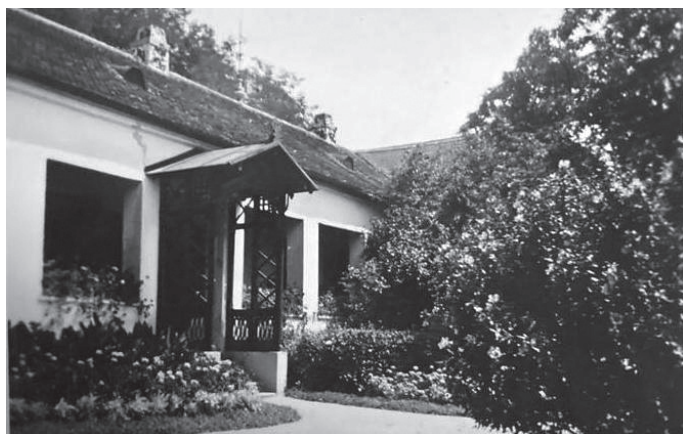
Sl. 7.a-b. Erdut u foto-albumu obitelji Adamović