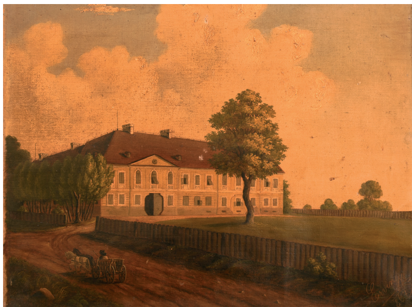
Sl. 2. Dvorac obitelji Adamović u Tenji (zbirka Nikole baruna Adamovicha; foto D. Šarić)