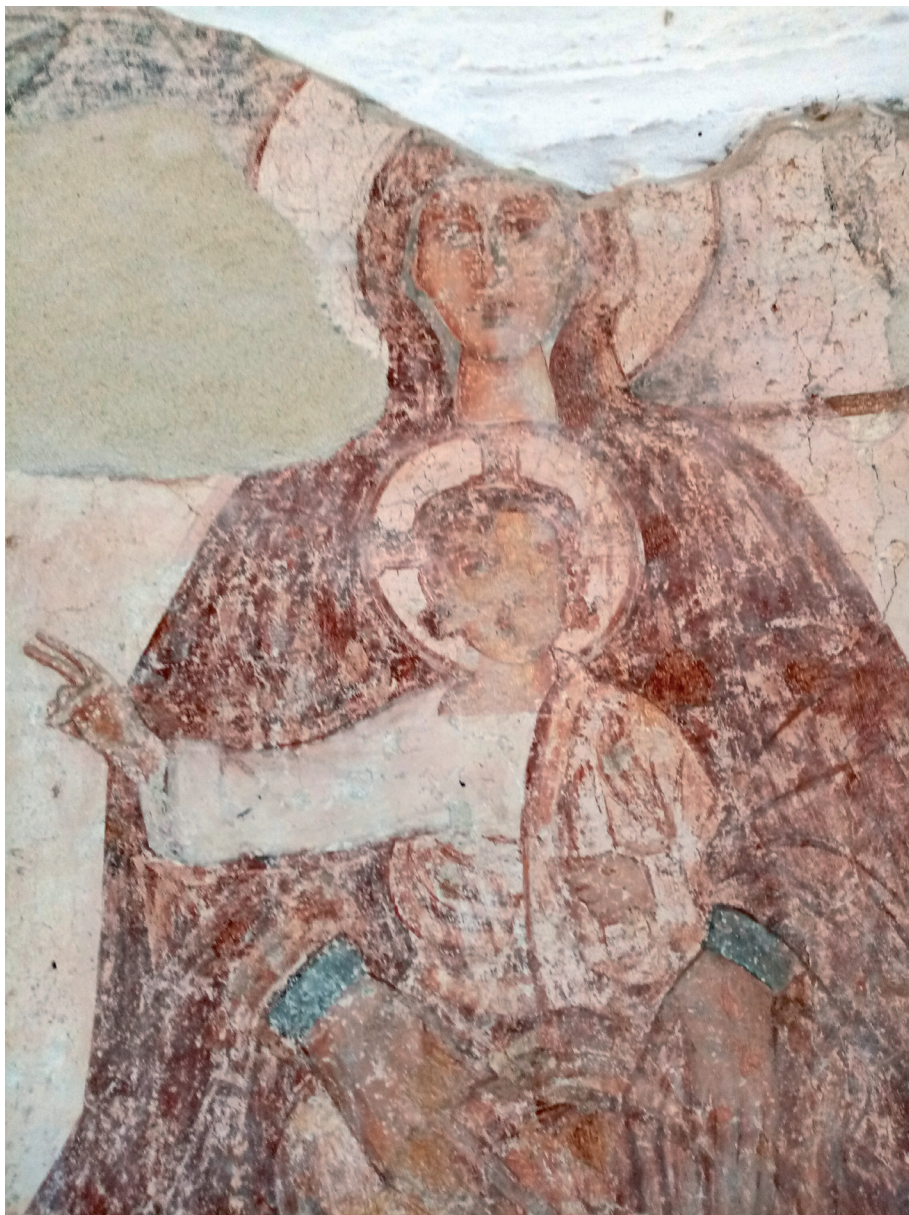
Sl. 9. Crkva Rođenja Presvete Bogorodice, svetište: Bogorodica na prijestolju s djetetom, detalj