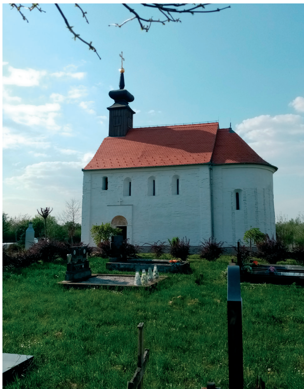
Sl. 1. i 2. Crkva Rođenja Presvete Bogorodice, Koprivna: jugoistočno pročelje i unutrašnjost