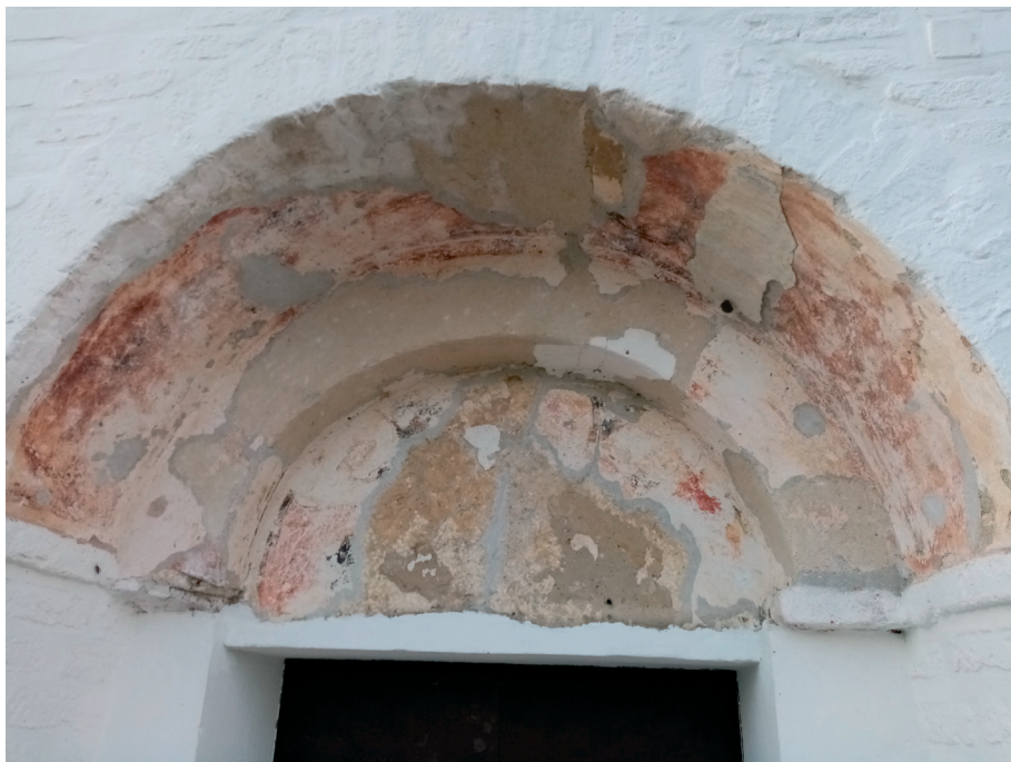
Sl. 7. Crkva Rođenja Presvete Bogorodice, Koprivna: portal, oslik u luneti