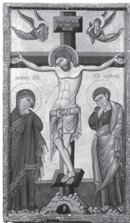
Sl. 13. Ikona Raspeće, Saint-Jean d’Acre, oko 1280., danas u sinajskom manastiru sv. Katarine (Drandaki, „A maniera greca“, 57, sl. 11a). Autor fotografije: Bruce White. Reproducirano u navedenoj literaturi uz suglasnost Manastira sv. Katarine, Sinaj, Egipat.