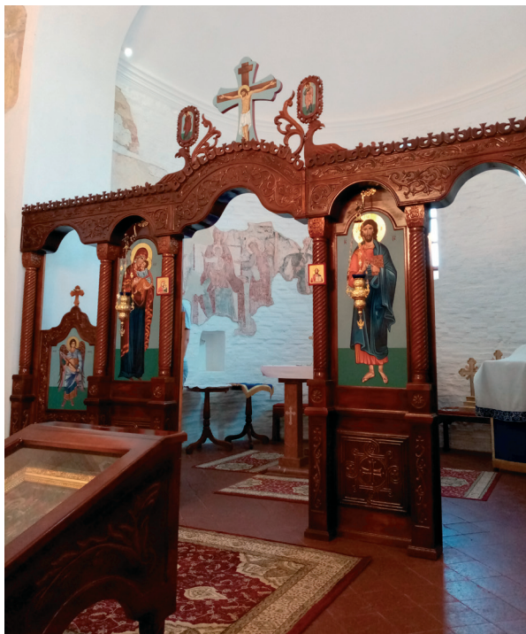
Sl. 3. Unutrašnjost crkve Rođenja Presvete Bogorodice, Koprivna: pogled na oslik svetišta kroz ikonostas