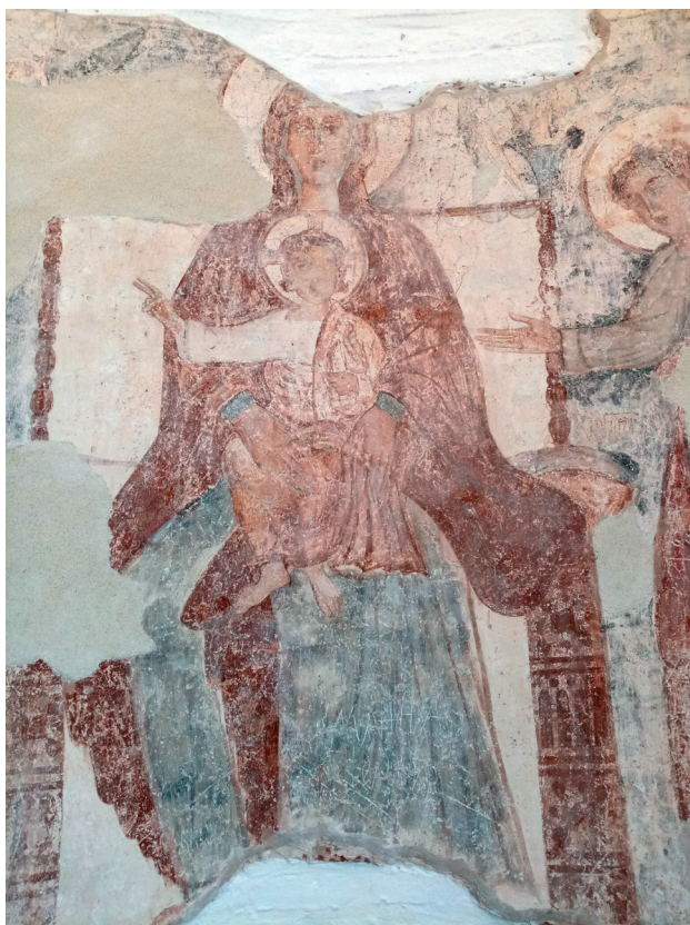
Sl. 5 i 6. Svetište crkve Rođenja Presvete Bogorodice, Koprivna: oslik s prikazom Bogorodice na prijestolju, arkandelima Gabrijelom i Mihaelom te mogućim prikazom sv. Jurja i prikaz Bogorodica na prijestolju s djetetom u naručju