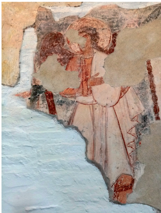
Sl. 11. Crkva rođenja Presvete Bogorodice, Koprivna: svetište, arkandeo Mihael