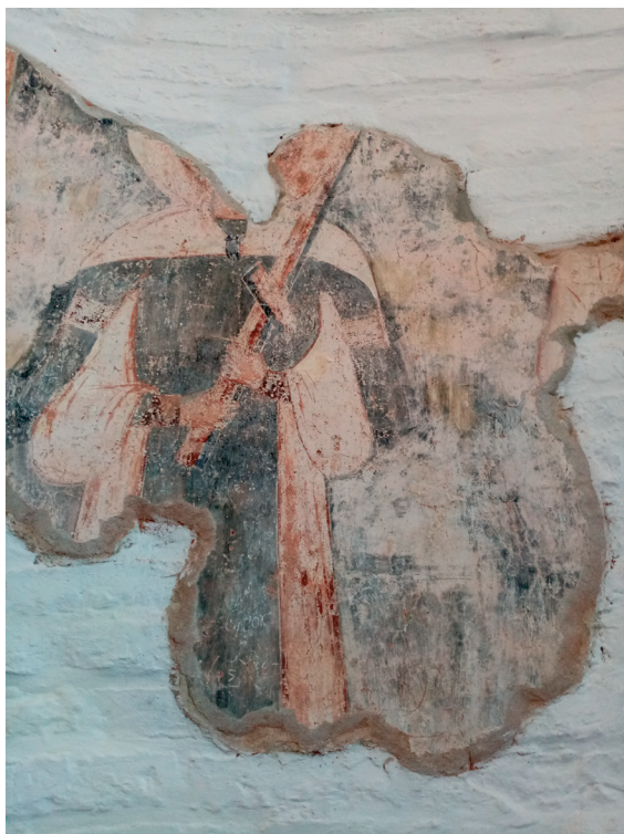
Sl. 8. Svetište crkve Rođenja Presvete Bogorodice, Koprivna: mogući prikaz sv. Jurja