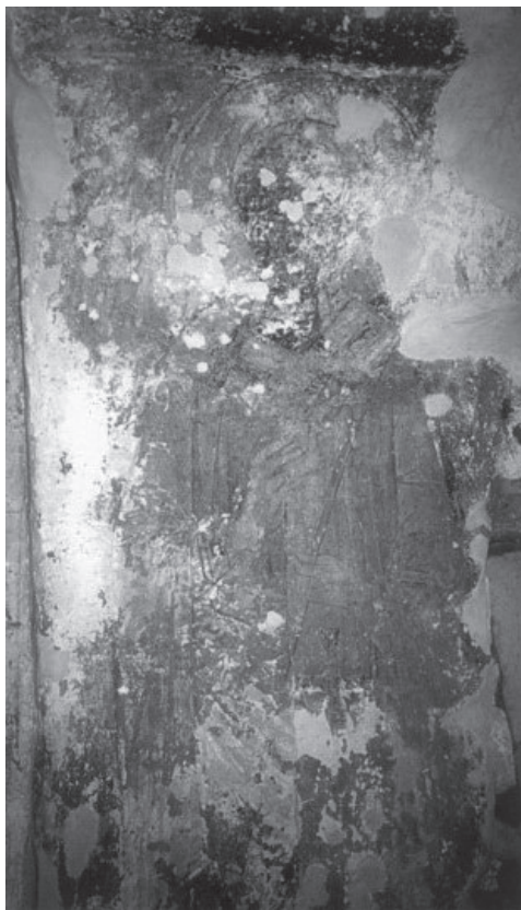
Sl. 12. Prikaz biskupa sveca, Franačka vrata u Naupliji (Hirschbichler, „The Crusader Painting“, 16, sl. 6.).