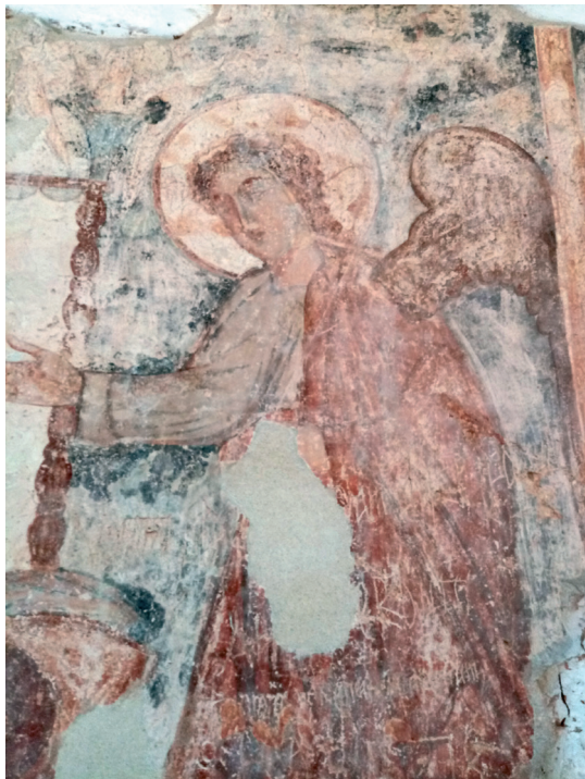
Sl. 10. Crkva Rođenja Presvete Bogorodice, Koprivna: svetište, arkandeo Gabrijel