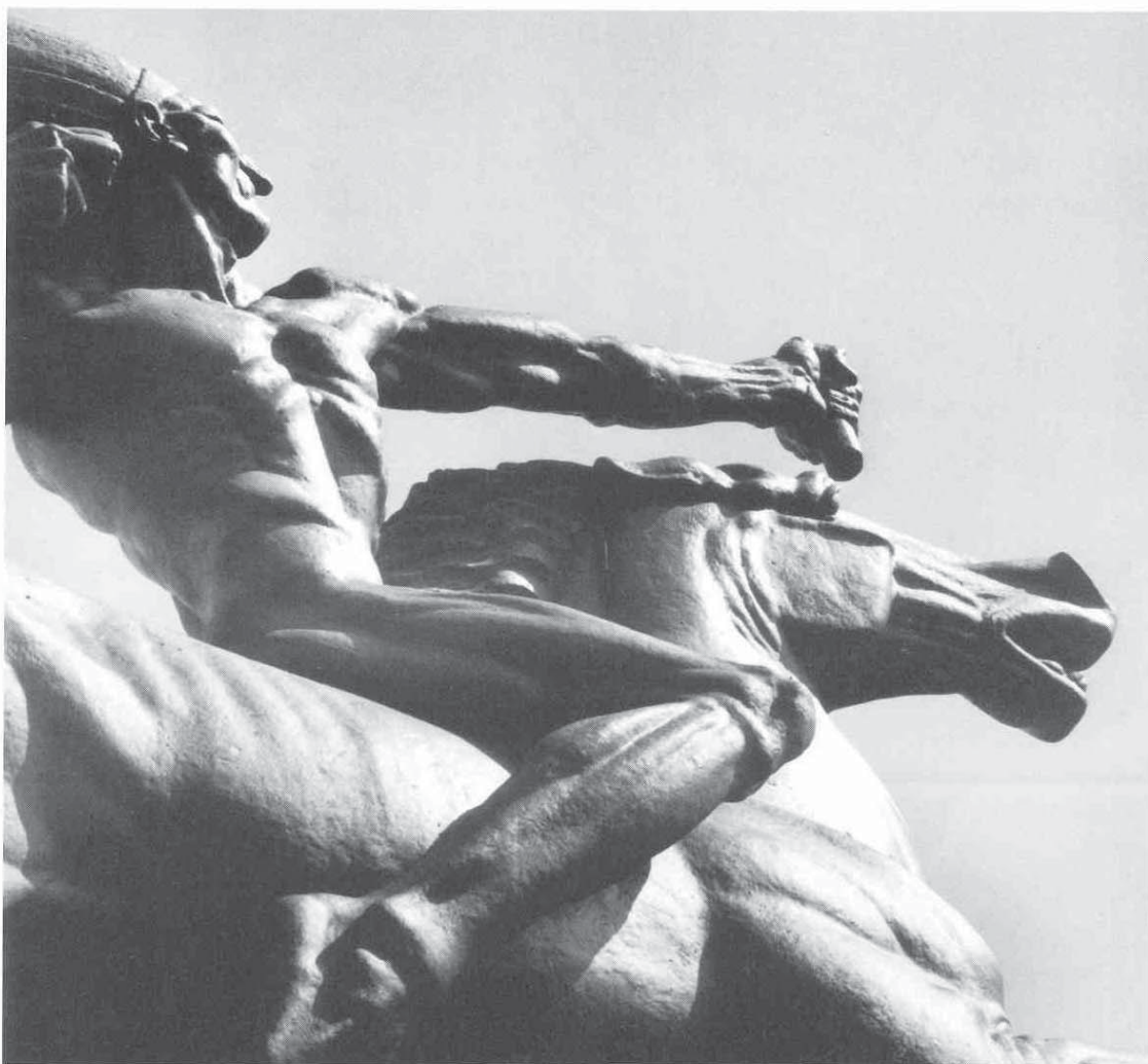
1 Indijanac (detajl), bronca, Grant Central Park u Chicagu, 1928. / The Indian, brass, Grant Central Park, Chicago, 1928