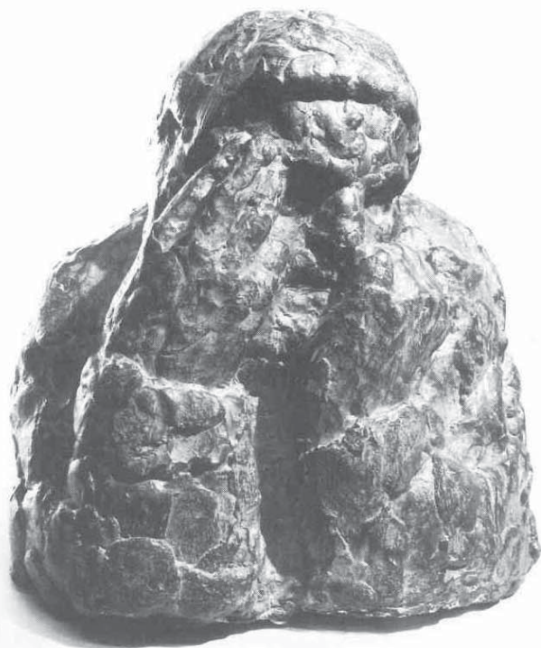
6 Posljednji autoportret (tugujući starac), patinirani gips, The Snite Museum of Art, University of Notre Dame, 1961. / The last selfportret (The mourning old man) , The Snite Museum of Art, University of Notre Dame, 1961

lijuna europskih Židova , koji je trebao biti postavljen u New Yorku. Problematika monumentalnih kompozicijskih rješenja na javnome mjestu kao i tema Mojsija također nisu novina u spektru Meštrovićevih interesa kao što, na žalost, nije novo da jedanovako grandiozno zamišljen i prostudiran Meštrović projekt nije nikada realiziran 13 . Skulptura Čovjek i sloboda (1953.), izvedena na sjevernoj fasadi klinike Mayo u Rochesteru, Minnesota, bila je Meštroviću slaba utjeha. Slobodni reljef s prikazom Mojsija (1952) u nadnaravnoj veličini, rađen za spomenik u New Yorku, odliven je u broncu i postavljen u parku skulptura Sveučilišta u Syracuseu zajedno s Jobom (1946.) i Persefonom (1946.). Glava Mojsija (sl. br. 4) u atriju knjižnice Sveučilišta Notre Dame odljev je još jedne studije za njujorški projekt. Narudžbe katoličke crkve u SAD, koja je u Meštroviću našla sretan spoj umjetničke kvalitete u okviru figuracije i interesa za sakralnu umjetnost, kontinuitet koji pamtimo u njegovu opusu još od prvog svjetskog rata, bile su dodatni poticaj Meštrovićevoj