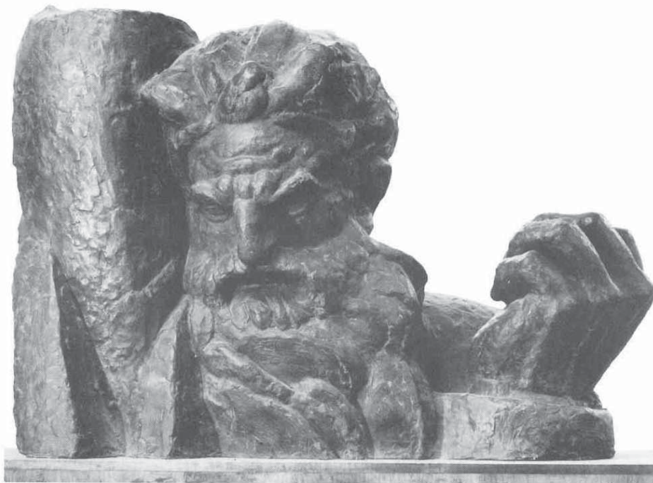
4 Glava Mojsija, bronca, Hesburgh Library, University of Notre Dame, 1950. / The head of Moses, brass, Hesburgh Library, University of Notre Dame, 1950

čilišta u SAD, započelo s programom dovođenja na sveučilište istaknutih imena iz cijelog svijeta na području znanosti i umjetnosti radi podizanja akademske razine sveučilišta i njegove internacionalizacije. Iako primljen s uvažavanjem, Meštrović je imao puno manje razloga za entuzijizam. Nakon velikog uspjeha u Europi i utjecajne pozicije u domovini, morao se suočiti sa skromnim budžetom, neprimjerenim uvjetima za rad, s niskom akademskom razinom u umjetnosti, naročito u skulpturi, i minimalnom financijskom potporom za svoje vlastite autorske projekte. K tome, suvremena američka umjetnost, diktirana iz New Yorka, usmjerena isključivo na istraživanje forme, novih materijala i tehnika, bila je nespojiva s Meštrovićevim senzibilitetom i osnovnim postavkama o umjetnosti i poslanju umjetnika, duboko ukorijenjenima u njegovu cjelokupnom opusu. Unatoč teškoćama, kojima svakako valja pribrojiti i Meštrovićevu emotivnu frustraciju vezanu uz njegov odnos prema domovini, godine provedene u Syracusi bit će izuzetno produktivne za Meštrovića. Svojom poslovičnom marljivošću i energijom nastavio je raditi sa studentima, ali i na vlastitim projekti-