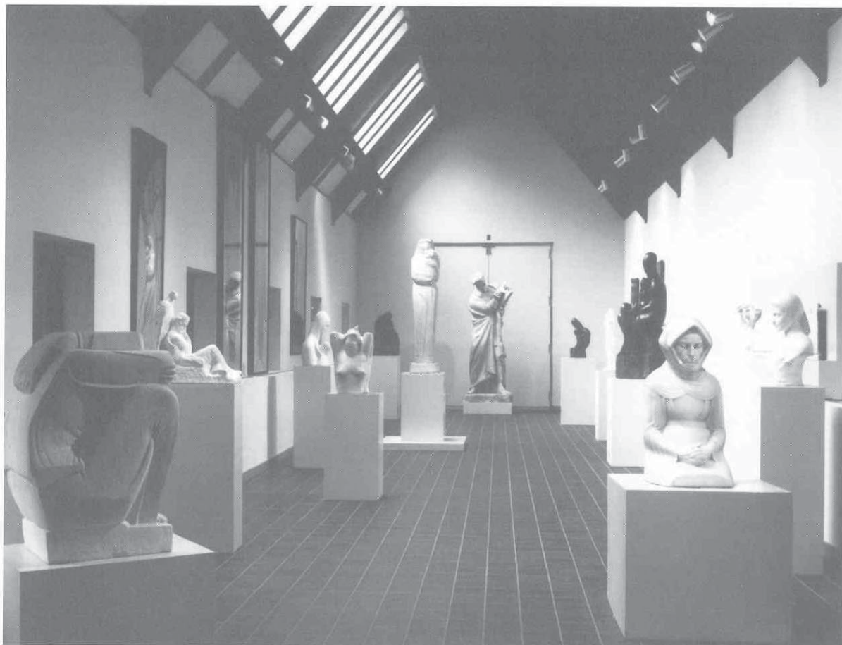
7 The Meštrović Gallery (interijer snimljen 1986. g.) u sklopu The Snite Museum of Art, University of Notre Dame / The Meštrović Gallery (interior photographed 1986), The Snite Museum of Art, University of Notre Dame

ma of the twentieth century sculpture in America.