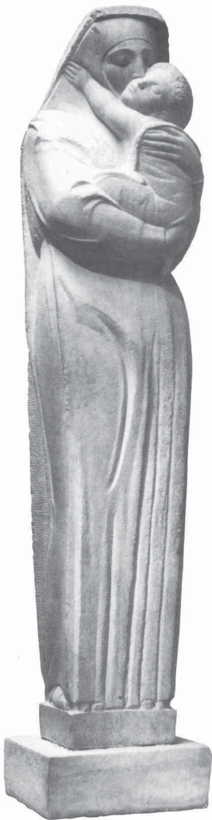
3 Bogorodica s djetetom, mramor, University of Syracuse, 1947. / Madonna with a Child, marble, University of Syracuse, 1947

jet” u potrazi za osobnom i artistskom slobodom i prosperitetom.