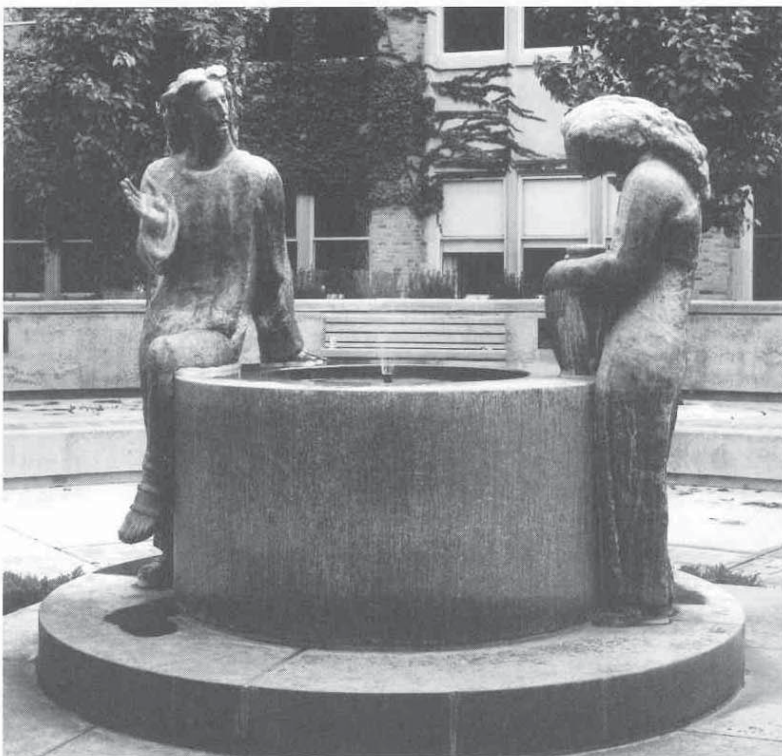
5 Jakovljević zdenac, bronca, The Snite Museum of Art, University of Notre Dame, 1957. / Jakob Fountain, brass, The Snite Museum of Art, University of Notre Dame, 1957

linearne stilizacije. Meštrović ne napušta ni svoju omiljelu temu majke s djetetom s profanim ili sakralnim predznakom, poput Studije za majku i dijete (sl. br. 3). Za boravka u Syracusi također nastavlja i konačno dovršava seriju od 28 drvenih reljefa s prikazima Kristova života za crkvu-kapelu Sv. Križa u Kašteletu-Crikvinama u Splitu, koje je potom poslao u domovinu zajedno s još nekoliko naručenih javnih spomenika, među kojima Petra Petrovića Njegoša i Andriju Kačića Miošića . S velikom upornošću Meštrović je čak nekoliko godina (1949.-1952.) radio na naruđbi za javni spomenik Američki memorijal šest mi-