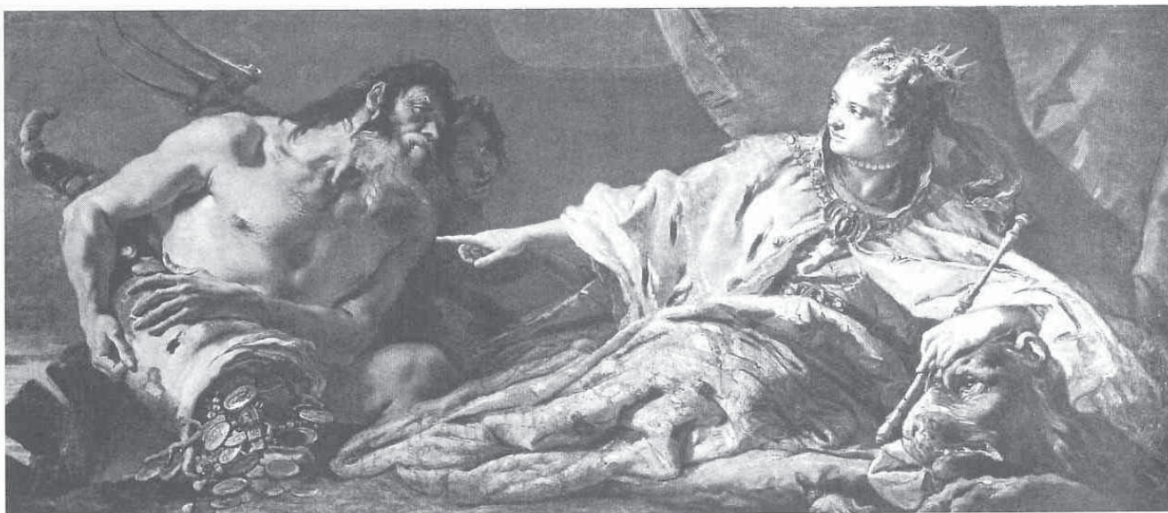
Giambattista Tiepolo, "Neptun daruje Veneciji darove mora" 1756.-58. / Giambattista Tiepolo, "Neptun donates to Venice the gifts of sea" 1756-1758

barem daju priloga za obnovu umjetnina. Navrate i Hrvati na stipendijama, na školovanju u Accademia di Belle Arti, na posjetu kakvoj izložbi u Palazzo Grassi, na turističkom izletu u aranžmanima Venecija - Firenza - Rim. Istarski kamen Rialta ili Ponte dei Sospiri, široka Riva degli Schiavoni, Držić i brojna druga svjedočanstva o svojim ulozima u Veneciju, o prožetosti vlastite s venecijanskom prošlošću pothranjuju osjećaj kako taj grad nije posve talijanski, nego i hrvatski, ma što Mlečani na to rekli.