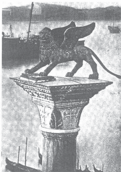
Lav na malom trgu (Pizzetta) sv. Marka / Lion at the Piazzeta of St. Marco

moć i ljubav dobro pokazao još one strašne noći 15. veljače 1341., kada je oluja prijetila uništiti grad, a on se