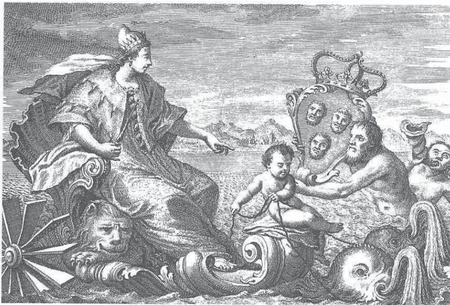
Grafika Andreje Zucchija s naslovnice prvoga toma Farlatijeve "Illyrici Sacri" 1751. / Print by Andrea Zucchi from the cover page of Farlati's Volume I "Illyrici Sacri" 1751

Čini se uobičajenom Canovinom zamisli, kakvih nalazimo podosta u umjetnikovu opusu. Sarkofag predviđen za Pesarovo tijelo ukrašen je reljefom s figurama Parki, koje podsjećaju na nepredvidljivost ljudske sudbine. Ali tko je ta žena koja neutješno plače naslonjena na sarkofag, glave pokrivene velom u znak korote? To nije alegorija pravde, pjesništva ili neka muza, ne, prvi puta na Canovinu modelu za Pesarov sarkofag prikazana je alegorija Venecije u suzama 5 , ne više ona lijepa i gorda