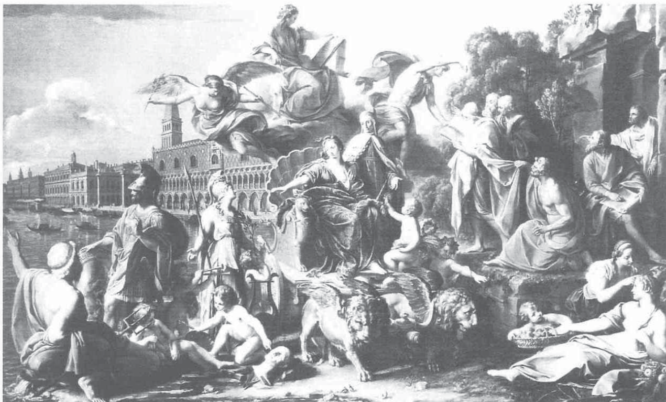
Pompeo Battoni, "Trijumf Venecije" 1737. / Pompeo Battoni, "The Triumph of Venice" 1737

tada sam pojavio i smirio sve napasti i hudobe? U znak čudotvorne pomoći predao je siromašnom venecijanskom ribaru prsten sa zadatkom da ga sutradan odnese duždu Pietru Gradenigu 3 i od tada mladenci - Venecija i more - sretno žive. More je donijelo i jedinu pomoć Veneciji - schiavonske lađe, ali ni one joj nisu promijenile žalosnu sudbinu.