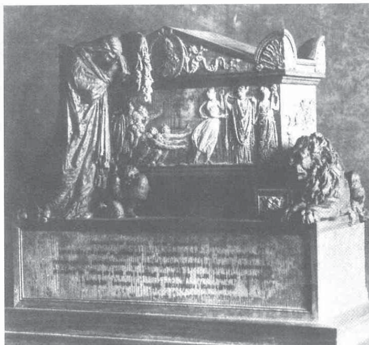
Antonio Canova, "Model pogrebnoga spomenika Francescu Pesaru" 1799/1800. / Antonio Canova: "The model of a tombstone for Francesco Pesaro" 1799-1800