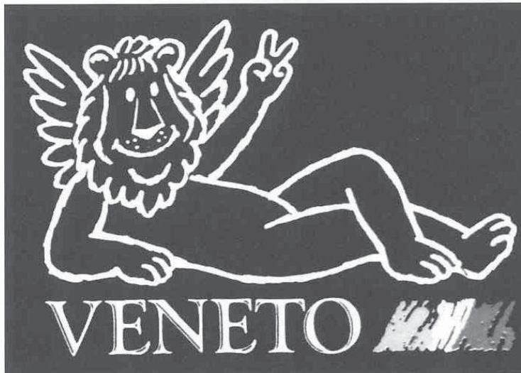
Lav u zaglavlju suvremene turističke brošure / Lion in imprint of a contemporary tourist brochure

voljnicima i oponentima venecijanskom centralizmu. I u Veneciji su jakobinci našli svoje pobornike, ali među građanstvom. Poriv njihovu nezadovoljstvu bila je isključenost iz aristokratske vlasti usprkos rastućoj ekonomskoj snazi upravo građanskoga staleža. S francuskim neprijateljima izvana, s domaćim nezadovoljnicima iz-